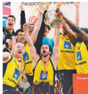
Celebración del Ilunion

Este domingo regresa la competición a la Primera FEB con sendos compromisos como locales para los madrileños: Movistar Estudiantes-Hestia Menorca y Flexicar Fuenlabrada-Real Valladolid.