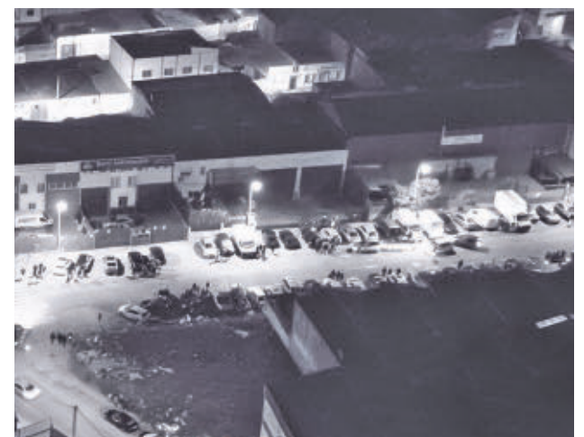
Concentración ilegal de 'tuning' en Leganés

En el registro se incautaron sustancias estupefacientes preparadas para su venta, así como más de 8.000 euros en efectivo, que se encontraban ocultos en diferentes lugares.