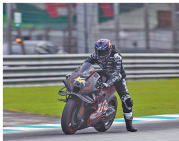
Jorge Martín defiende este año el título de campeón

El piloto de San Sebastián de los Reyes se estaba preparando para el Gran Premio inaugural del curso 2025, que se disputará en el Circuito Internacional de Chang, tras haber estado apartado de la mayoría de los test de pretemporada después de su caída en el primer día de pruebas en Sepang, pero finalmente no será de la partida este fin de semana al sufrir unas fracturas en la mano izquierda tras una caída durante un entrenamiento previo. Martín