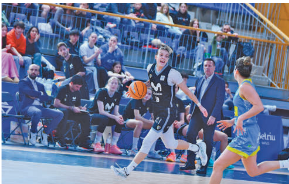
Las colegiales aún no conocen la victoria en la cancha del Cadi La Seu