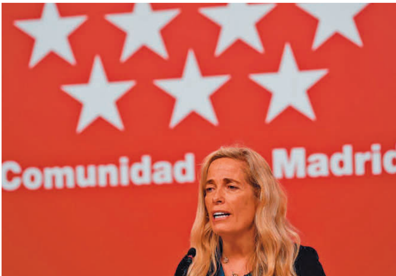
Rocío Albert, durante la rueda de prensa tras el Consejo de Gobierno