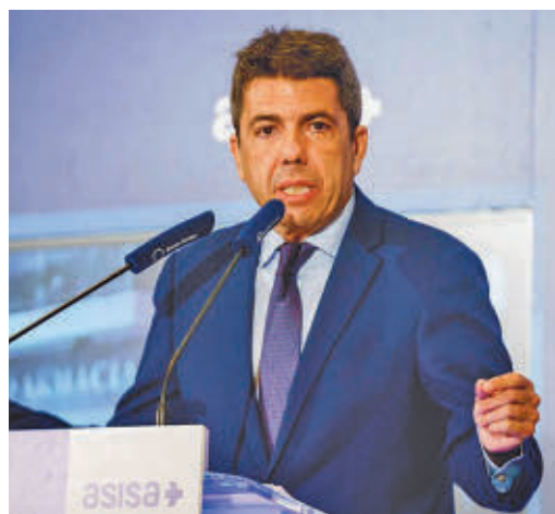
El presidente valenciano Carlos Mazón

EL PERIÓDICO GENTE NO SE RESPONSABILIZA NI SE IDENTIFICA CON LAS OPINIONES QUE SUS LECTORES Y COLABORADORES EXPONGAN EN SUS CARTAS Y ARTÍCULOS