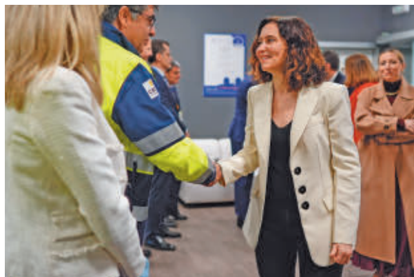
Ayuso, durante la visita a Almaraz

A su juicio, el cese de actividad de Almaraz pondría en riesgo el suministro en zonas de alta demanda como la Comunidad de Madrid, tenien-