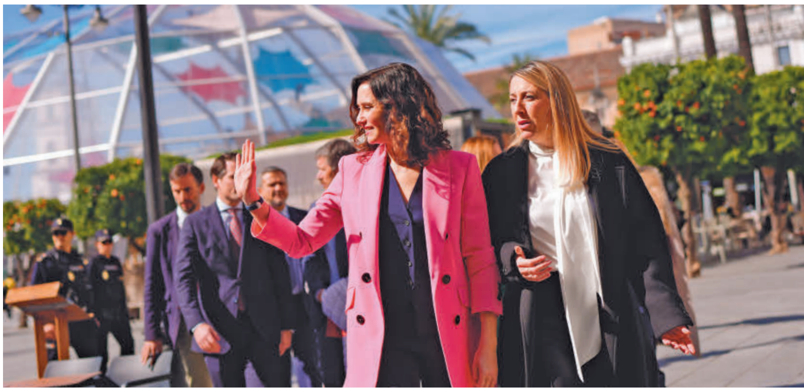
Ayuso y Guardiola, durante la cumbre de esta semana en Mérida

"Por eso nosotros exigimos desde los dos gobiernos una política energética que esté apegada a la realidad sin ideología, con rigor científico. Es lo único que se pide, rigor. Y que está a la altura de los tiempos, que cuide verdaderamente del medio ambiente, de la industria, del empleo, de la autonomía energética de España, que no nos haga rehenes de potencias extranjeras y que no ponga las empresas energéticas en el disparadero para luego usarlas de coartada", señaló