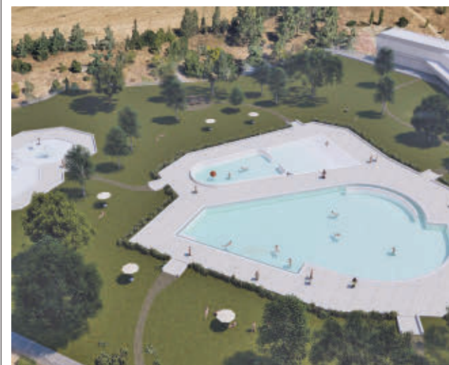
Así serán las piscinas de Solagua