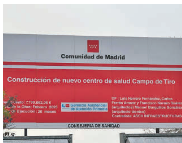
Cartel que anuncia las obras