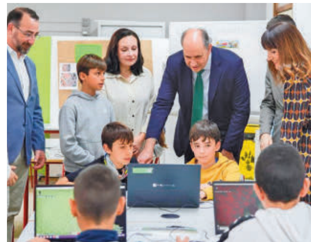
El consejero visitó uno de los centros participantes

En total se han formado 98 equipos con un máximo de 25 integrantes, que, guiados por un profesor, deberán resolver diferentes retos sobre el patrimonio de su localidad.