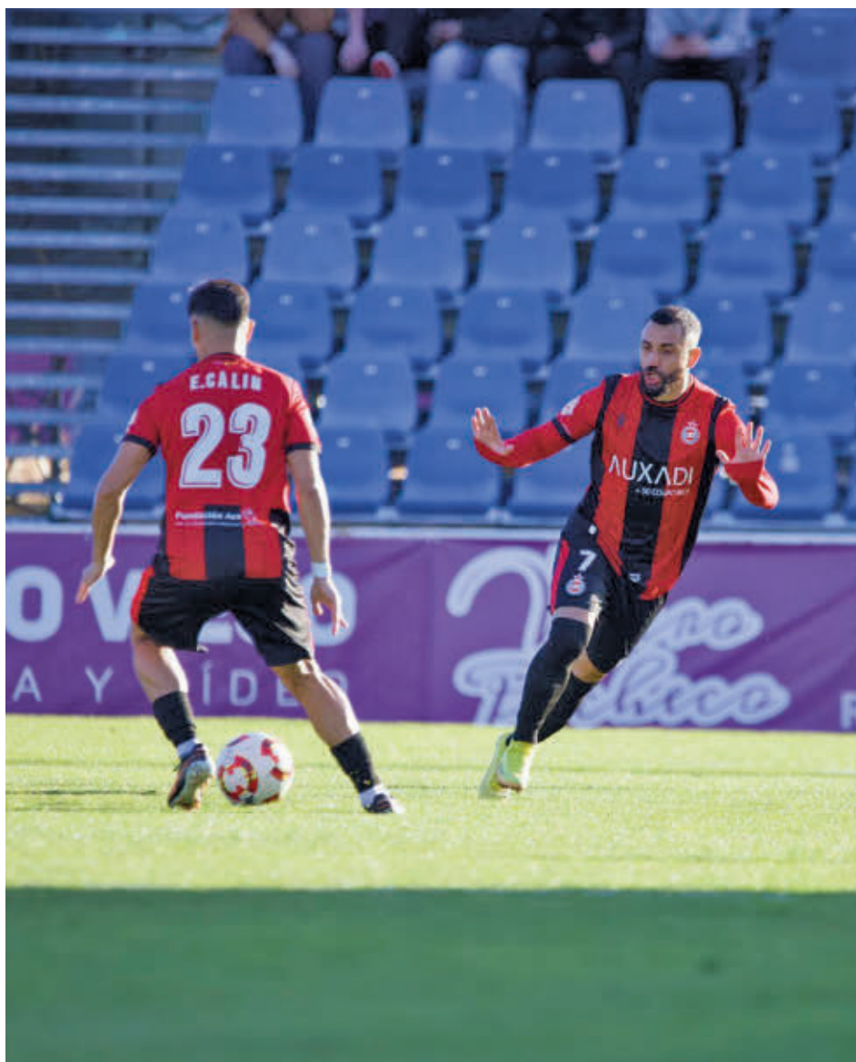
El Adarve sacó un valioso empate del campo del líder, el Guadalajara UNIÓN ADARVE

Rivales de altura También tendrá una incidencia directa en la zona baja el duelo de Matapiñonera de