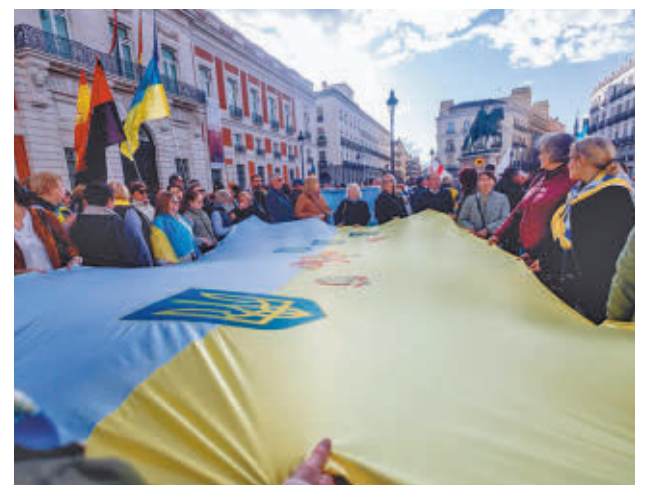
Acto de apoyo a Ucrania en la Puerta del Sol E. P.

ha mostrado en todo momento un sólido compromiso con Ucrania y el pueblo ucraniano” y recordó que esta invasión atenta contra la “soberanía, la integridad territorial e independencia política” de Ucrania, además de “amenazar a Europa entera y a todo Occidente”. “Apoyamos firmemente la soberanía e integridad territorial de Ucrania, y mostramos todo nuestro apoyo y solidaridad con el pueblo ucraniano”, añadió, pidiendo al Gobierno español y a la comunidad internacional apoyo para Ucrania.