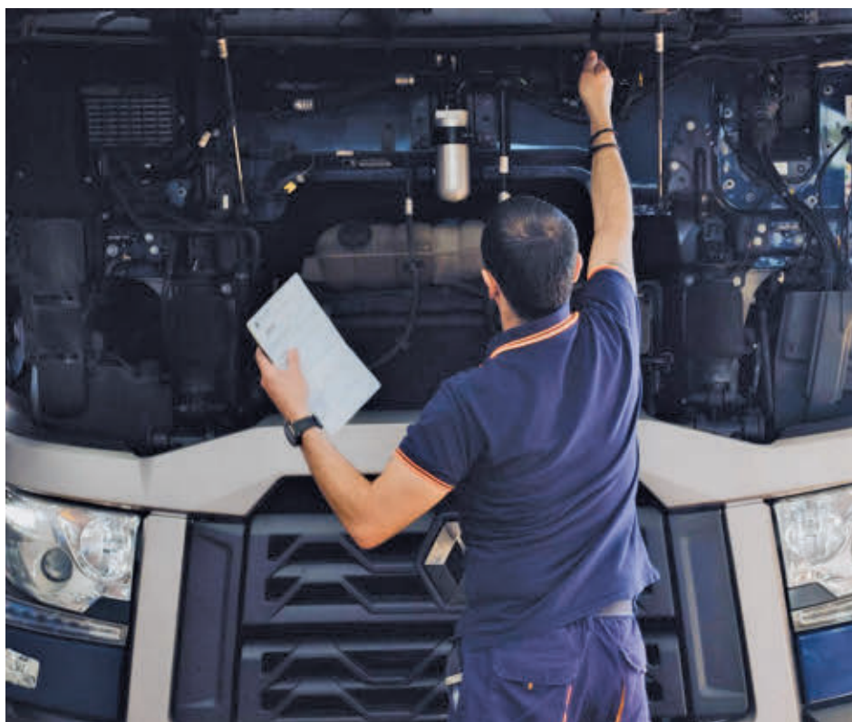
Un empleado hace la inspección a un vehículo E. P.

Desde el sector de las ITV recuerdan que no tener pasada