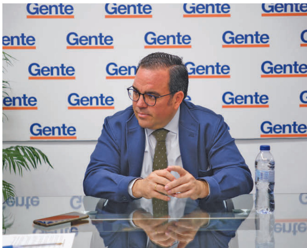
CARLA FLECHA / GENTE