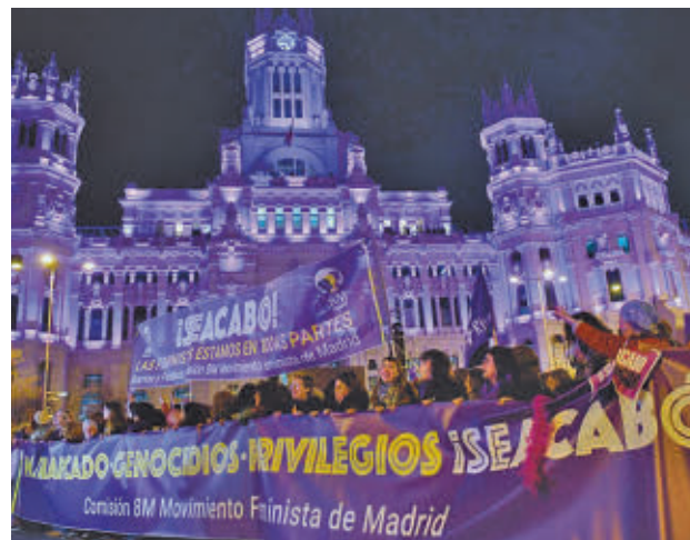
Marcha del año pasado de la Comisión 8M E. P.

en algunas ideas con motivo del Día Internacional de la Mujer. La marcha convocada por la Comisión 8M, que tendrá lugar a las 12 horas, saldrá desde Atocha y acabará en Plaza de España. Por su parte, la organizada por el Movimiento Feminista de Madrid partirá a las 18 horas desde la Plaza de Cibeles y finalizará