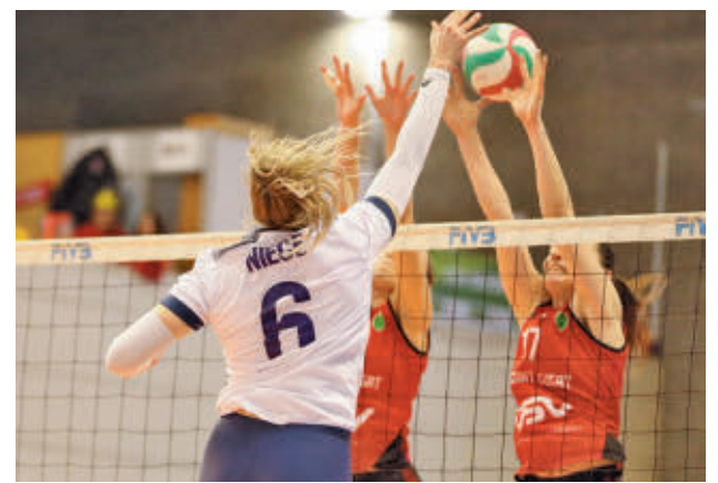
Triunfo vital de las madrileñas en Sant Cugat

Para abrir boca, este sábado 'Estu' y 'Fuenla' tendrán que hacer las maletas para jugar en las canchas del Air-carbooking Ourense y el Hestia Menorca, respectivamente. En caso de sumar una nueva victoria, ambos meterían presión a un San Pablo Burgos que esa misma tarde se verá las caras con el equipo que atraviesa un mejor momento de forma, el Real Betis. Sin demasiado tiempo para asimilar lo que suceda en estos encuentros, nueva jornada intersemanal con los duelos Amics Castelló-Estudiantes y Fuenlabrada-Cantabria.