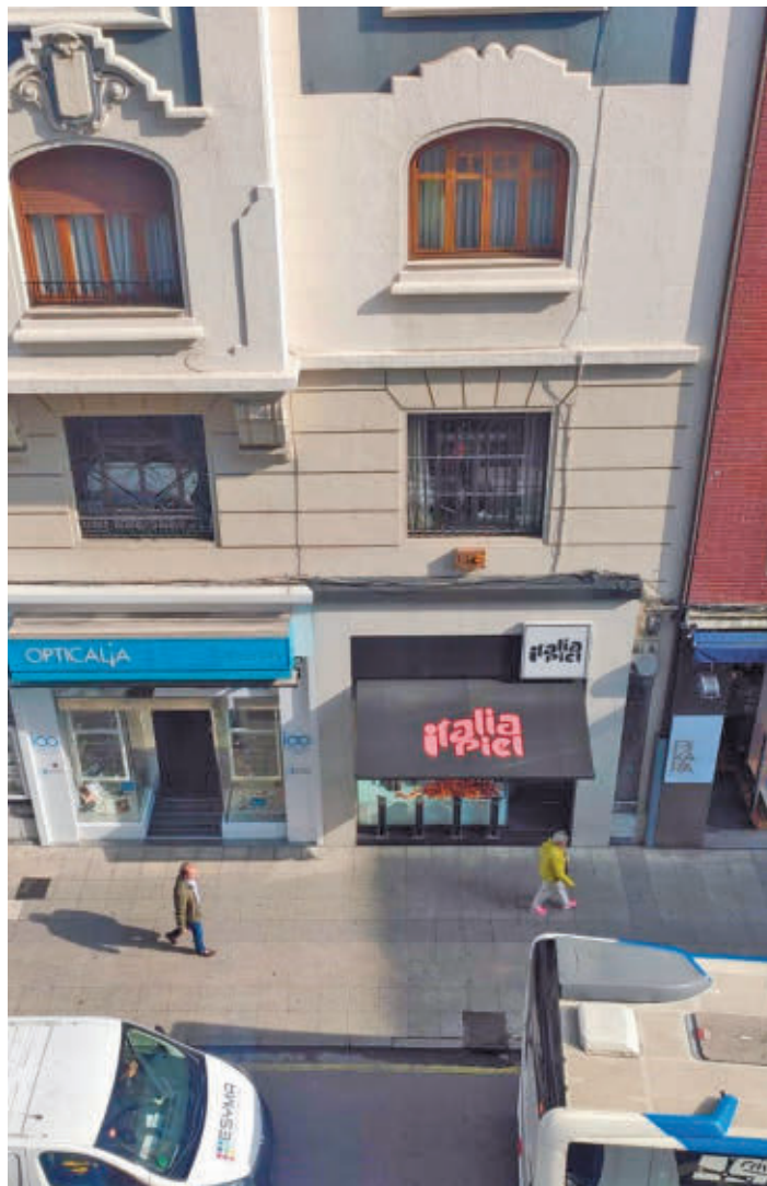
El precio del alquiler sigue subiendo en toda España E.P.

Barcelona continúa siendo la capital con los alquileres más caros con un precio de 23,7 euros por metro cuadrado, seguida por Madrid (21,2 euros) y San Sebastián (17,7 euros). Les siguen Palma (17,1 euros), Valencia (15,2 euros), Málaga (15,2 euros) y Bilbao (15 euros). Por el contrario, Ciudad Real y Badajoz, con 7,2 y 7,5 euros por metro cua-