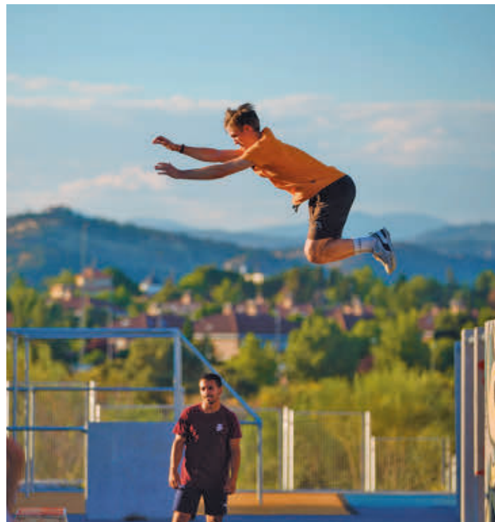
Una de las actividades del pasado año

Por su parte, los de tipo creativo se abrirán a disciplinas como dibujo, pintura, teatro, danza, modelado y fotografía y tendrán lugar en los centros culturales Pérez de la Riva y Entremontes. A su vez, los de educación ambiental se