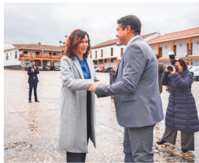
Isabel Díaz Ayuso visitó esta semana Valdemoro