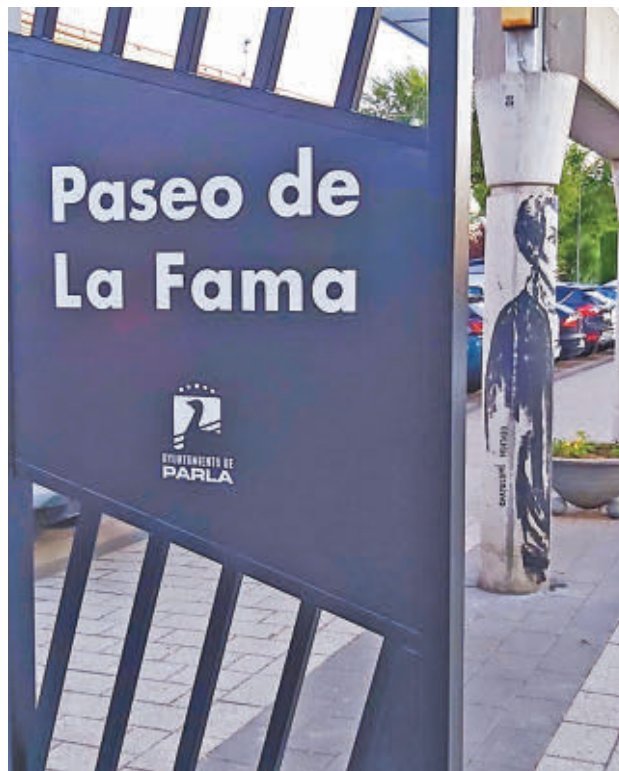
Paseo de la Fama de Parla

El primer parleño en recibir la columna fue el arquitecto real con Felipe IV y Carlos II, Bartolomé Hurtado. Le siguió el