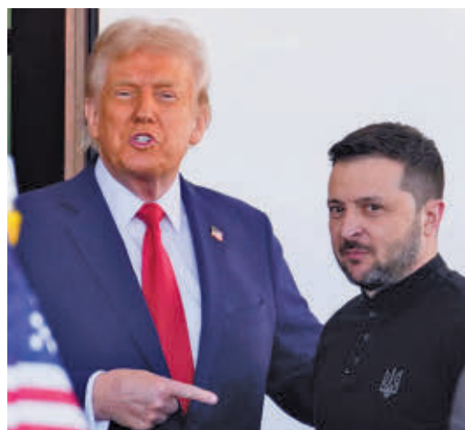
Trump y Zelenski, durante su encuentro

EL PERIÓDICO GENTE NO SE RESPONSABILIZA NI SE IDENTIFICA CON LAS OPINIONES QUE SUS LECTORES Y COLABORADORES EXPONGAN EN SUS CARTAS Y ARTÍCULOS