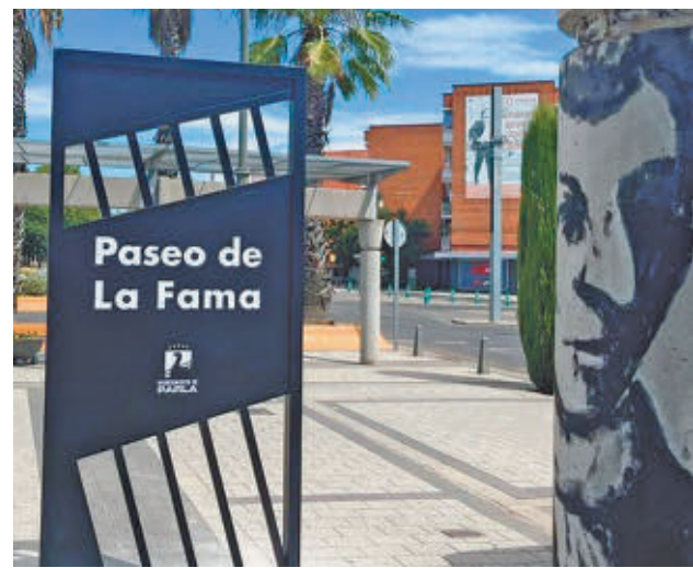
Paseo de la Fama de Parla