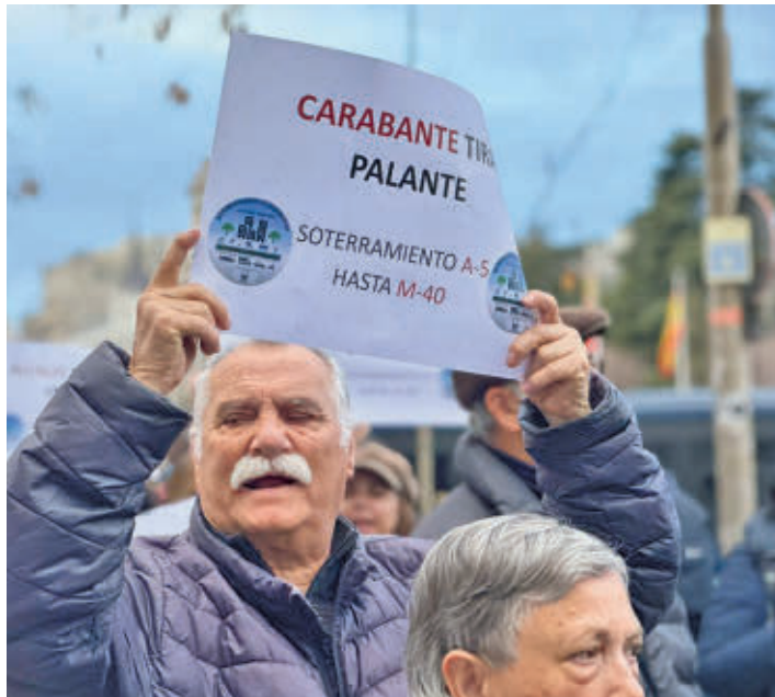
Un vecino muestra un cartel, en la protesta del 4 de marzo PSOE LATINA

‘Nosotros también somos Campamento’ o ‘soterramiento hasta la M-40’ fueron algunos de los mensajes más repetidos por las decenas de vecinos de Campamento que se concentraron, provistos de pitos, pancartas y carteles, frente al Palacio de Cibeles para exigir al Ayuntamiento la ampliación del proyecto de soterramiento de la A-5 hasta la M-40 y que no termine la