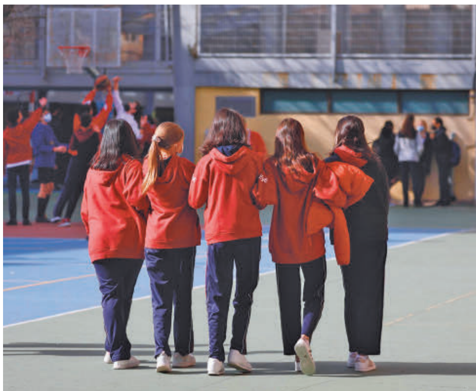
Alumnos en un centro de la Comunidad de Madrid E.P.

Este año la Comunidad de Madrid continuará aplicando las puntuaciones que fueron adaptadas para cumplir con la LOMLOE estatal. Así, aunque esta ley educativa prioriza la proximidad al centro del domicilio de los padres como criterio principal de admisión, el Gobierno regional seguirá primando otras circunstancias como tener