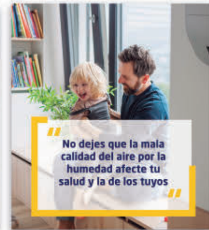
CALIDAD DEL AIRE