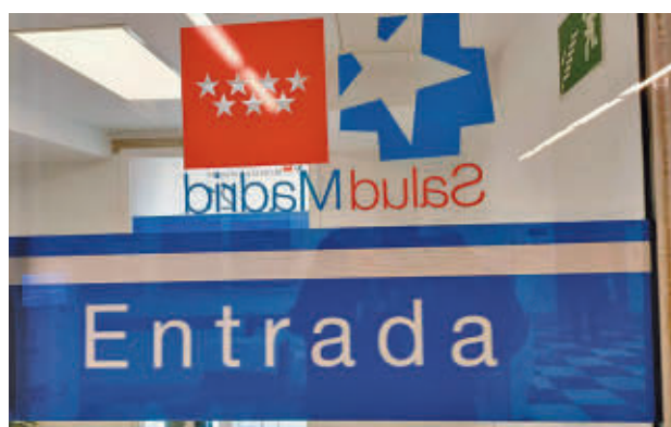
Entrada a un centro de salud E. P.

"Se observa prácticamente una unanimidad sobre la necesidad de llevar a cabo reformas que reviertan en mayor accesibilidad al propio sistema, compartición de datos, productividad y acceso a