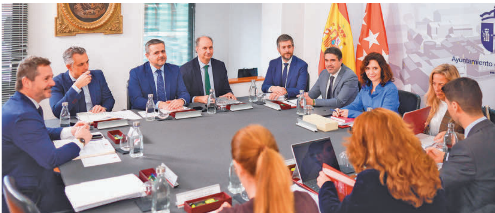
Reunión del Consejo de Gobierno de esta semana en el Ayuntamiento de Valdemoro