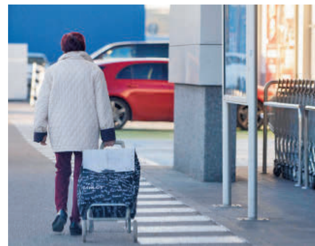
La cesta de la compra es uno de los principales gastos E.P.

La cantidad de dinero invertida en la cesta de la compra ha aumentado en 2024 un 1,6% y supone en términos absolutos unos 415 euros de media por hogar. Por otro lado, la partida de suministros energéticos asciende a 184,8 euros mensuales, un 9,8% de los ingresos totales, un importe que se ha reducido en un 6,3% respecto al año 2023.