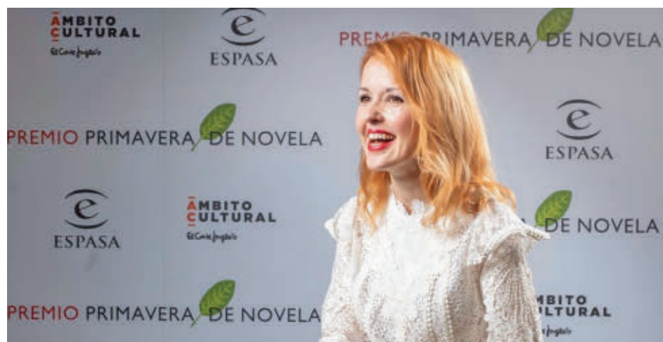
El premio se entregó en el Ámbito Cultural de El Corte Inglés

La autora plasma en esta obra a un personaje real que fue científica, justiciera y madrina de un crimen organizado femenino que se rebeló contra el Estado de Roma. Está