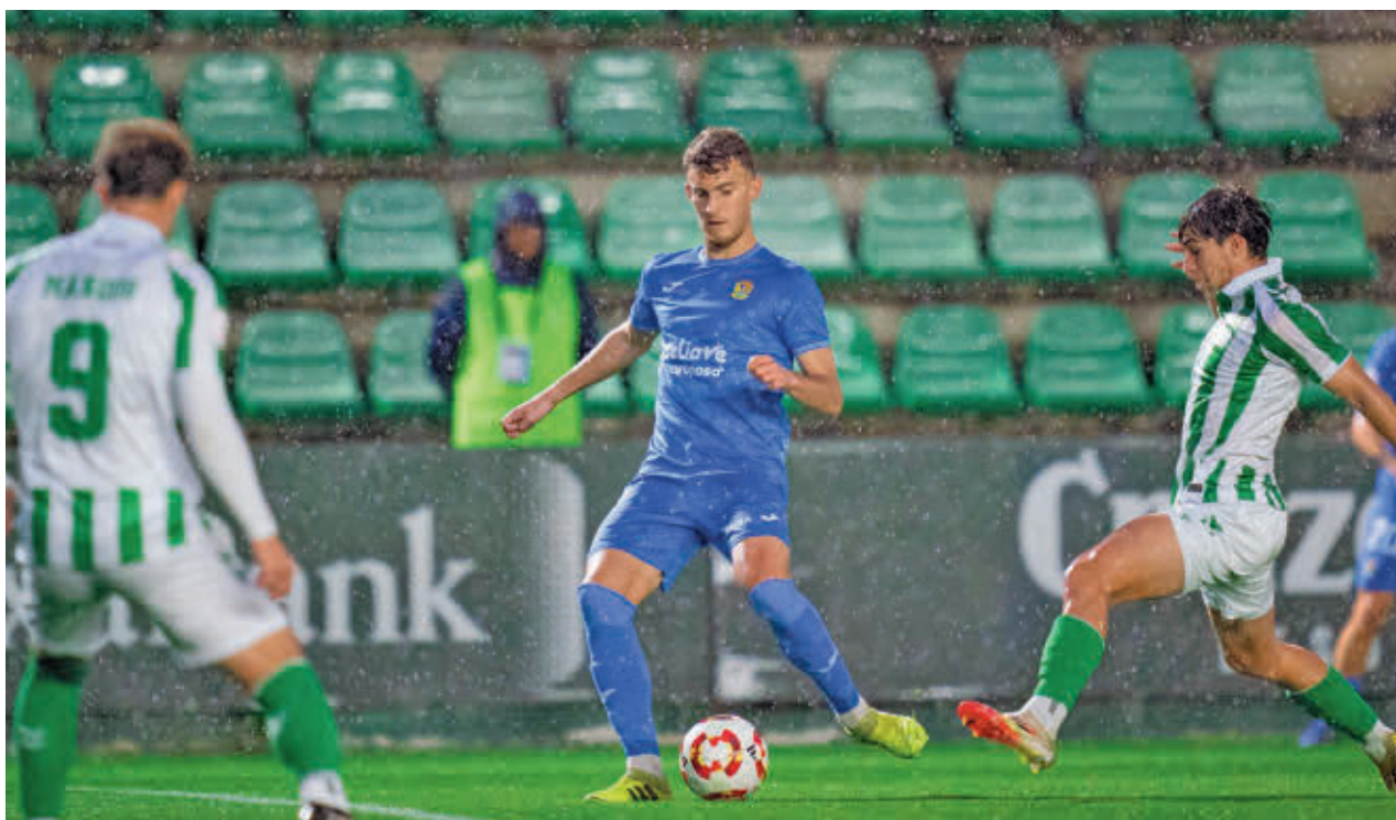
El Fuenlabrada arañó un punto en su visita al campo del Betis Deportivo CF FUENLABRADA