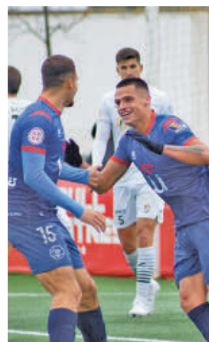
Otro triunfo azulón

Tampoco está para grandes alegrías el Unión Adarve, que afronta una salida complicada al campo del Cacereño tras perder con el Talavera.