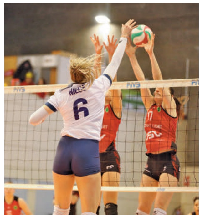
Triunfo vital de las madrileñas en Sant Cugat

Para rematar esa semana tan intensa, Estudiantes y Fuenlabrada se medirán el domingo 16 a otros aspirantes al ascenso: Súper Agropal Palencia y Tizona Burgos.