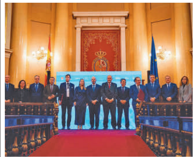
Foto de familia de los premiados