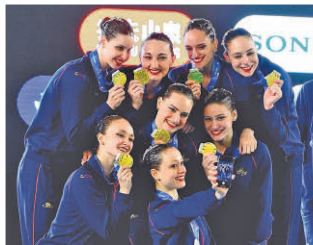
El equipo técnico se colgó el oro

En el caso de Lilou Lluís fue su primera presencia en el