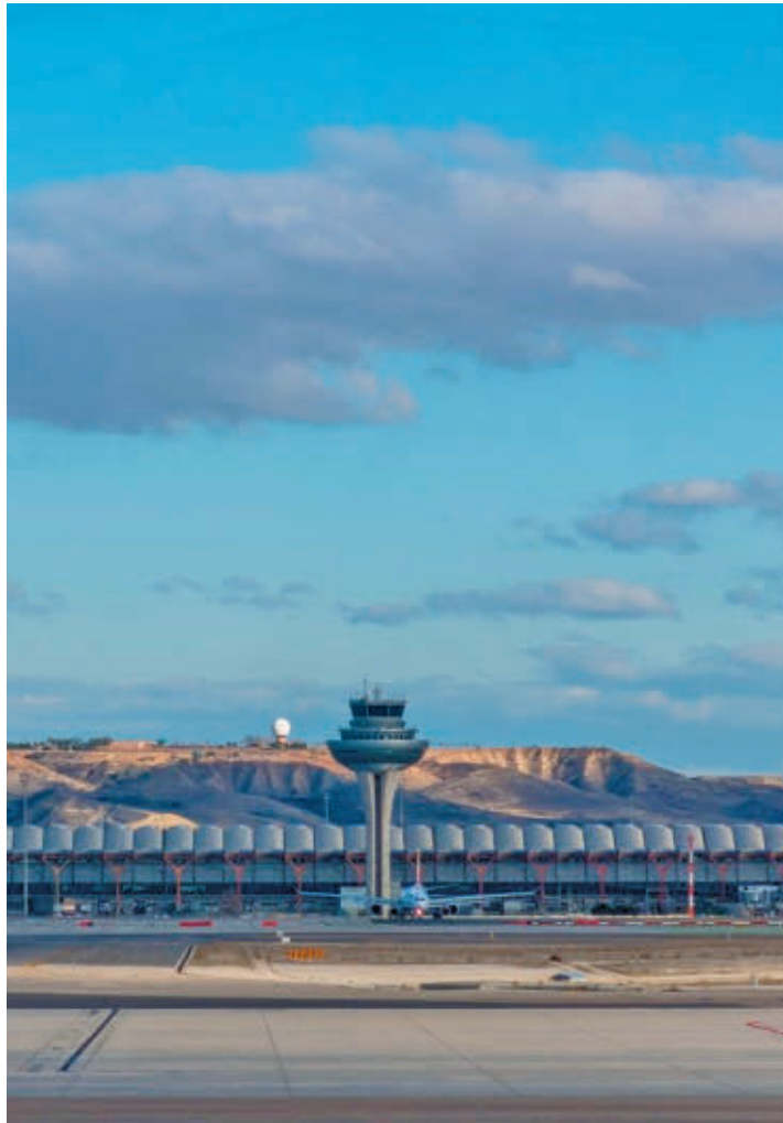
La cercanía de las terminales, un problema para la localidad

El edil defiende a través de un comunicado que “la localidad merece ser escuchada y que, de una vez por todas, los organismos dependientes del Ministerio de