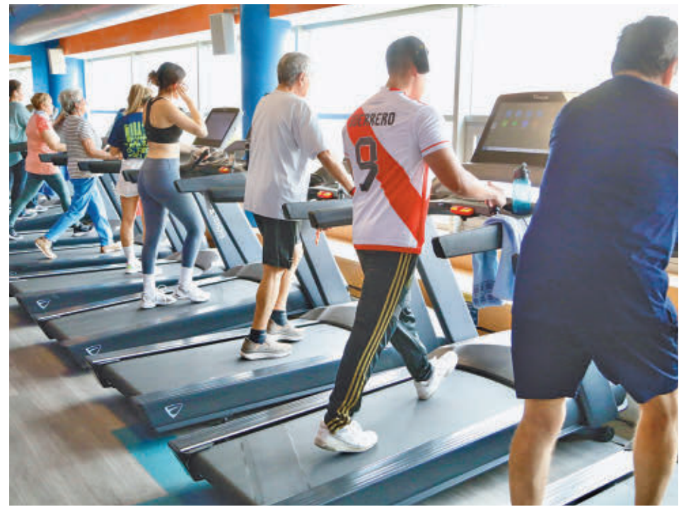
Usuarios en la Ciudad Deportiva de Valdelasfuentes