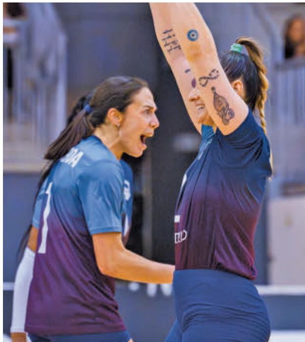
El Madrid Chamberí ha hecho un llamamiento a la afición