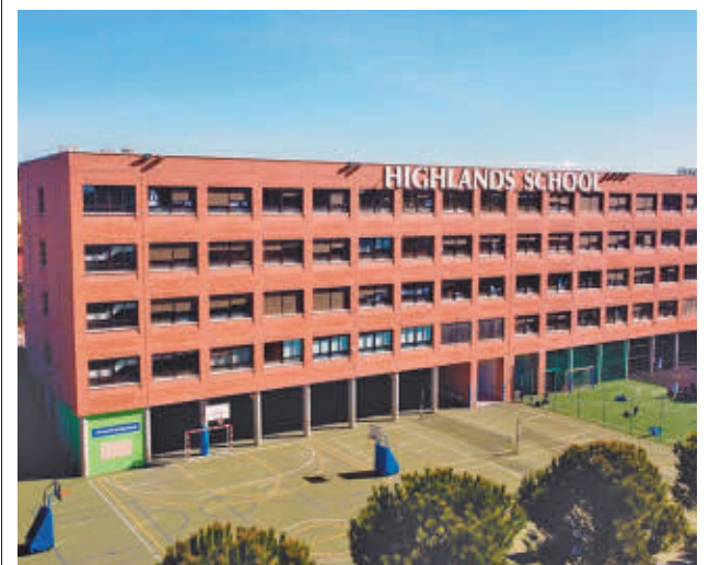
Instalaciones del centro escolar HIGHLANDS SCHOOL