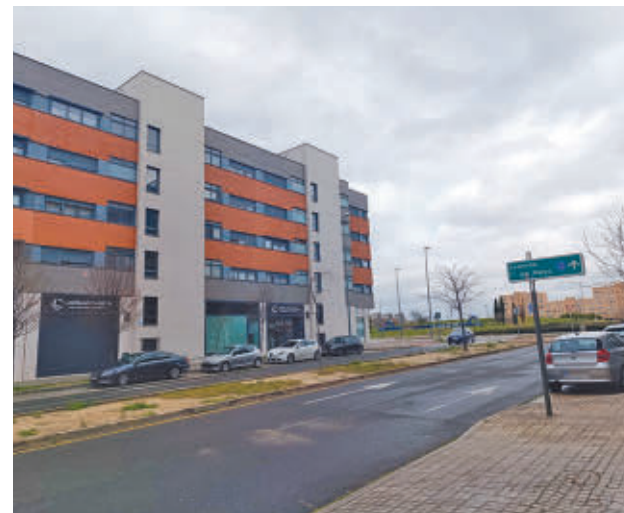
El Consistorio ha recuperado el control del patrimonio GENTE

En marzo de 2023 se iniciaban los trámites para recuperar el control de Emgiasa y de sus "38 locales, más de 2.000 plazas de aparcamientos y 4 viviendas nuevas", según señalaron entonces, poniendo de relieve la importancia de mantener la empresa municipal. Casi un año después de esto se aprobaba la ejecución del último auto del juez de lo mercantil que desarrolla el concurso de acreedores de Emgiasa, por el que se autorizaba a la entidad local a tramitar la adquisición de los activos y pasivos de la empresa.