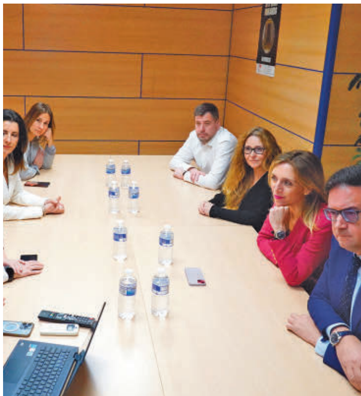
El ministro Óscar López visitó el Observatorio de Violencia de Género

De hecho, lo relevante es que se trata de una aplicación que trabaja con tecnología blockchain, cuyo contenido se almacena en la nube y no podrá visualizarse hasta que la usuaria dé su consentimiento expreso para uso legal. El vídeo y el audio que se generan estarán completamente protegidos, "no se pueden alterar, tienen un sello