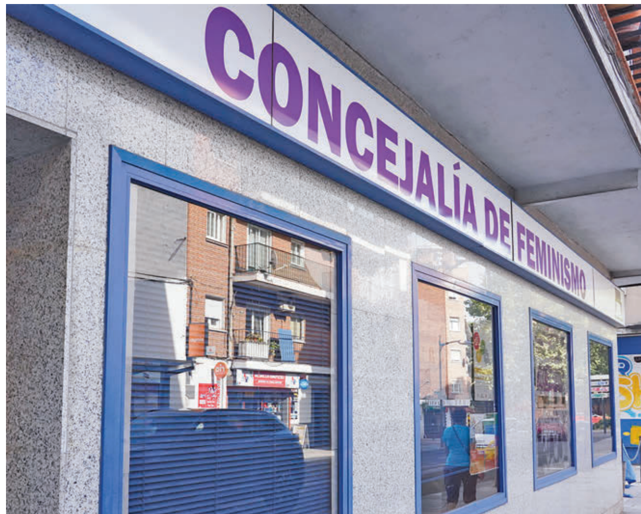
AYTO DE ALCORCÓN