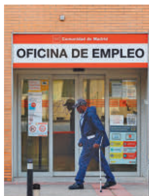
Oficina de empleo regional

Empleo Estatal (SEPE). Respecto al mes de febrero del año anterior, la ciudad registra un descenso de 333 personas, lo que se traduce en un descenso del 4,32% en los últimos doce meses. Peor es el dato si se compara con el mes anterior, ya que hay 143 desempleados más que en ene-