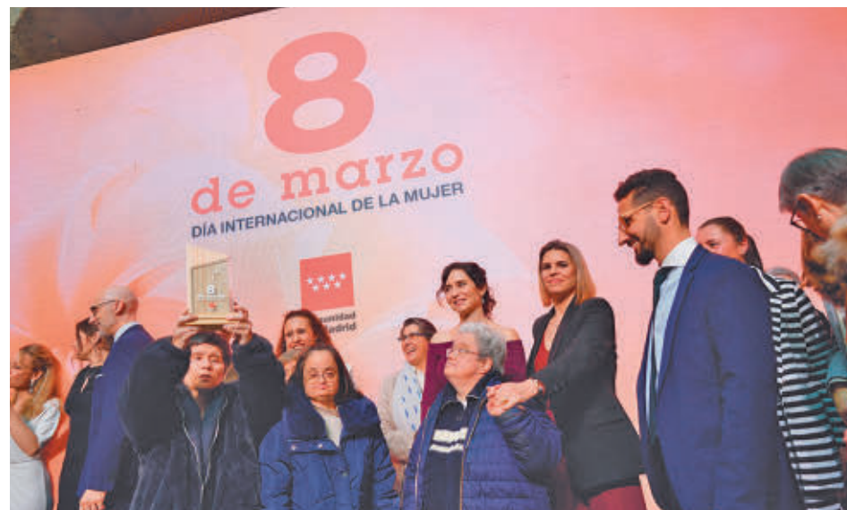
Las usuarias del Centro San José también estuvieron presentes