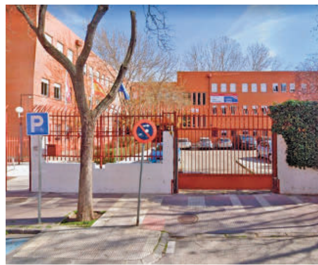
Instituto donde tuvieron lugar los hechos E.P.