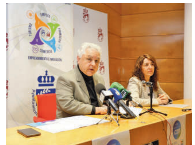
Presentación de la feria

La II Feria de la FP de Arganda centra este año su discurso en la divulgación del recurso de Brújula Mentores de la Comunidad de Madrid. Estos profesionales, que están ubicados en el IES La Poveda, se encargan de resolver todas las dudas sobre la FP tanto a alumnos como familias, y este viernes estarán presentes en el evento.