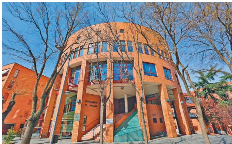
Ayuntamiento de Coslada

La colaboración ciudadana ha permitido a la Policía Local de Arganda del Rey y a la Guardia Civil la detención de cuatro personas acusadas de intento de okupación. Las actuaciones comenzaron el miércoles 5 de marzo y se prolongaron hasta la noche del día siguiente.