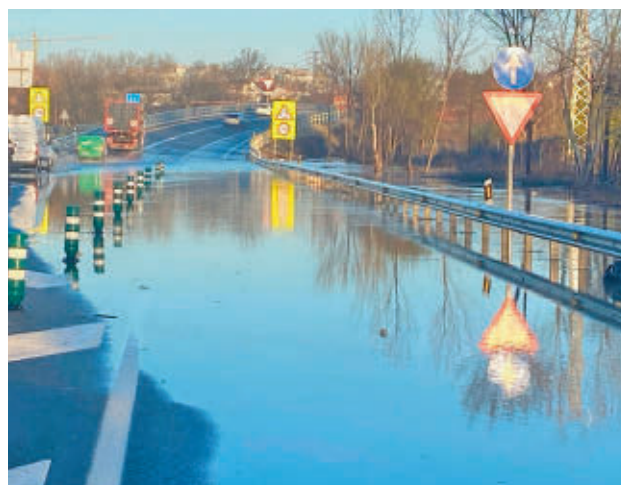
Carretera M-206 a la altura de San Fernando

Se espera que la normalidad vaya regresando a la localidad en los próximos días, según el Ayuntamiento.