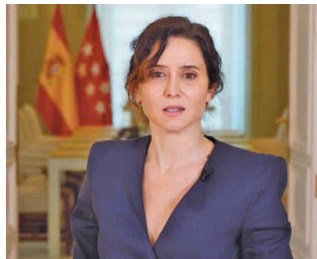
Isabel Díaz Ayuso, durante su mensaje

Juan Valderrama y Sole Giménez rinden homenaje a este género en ‘Algo contigo’