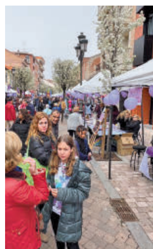
Será una cita festiva

en Fuenlabrada. Entre las citas destacadas que quedan por delante, este viernes tendrá lugar la obra 'Cavaret' que llevará a escena el Grupo Teatro 8 de Marzo de la Concejalía de Feminismo. "Es un lugar donde celebrar, reír y llo-