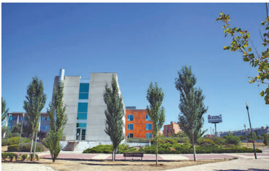
Convocadas las elecciones a rectorado de la URJC 2025 AYUNTAMIENTO DE FUENLABRADA