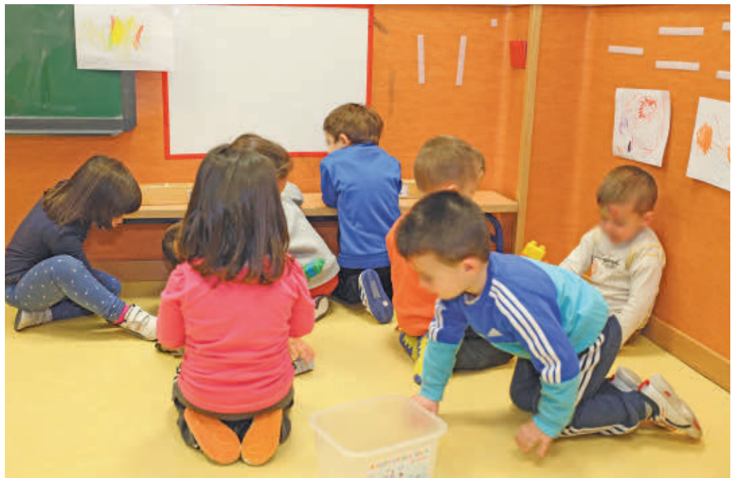
Los menores se divertirán mientras aprenden AYUNTAMIENTO DE FUENLABRADA

Para optar a una de las plazas, que están dirigidas a escolares de entre 3 y 12 años (hasta los 22 en el caso de la que se lleva a cabo en el colegio de Educación Especial Sor Juana Inés de la Cruz), se mantendrá abierta la preinscripción hasta el 17 de marzo. Se podrá realizar de manera telemática. La formalización de la so-