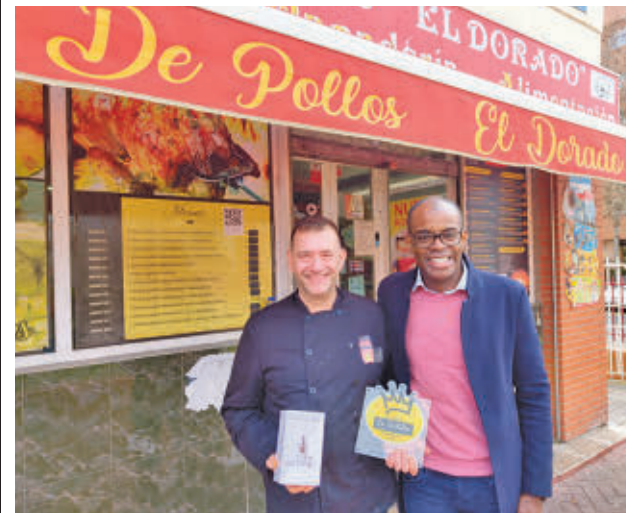
La 'Tortilla Trufada' ha sido la triunfadora AYTO DE FUENLABRADA

Los establecimientos ganadores volverán a vender, al mismo precio, sus pinchos premiados este próximo fin de semana. "Los clientes han sido quienes han decidido el ganador", han explicado fuentes municipales.