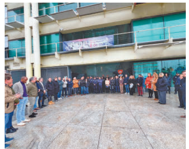
AYTO DE FUENLABRADA

El Ayuntamiento de Fuenlabrada se sumó a la convocatoria de la Federación Española de Municipios y Provincias (FEMP) guardando un minuto de silencio en la Plaza del Consistorio en recuerdo de las víctimas de los atentados terroristas del 11 de marzo de 2004.