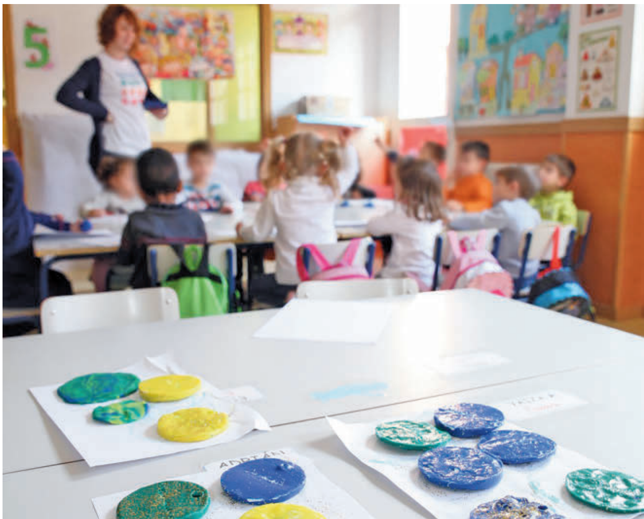
AYTO DE FUENLABRADA