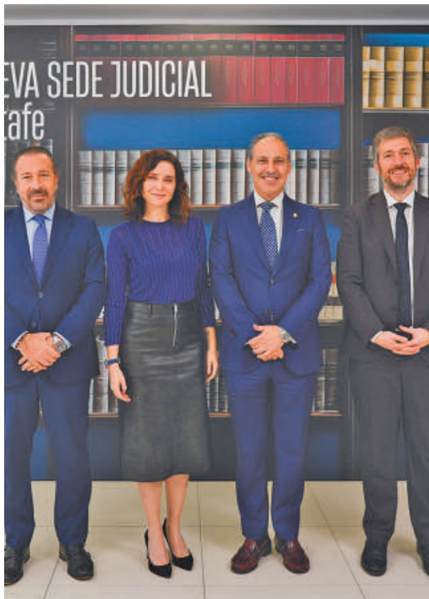
La presidenta regional visitó el Palacio de la Justicia CAM

EN EL ESPACIO SE LLEGA A ATENDER A UNA MEDIA DE 750 PERSONAS AL DÍA