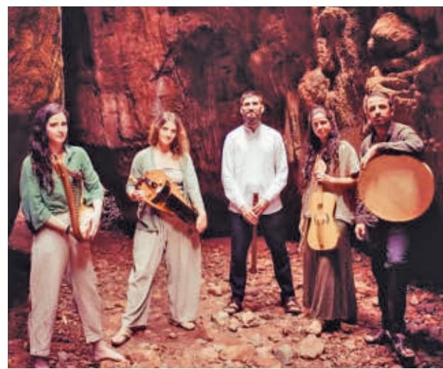
'El cantar del destierro', una de las opciones E. ENSEMBLE

GenteMadrid.es Consulte la actualidad regional y local en nuestra página web