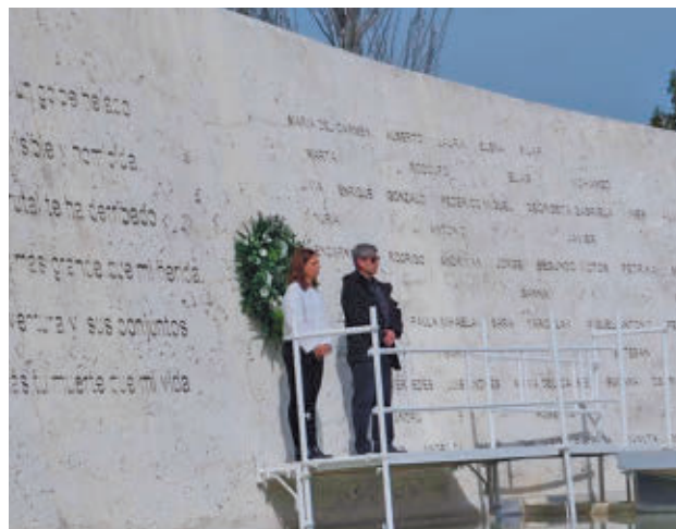
Monumento de homenaje víctimas AYUNTAMIENTO DE GETAFE

mento que se levantó junto al lago, que consta de dos láminas de agua sobre las cuales se asienta un muro de color blanco con todos los nombres de las víctimas del 11-M grabados y con poemas y frases escritas por los vecinos, así como un pebetero, cuya llama se enciende en su recuerdo. El Ayuntamiento invirtió 558.000 euros en su construcción.