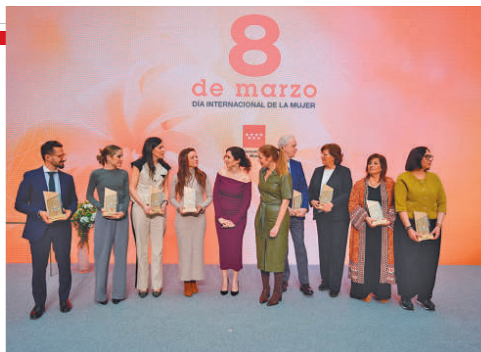
Foto de familia de los homenajeados este año

Más conocida como Verdelliss, es una de las 'influencers' más populares de España. Esta madre de ocho hijos ha completando recientemente el desafío World Marathon Challenge, prueba que consiste en correr siete maratones