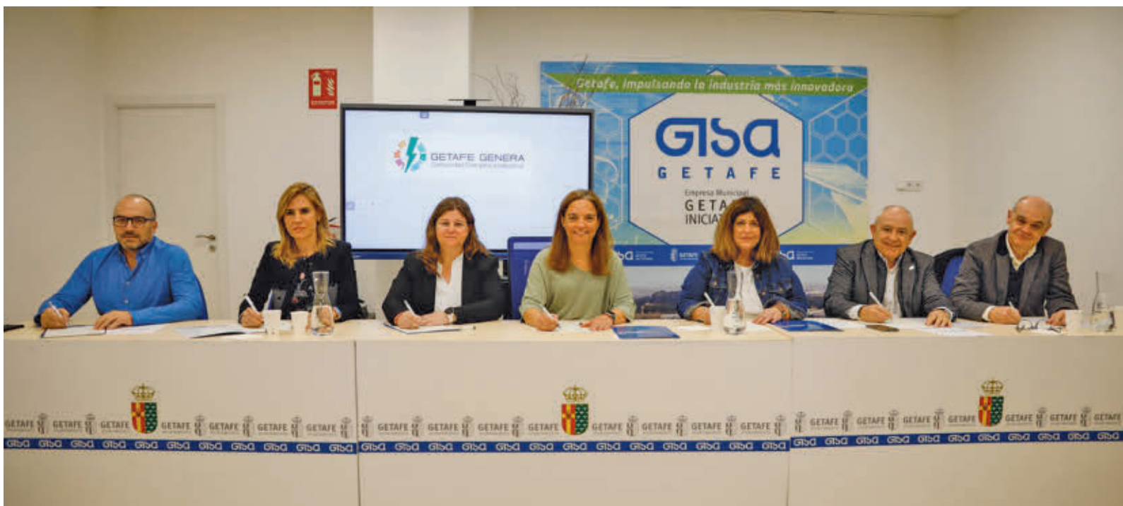
Las empresas rubricaron el acuerdo AYUNTAMIENTO DE GETAFE