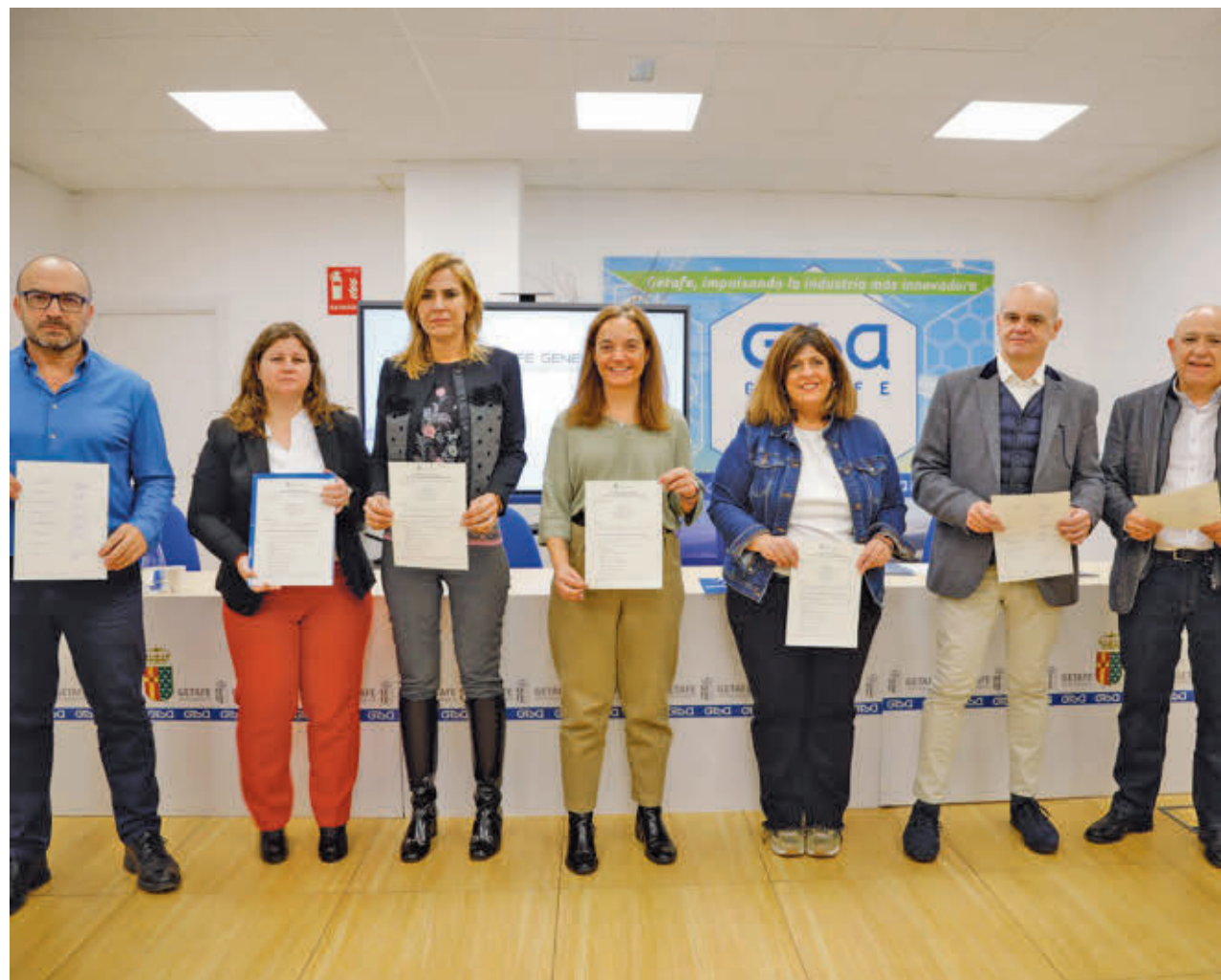
AYTO DE GETAFE