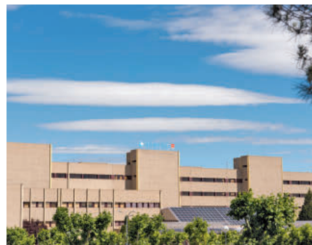
La de este viernes será una oportunidad para resolver dudas

Además de las presentaciones introductorias a cargo de los profesionales del hospital, se realizará una visita guiada