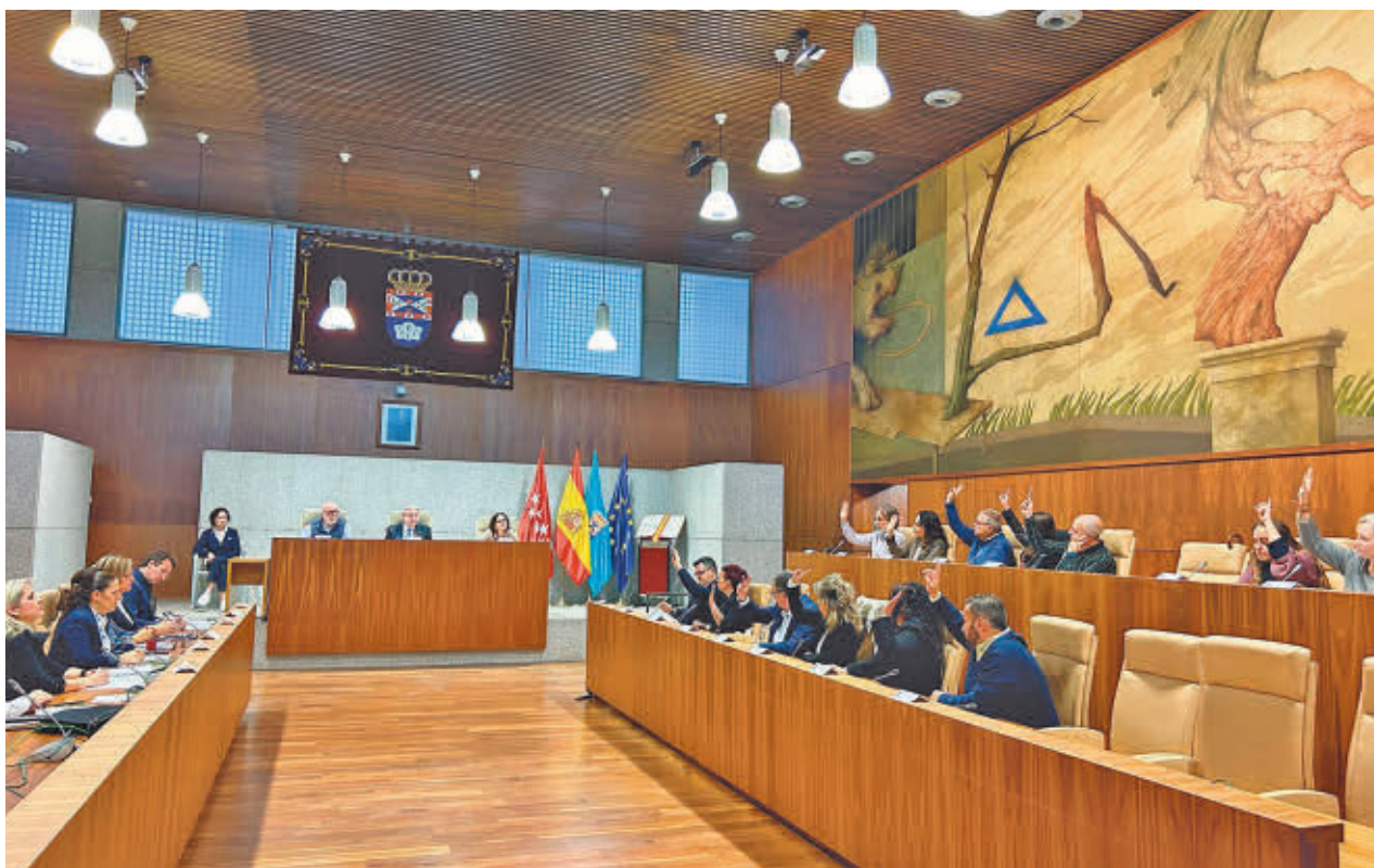
Los concejales de la oposición votan en contra del presupuesto