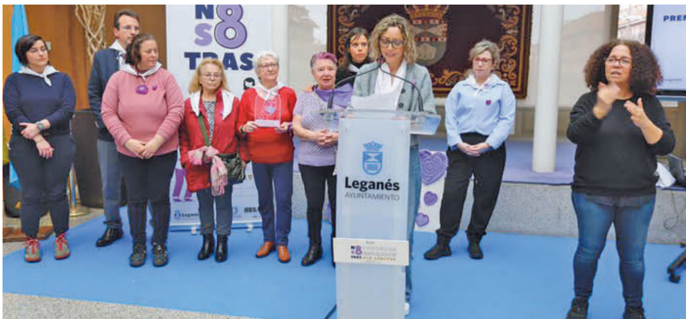
Entrega de La Mirada Violeta al Grupo Tejearte