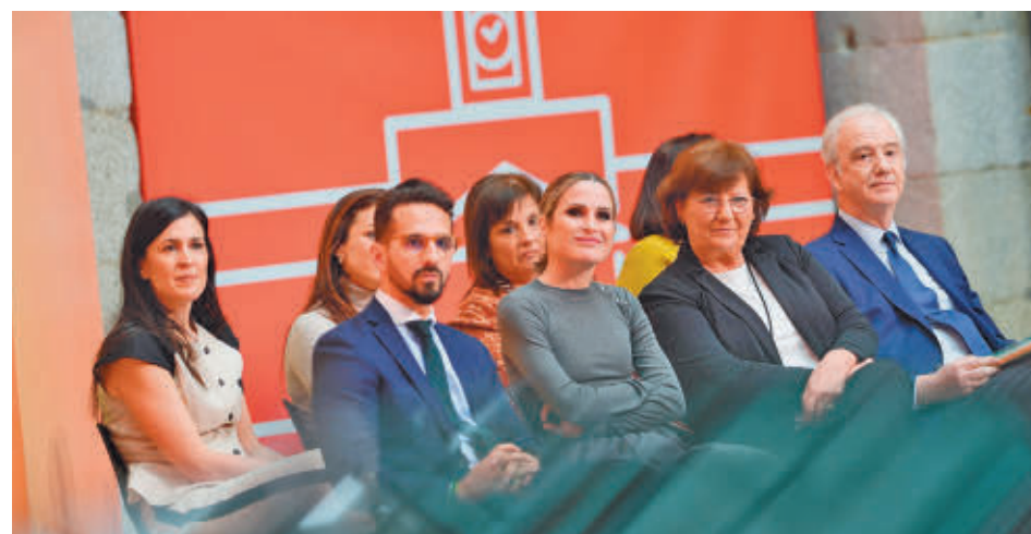
Los premiados, durante el discurso de la presidenta regional

EL ACTO DE ENTREGA SE REALIZÓ EN LA REAL CASA DE CORREOS