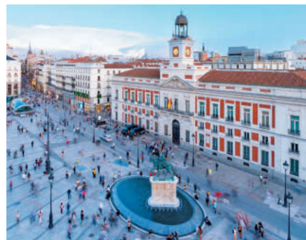
Casa de Correos en la Puerta del Sol

tubre por la Dirección General de Atención a las Víctimas y Promoción de la Memoria Democrática del Ministerio de Política Territorial y Memoria Democrática, por el que se incoó el procedimiento de declaración de Lugar de Memoria Democrática de la extinta Dirección General de Seguridad franquista, que se ubicaba en la Real Casa de Correos. En la misma impug-