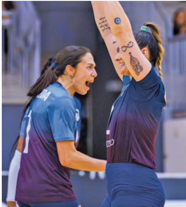
El Madrid Chamberí ha hecho un llamamiento a la afición