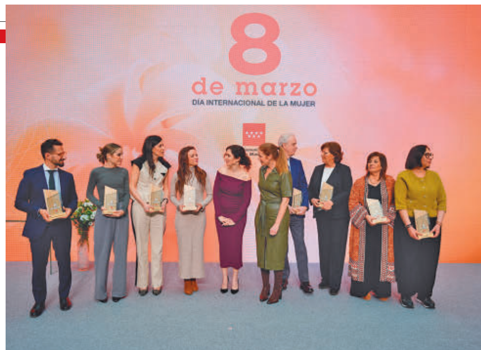
Foto de familia de los homenajeados este año