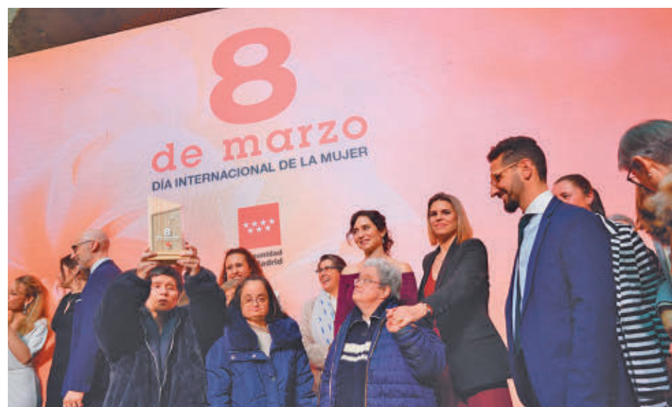
Las usuarias del Centro San José también estuvieron presentes