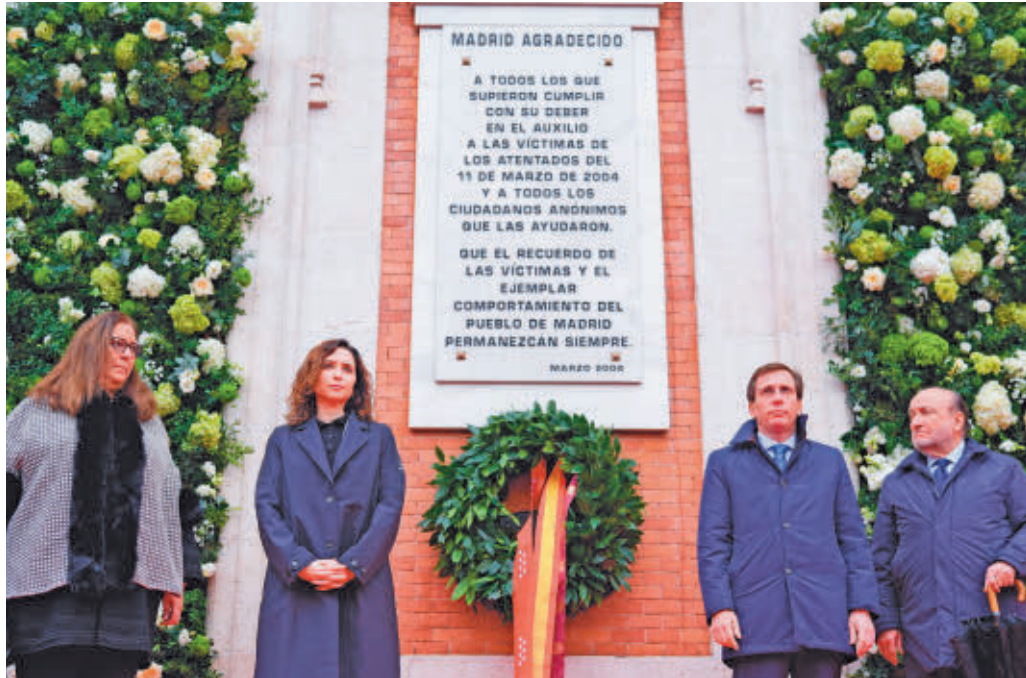
Ofrenda floral en la Puerta del Sol

A las 9 horas dio comienzo la ceremonia con el tañido de las campanas del reloj de la sede de la Presidencia regional en la Puerta del Sol durante dos minutos. También se sumaron a esta señal