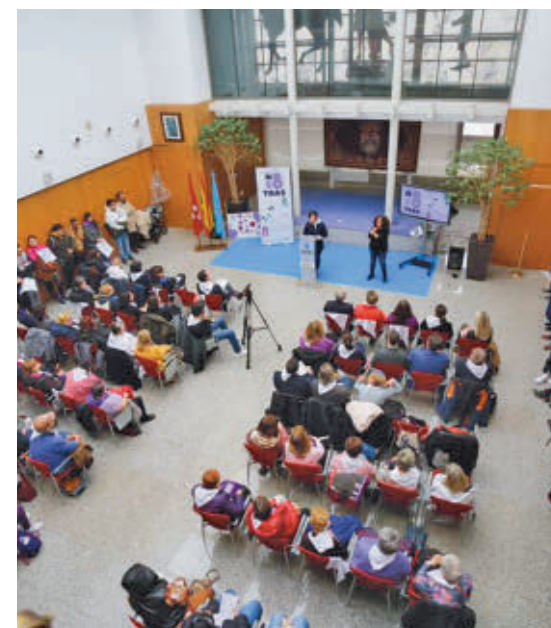
Acto con motivo del 8 de Marzo