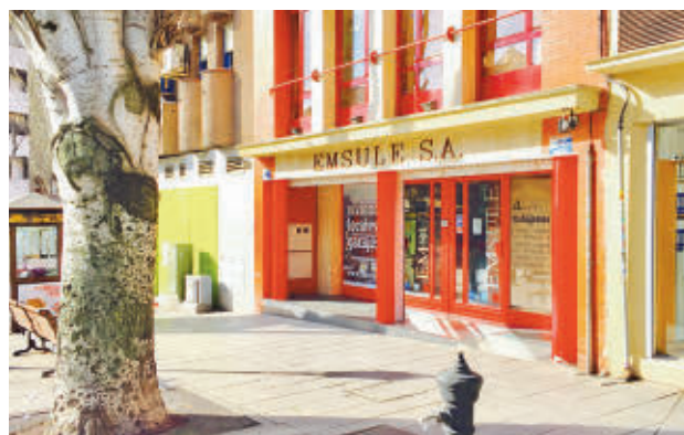
Sede de Emsule

Desde el PSOE se ha argumentado que "no es obligatoria" la asistencia a estas comparecencias de las comisiones de investigación.