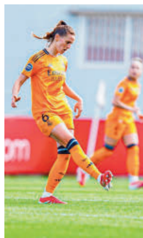
El Real Madrid es segundo

Bajando un poco más en la tabla, concretamente hasta la undécima posición, el Madrid CFF sigue dando pasos hacia la permanencia, un objetivo que podría acercarse más si ganara este domingo (16 horas) en casa al Granada.