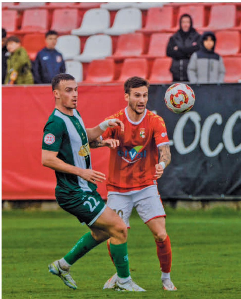
El Alcalá no dio opción al colista (4-1)

Con este impulso moral el líder jugará este domingo 16