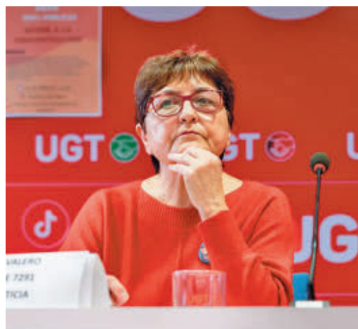
Presidenta de la asociación 7.291 Verdad y Justicia

EL PERIÓDICO GENTE NO SE RESPONSABILIZA NI SE IDENTIFICA CON LAS OPINIONES QUE SUS LECTORES Y COLABORADORES EXPONGAN EN SUS CARTAS Y ARTÍCULOS