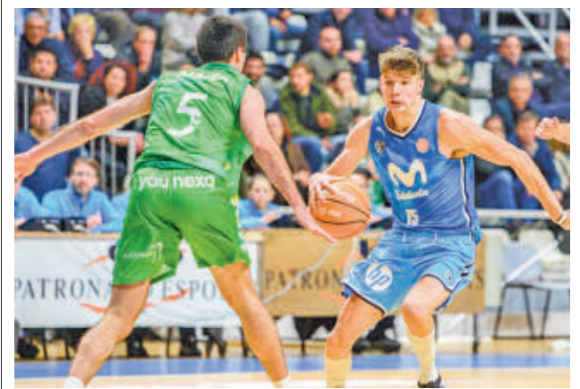
Sufrido triunfo del 'Estu' en Castellón

Para completar la alegría en la entidad leganense, el equipo femenino sigue peleando por acceder al 'play-off'. Las jugadoras que entrena Idefonso García son actualmente terceras en el Grupo C de la Superliga 2.