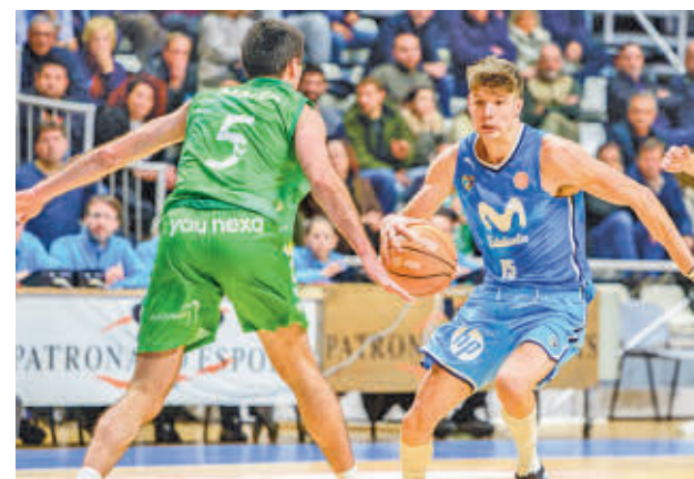
Sufrido triunfo del 'Estu' en Castellón

Para completar la alegría en la entidad leganense, el equipo femenino sigue peleando por acceder al 'play-off'. Las jugadoras que entrena Idefonso García son actualmente terceras en el Grupo C de la Superliga 2.