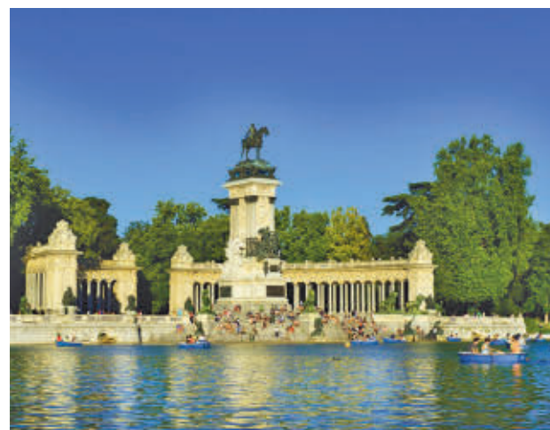
El estanque del parque del Retiro

Por otro lado, la ONG critica “la mercantilización de los