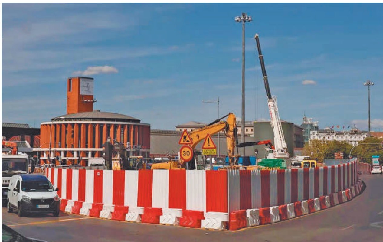
El espacio que ocupaba el antiguo monumento, tras su desmontaje