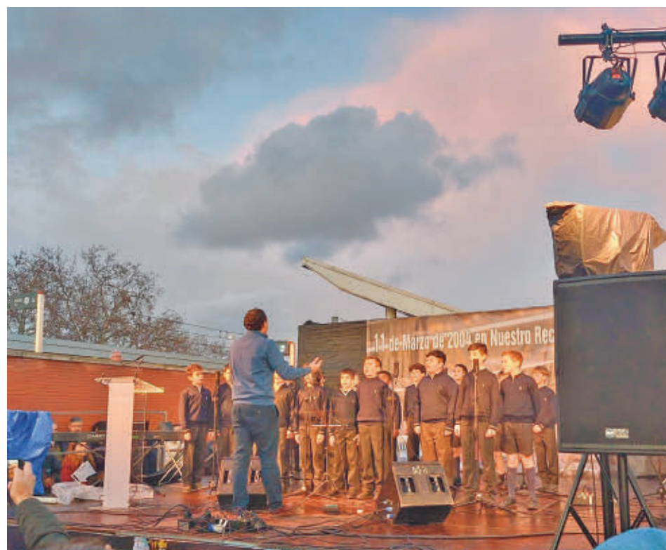
Varios coros escolares interpretaron canciones en recuerdo de los fallecidos