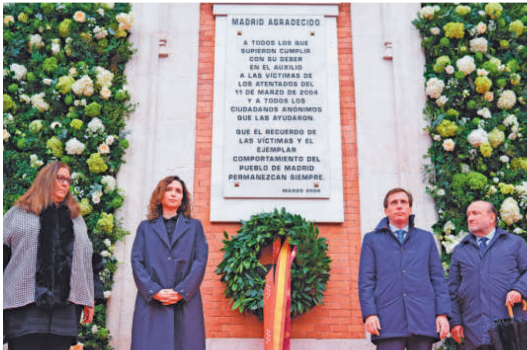
Ofrenda floral en la Puerta del Sol

A las 9 horas dio comienzo la ceremonia con el tañido de las campanas del reloj de la sede de la Presidencia regional en la Puerta del Sol durante dos minutos. También se sumaron a esta señal