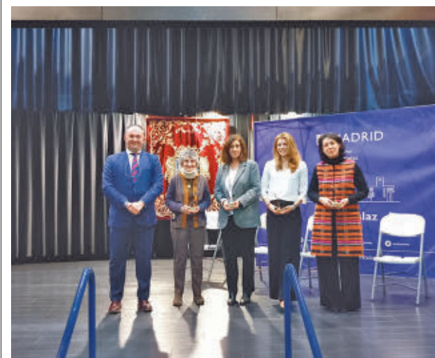
Foto de familia de las homenajeadas junto al edil de distrito