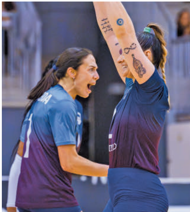
El Madrid Chamberí ha hecho un llamamiento a la afición