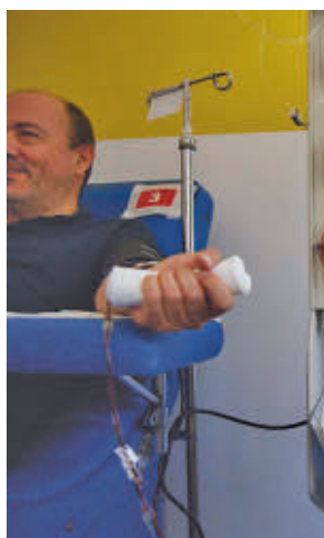
Un donante de sangre

redes sociales, para invitar a participar en la campaña de donación que se llevará a cabo hasta el próximo domingo 16 de marzo con el objetivo de aumentar las reservas. Los interesados podrán acudir de 8:30 a 21 horas al