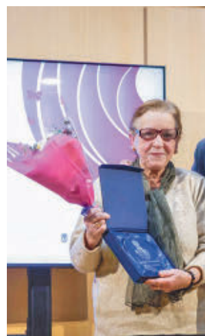
El acto de entrega

tribución a mejorar el distrito, con motivo del Día Internacional de la Mujer. En esta ocasión, fueron nueve las mujeres distinguidas ya que dos de ellas eran de la misma familia y compartieron el galardón. El delegado de Políti-