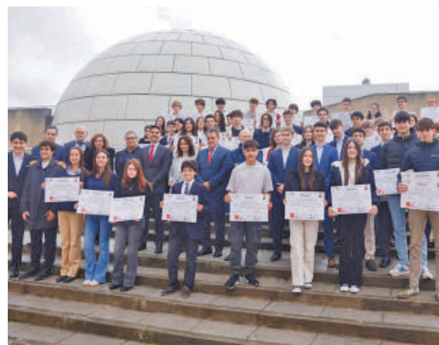
Jóvenes participantes en el proyecto

concurso. Esta competición, organizada por la Spanish Space Initiative (SPSIN) con ayuda de voluntarios y el apoyo del Clúster regional de Tecnologías del Espacio, ha acogido en su edición nacional a más de 200 estudiantes de