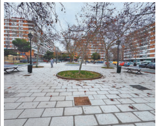
La plaza del barrio de Peñagrande, tras su remodelación