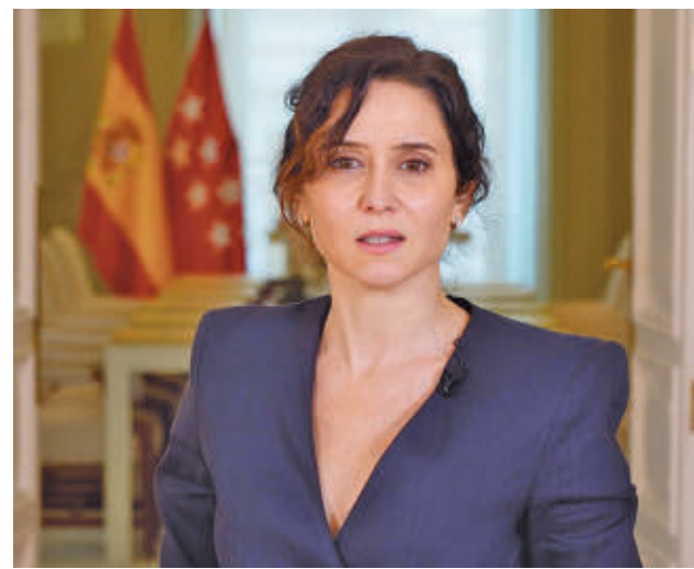
Isabel Díaz Ayuso, durante su mensaje