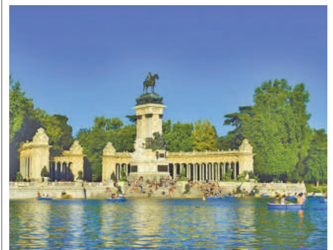
El estanque del parque del Retiro

Fuentes municipales explican que los dibujos deberán representar una idea, figura, personaje o emoción relacionada con la Navidad. Se primará será la originalidad.