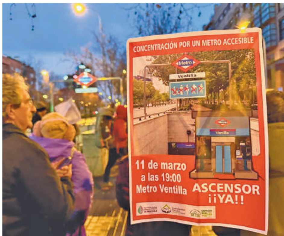
Los manifestantes, junto al acceso a la estación de Metro de la Línea 9

ñj GenteMadrid.es Consulte la actualidad regional y local en nuestra página web