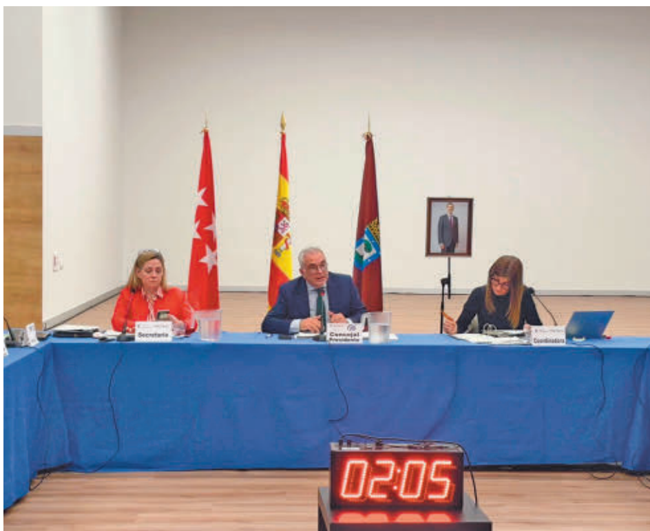
El Pleno de Carabanchel del pasado 6 de marzo