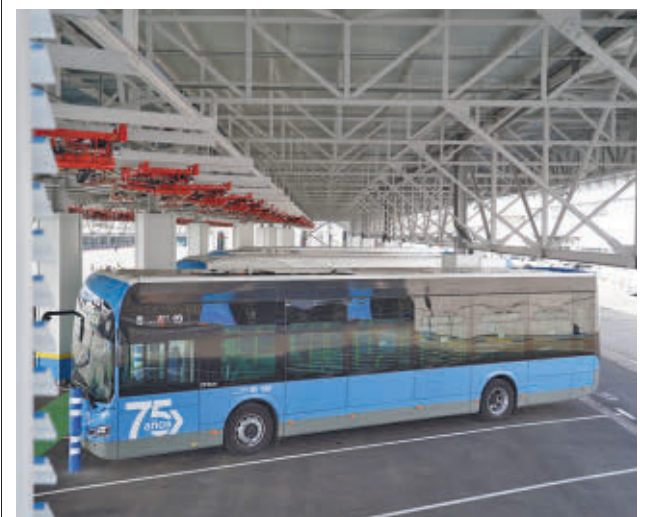
El Centro de Operaciones de la EMT en Carabanchel

La propuesta que no salió adelante en esta sesión fue la presentada por la Asociación Vecinal Carabanchel Alto de instar a poner el nombre de la escritora Elvira Lindo, creadora del personaje Manolito Gafotas, a la nueva biblioteca en el PAU, al contar con los votos en contra del PP. Este colectivo defendió la idoneidad de la denominación por la relevancia de la autora y porque el nuevo espacio cultural se está construyendo entre las avenidas de la Peseta y de Carabanchel Alto, cerca del parque Manolito Gafotas.