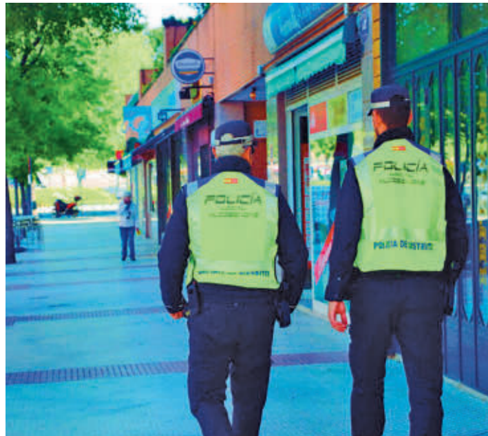
Agentes patrullando por una zona comercial

Estos trabajos se realizan principalmente en los ejes comerciales de los distritos