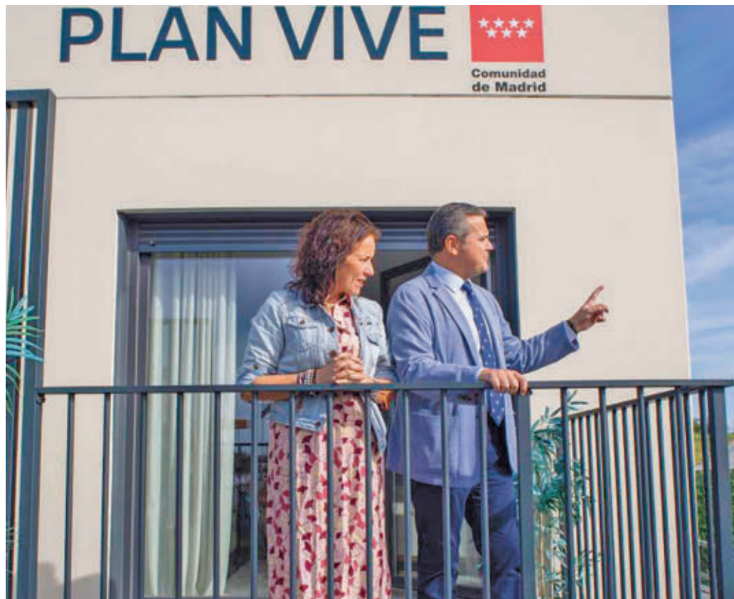
Foto de archivo de la alcaldesa y del consejero de Vivienda en la visita al piso piloto

Hay que recordar que hace prácticamente un año, el 9 de abril de 2024, se abrió el plazo de inscripción para los solicitantes interesados en una promoción de viviendas plurifamiliares, de 1 a 3 dormitorios, con protección pública de precio limitado, todas ellas con garaje y trastero. Casi 12 meses después, Sogeviso, la empresa gestora de dicha promoción ubicada en la avenida Arribes del Duero, ha publicado los datos sobre las adjudicaciones de estas viviendas. Según ese informe, sólo se han alquilado 202 de los 488 pisos que integraban esta fase del Plan Vive, es de-