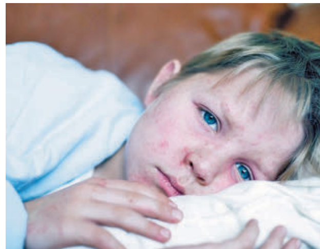
El sarampión sigue al alza en España E.P.

El pasado viernes 14 el Centro Europeo para la Prevención y el Control de Enfermedades (ECDC) informaba de la cifra “más alta” de casos de sarampión en Europa en 25 años y la atribuía a la disminución de la vacunación, y es que casi el 90% de las personas diagnosticadas con sa-