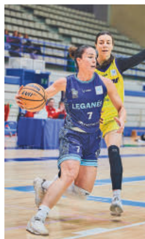
El Leganés sigue como líder

Por su parte, el Sernova Renovables Real Canoe viajará a la cancha del penúltimo clasificado, el Lima-Horta Barcelona, con la certeza de que una victoria aumentaría su colchón respecto a un rival directo.