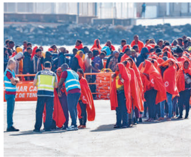
Migrantes llegando a las costas canarias