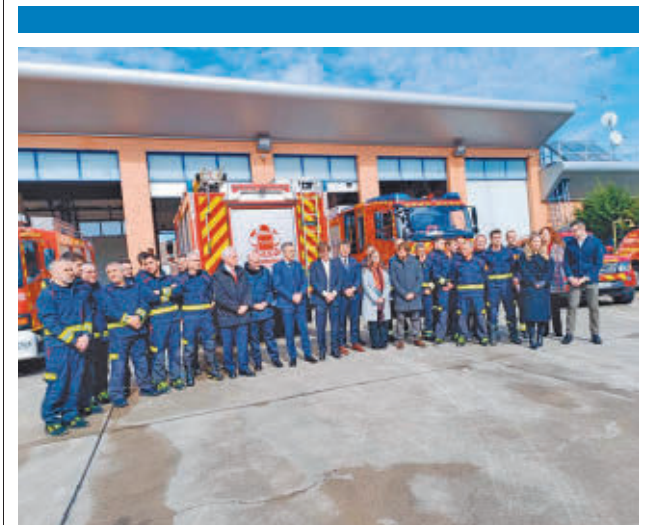
El consejero y el alcalde visitaron el Parque

Mientras, el sábado 22 tendrá lugar la representación de teatro musical ‘La fábrica de la diversión’. Asimismo, bajo el título de ‘Une culturas, pinta un mundo de color’, hasta el 4 de abril se exponen obras hechas por alumnos de la ciudad en el Espacio Municipal Los Arcos, mostrando cómo perciben la diversidad de su entorno.