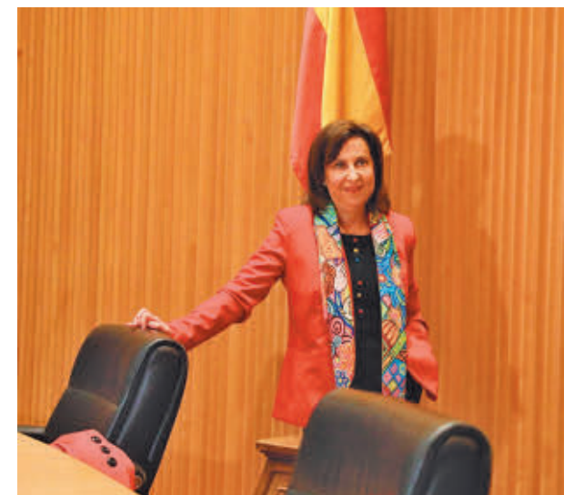
La ministra de Defensa, Margarita Robles