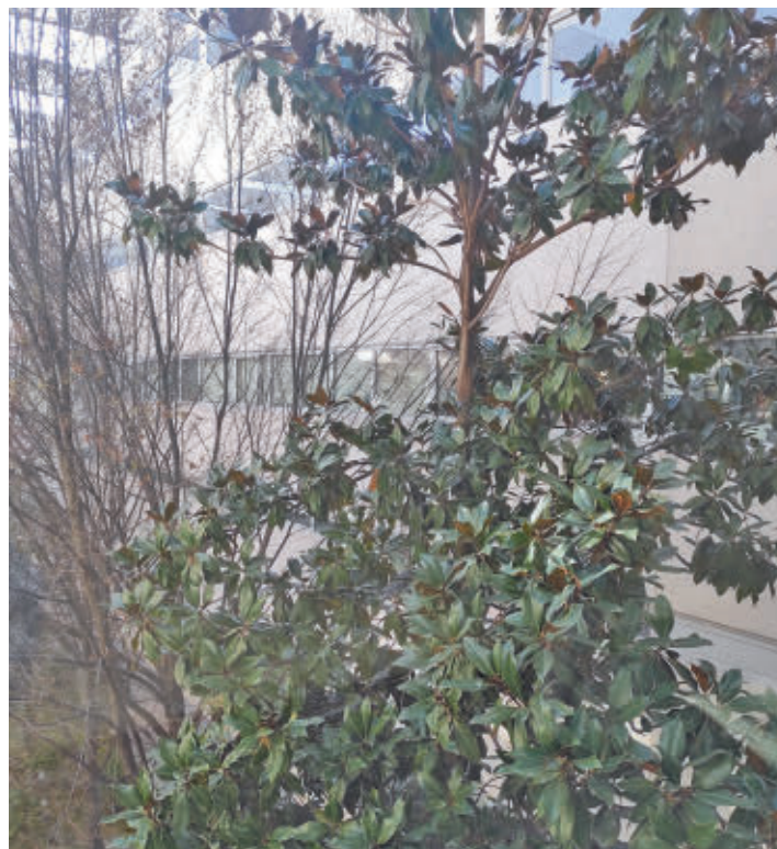
Algunas de las plantas que rodean al hospital