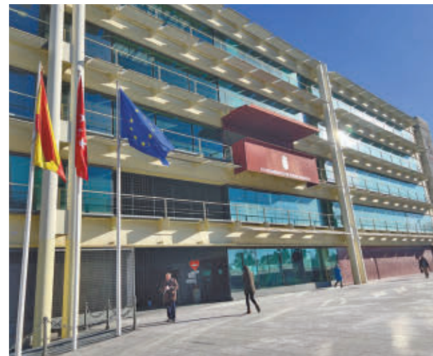
CNIS reconoce por el uso de la inteligencia artificial

Otro de ellos es 'Uitel energía inteligente para todos', en el que la IA permite la identificación de hogares con pobreza energética oculta. Con datos municipales, supramunicipales y de los propios interesados, se identifican los hogares objeto de intervención, permitiendo la personalización y predicción de ayudas en función de los resultados aportados por la IA. Se desarrolla en colaboración con el área de IA de la Universidad Carlos III.