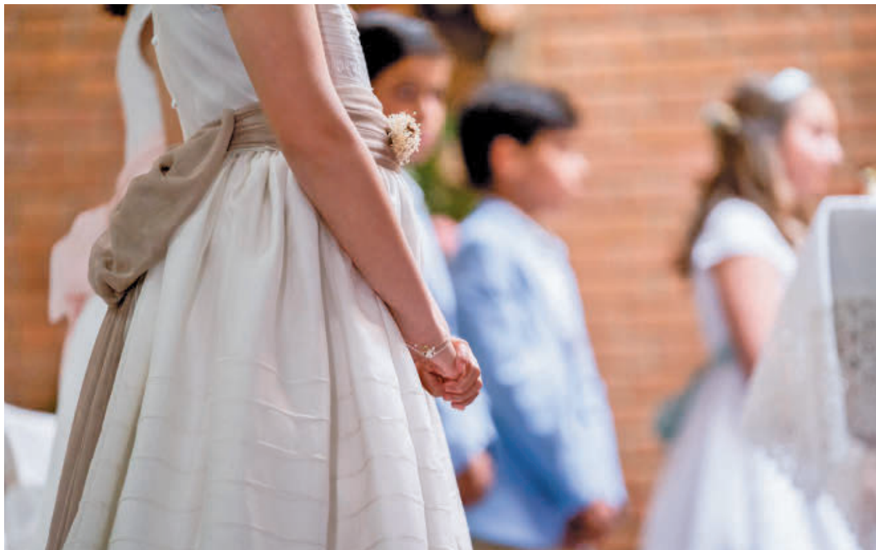
Celebrar una comunión es cada vez más caro en España E.P.

Con todos los complementos y accesorios comunes, la opción más barata de vestir a una niña sería de 301 euros, pudiendo alcanzar los 2.928 euros, en las opciones más