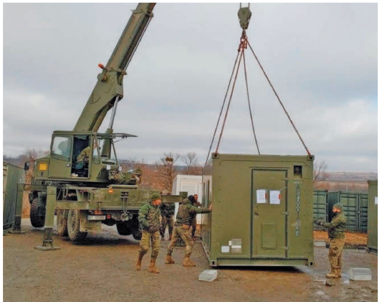
Soldados españoles preparan una maniobra

El CIS también ha preguntado en esa ocasión por los dos conflictos mundiales que más foco están teniendo en los últimos años. La guerra entre Rusia y Ucrania preocupa mucho o bastante al 65,9% de los españoles, frente al 18,9% que está poco o nada preocupado con este conflicto. Una preocupación muy similar a la que tienen los encuestados con la guerra entre Israel y Palestina, que según el barómetro de marzo preocupa mucho o bastante al 60,4% de los españoles, frente a un 20,1% que les preocupa poco o nada.