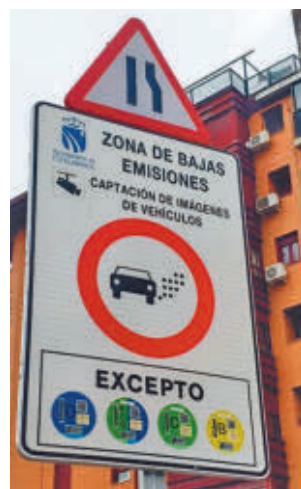
ZBE de Fuenlabrada

Para la formación, esta medida "restringe de manera injustificada la movilidad de los vecinos" y supone "una