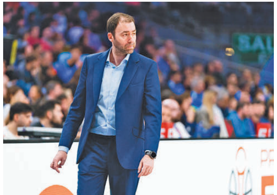
Pedro Rivero fue destituido después de una temporada y media