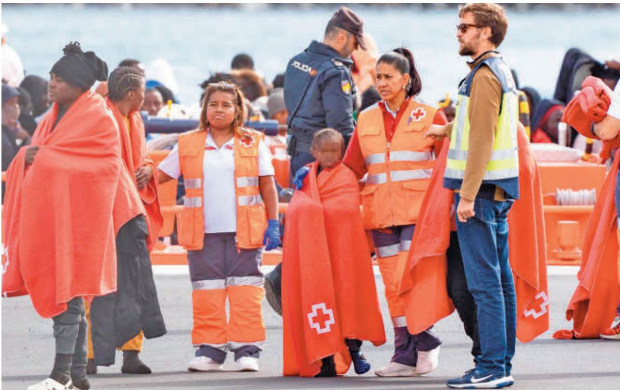
Los servicios de emergencias atienden a una embarcación llegada a las costas canarias