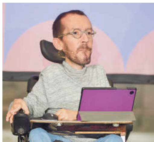
Pablo Echenique irá a juicio

EL PERIÓDICO GENTE NO SE RESPONSABILIZA NI SE IDENTIFICA CON LAS OPINIONES QUE SUS LECTORES Y COLABORADORES EXPONGAN EN SUS CARTAS Y ARTÍCULOS