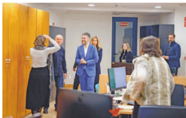
El consejero visitó las instalaciones