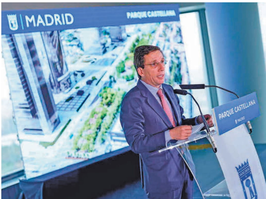
El alcalde de Madrid, José Luis Martínez-Almeida, pormenorizó los detalles del proyecto