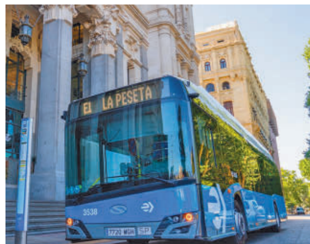
Uno de los autobuses de la Línea E1

Hasta ahora, Google Maps contaba con la información de líneas de forma estática, que se alimentaba diaria-