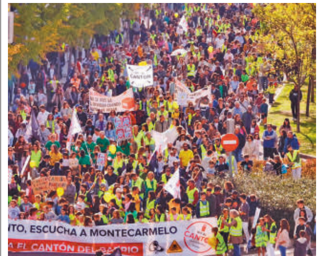
Una de las protestas contra el cantón AV MONTECARMELO