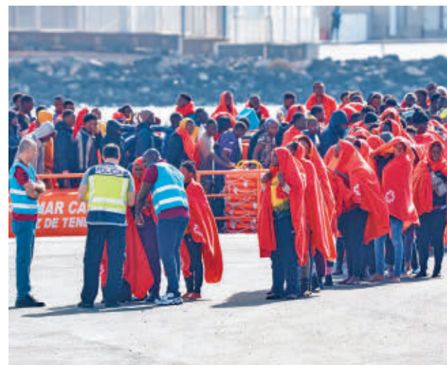
Migrantes llegando a las costas canarias E.P.