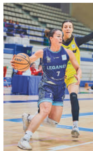
El Leganés sigue como líder

Por su parte, el Sernova Renovables Real Canoe viajará a la cancha del penúltimo clasificado, el Lima-Horta Barcelona, con la certeza de que una victoria aumentaría su colchón respecto a un rival directo.