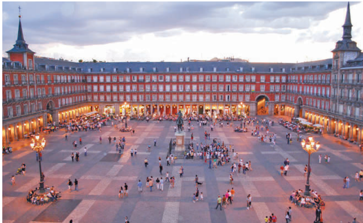
Una imagen aérea de la Plaza Mayor al atardecer