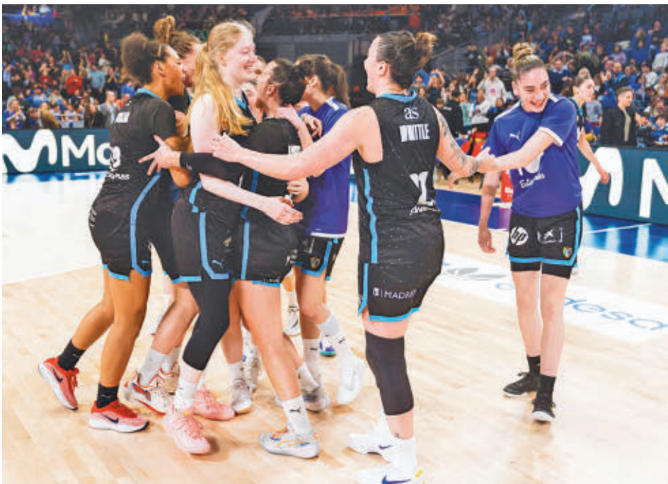
El equipo femenino llega en un buen momento a la Copa de la Reina de Zaragoza