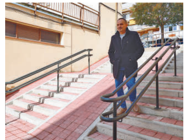
Los vecinos ya disfrutan de las nuevas escaleras en Móstoles

Además de mejorar la seguridad, esta reforma tiene como objetivo dinamizar el comercio local, al facilitar un acceso más cómodo y seguro a la galería para los mostoleños, favoreciendo las compras en los comercios tradicionales de la zona.