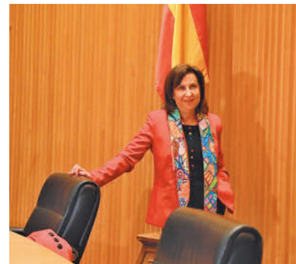
La ministra de Defensa, Margarita Robles