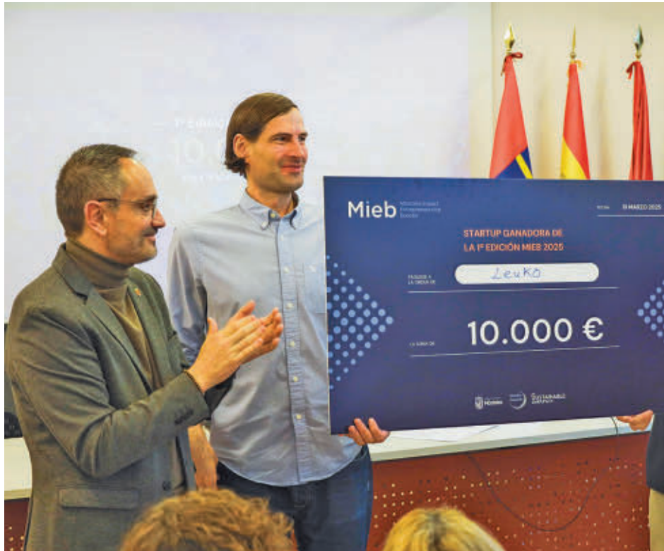
El alcalde entrega el premio a la startup ganadora en el 'Demo Day' del MIEB

"Iniciativas como el MIEB nos permiten impactar positivamente en la economía local, a la vez que generamos sinergias entre el tejido empresarial, lo que se traduce en más empleos y nuevas oportunidades de desarrollo en sectores estratégicos", señaló el alcalde durante su inter-