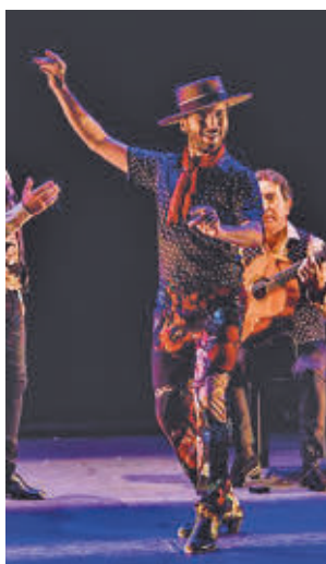
'Rayuela', un viaje artístico