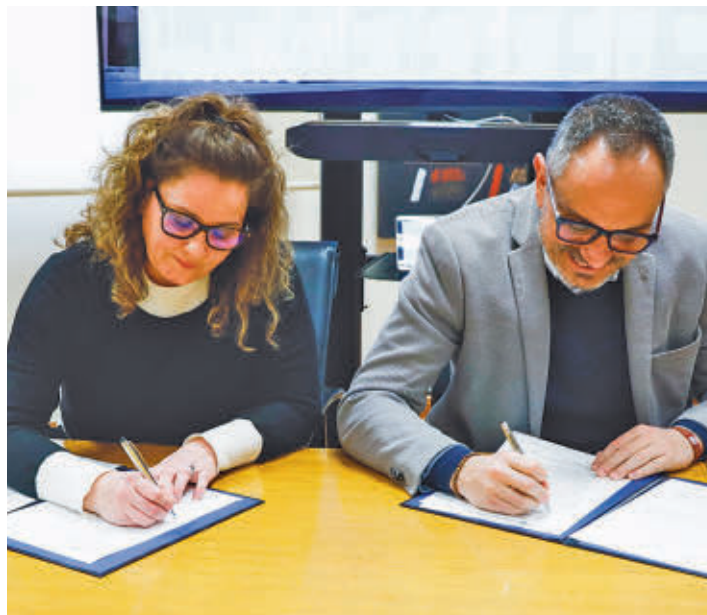
Colaboración entre el Consistorio y 4 Gatos por la higiene del municipio

El Ayuntamiento apuesta por el control de las colonias felinas mediante un convenio ● La gestión incluirá el control sanitario, censo y esterilización ● El acuerdo prioriza el bienestar animal