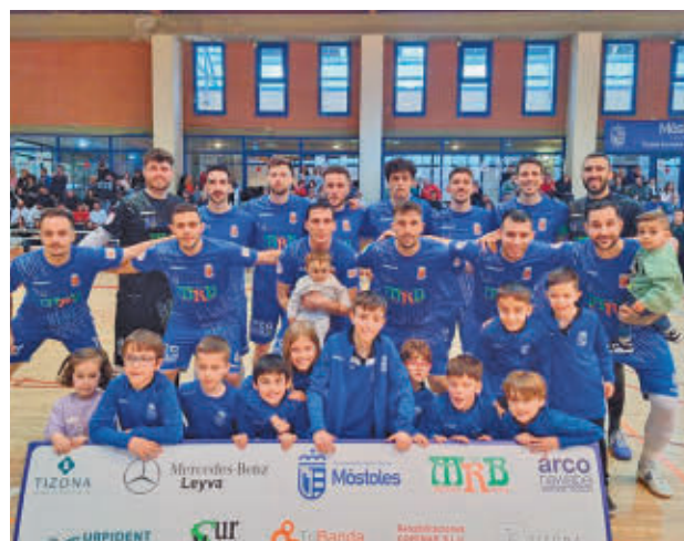
Con este triunfo, el Móstoles refuerza su posición como líder