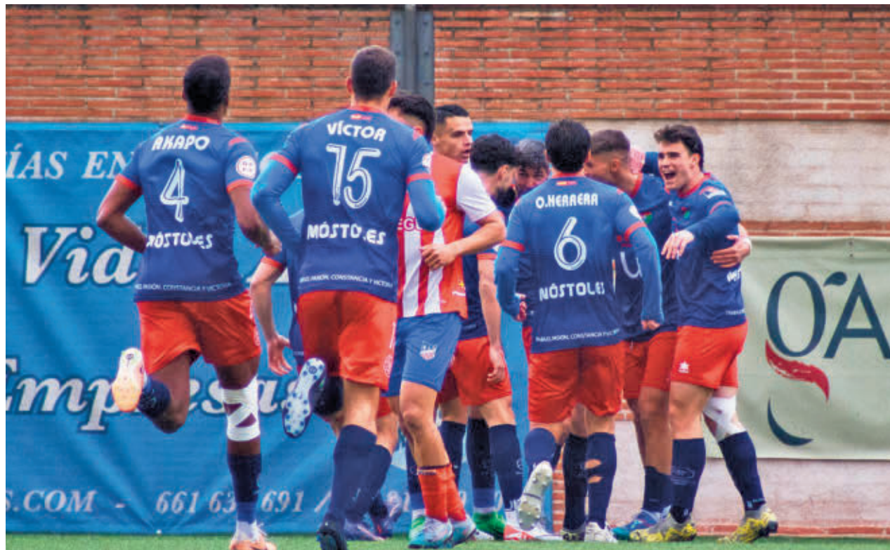
El próximo domingo, el Móstoles recibirá al Getafe B en un duelo clave por la permanencia en Segunda Federación