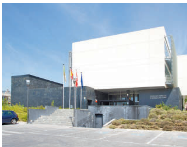
El Centro de Empresas de Boadilla del Monte

nos que el año anterior, cifra que mejoró en enero de 2025, bajando al 3,3 %. El Ayuntamiento trabaja en la mejora de las competencias profesionales de los desempleados, con orientaciones laborales de forma individualizada (222 en 2024) y jornadas y talleres sobre habilidades y competencias de cara a la búsqueda de empleo, a los que asistieron 660 personas.