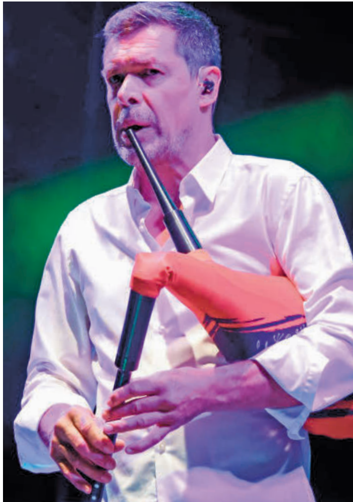
El gaitero asturiano José Ángel Hevia

Además, la Compañía Jarcanda, en el marco de la 19 Bienal de Teatro ONCE, presentará 'Tormenta de Otoño' el próximo 22 de mayo.