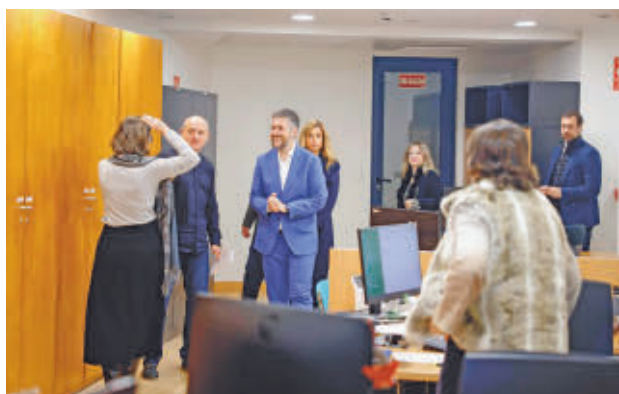
El consejero visitó las instalaciones