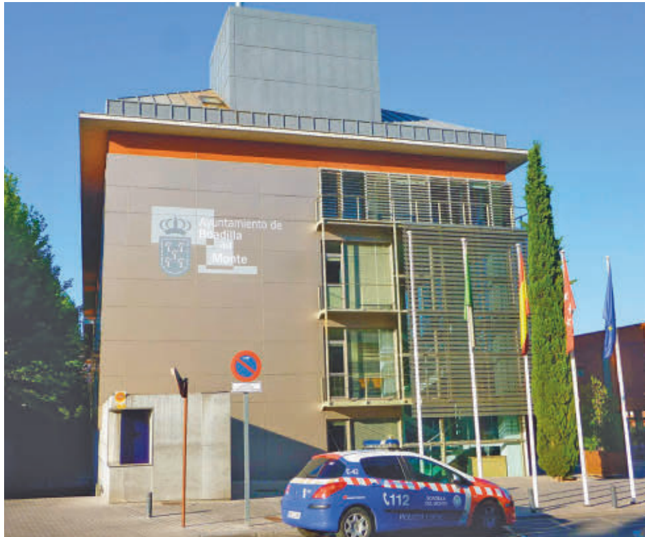
Ayuntamiento de Boadilla del Monte

Solicitando una autorización también podrán entrar los vehículos sin etiqueta que tengan una plaza de aparcamiento dentro de la zona (en propiedad o alquiler), los de los familiares de alumnos matriculados en el colegio Príncipe D. Felipe, los que vayan a talleres mecánicos (máximo