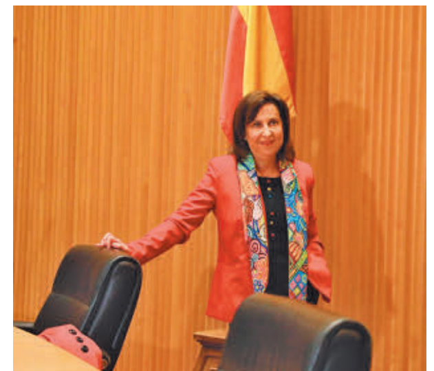
La ministra de Defensa, Margarita Robles