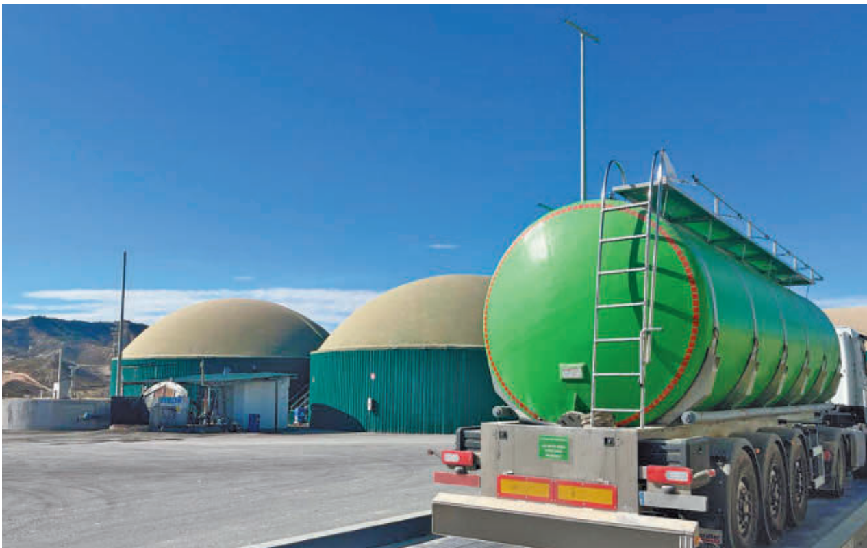
La futura planta de biogás de Colmenar Viejo genera preocupación entre los vecinos de la zona