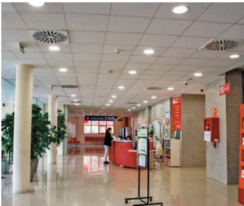
La iniciativa se desarrollará entre las 10 y las 15 horas