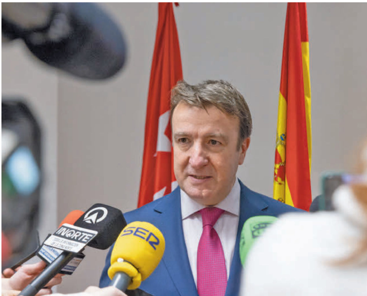
AYTO TRES CANTOS