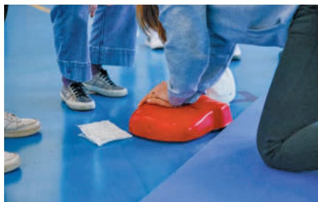
Uno de los talleres realizados el año pasado

Los talleres se impartirán a un total de 887 alumnos de los diferentes centros educa-