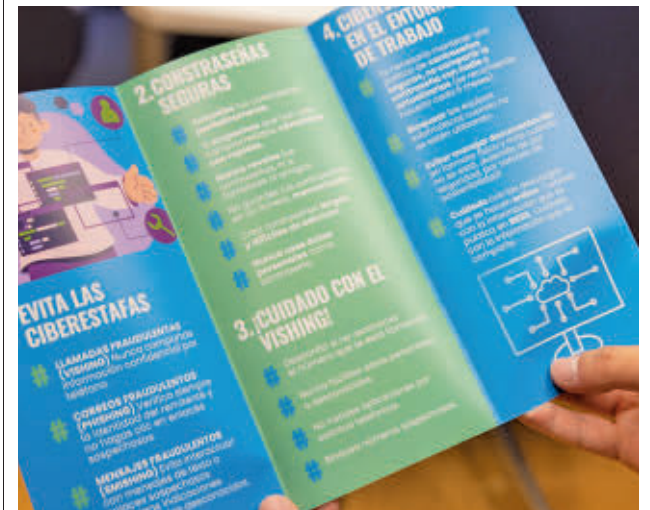
Presentación de la campaña AYTO DE TRES CANTOS