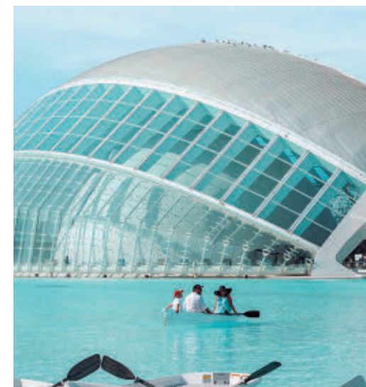
Valencia es la ciudad que más se encarece