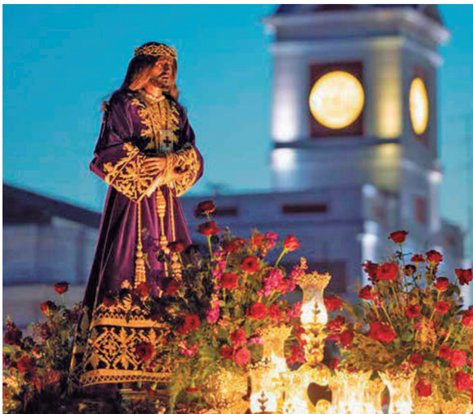
JESÚS NAZARENO DE MEDINACELI, EL VIERNES SANTO

Las clásicas saetas flamencas desde balcones tan emblemáticos como los de la Real Casa de Correos o la Plaza de la Villa acompañarán el paso de las diferentes imágenes. Al igual que en años anteriores, la tamborrada de la Plaza Mayor cerrará la programación religiosa.