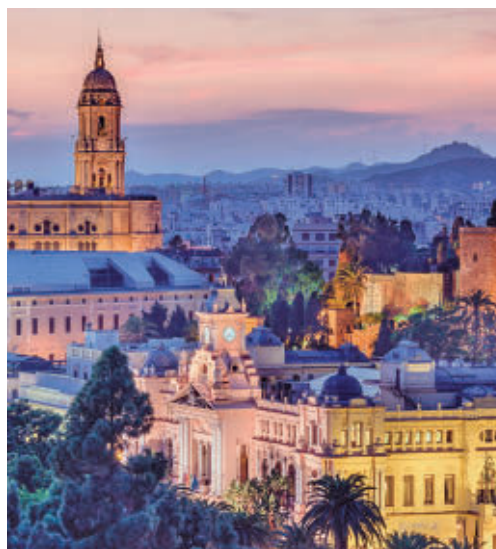
Málaga, otro de los destinos más reservados