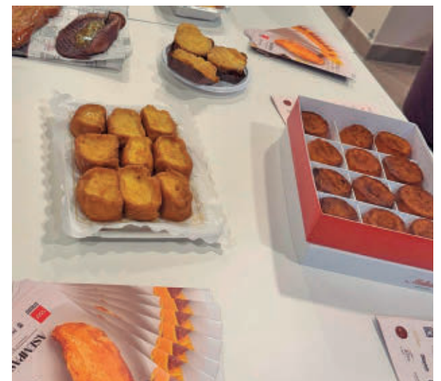
Degustación especial de torrijas organizada por Asempas

Para probar todas ellas, vuelve La Ruta de la Torrija, una cita ineludible de la Semana Santa madrileña. Hasta el 20 de abril los ciudadanos tendrán la oportunidad de probar cualquiera de las alternativas que vienen recogidas en el mapa ubicado en la página web Todoestaenmadrid.com , en el que se encuentran más de 70 locales de pastelería artesanal de toda la región.