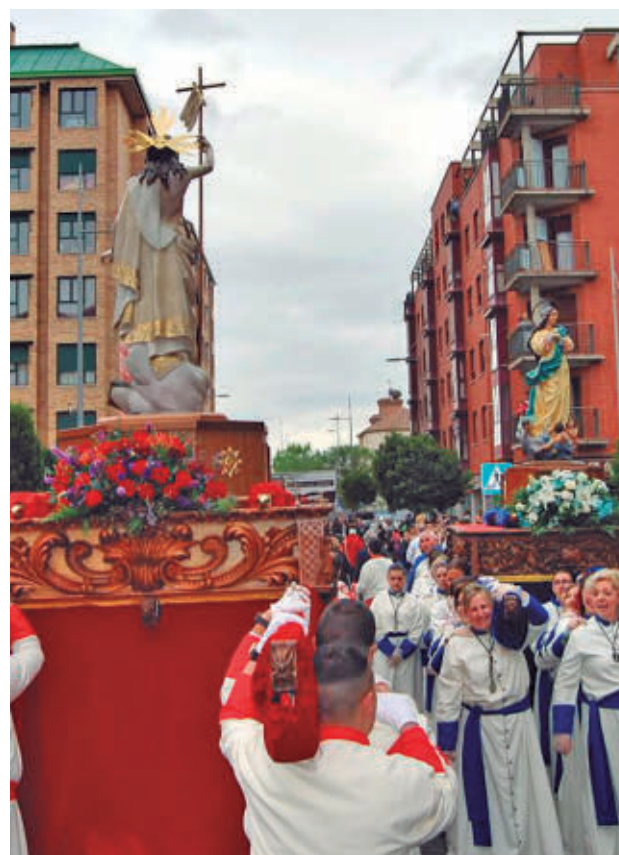
PARLA: Cinco cofradías protagonizan doce procesiones con imágenes de más de tres siglos de antigüedad. El broche de oro llega con El Encuentro del Domingo de Resurrección, que clausura las fiestas en las que las saetas y las bandas llenan Parla de devoción.

>> Miércoles Santo | A las 23 horas | Iglesia San Juan Evangelista