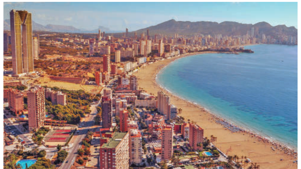
Benidorm ofrece una gran capacidad para todos los viajeros