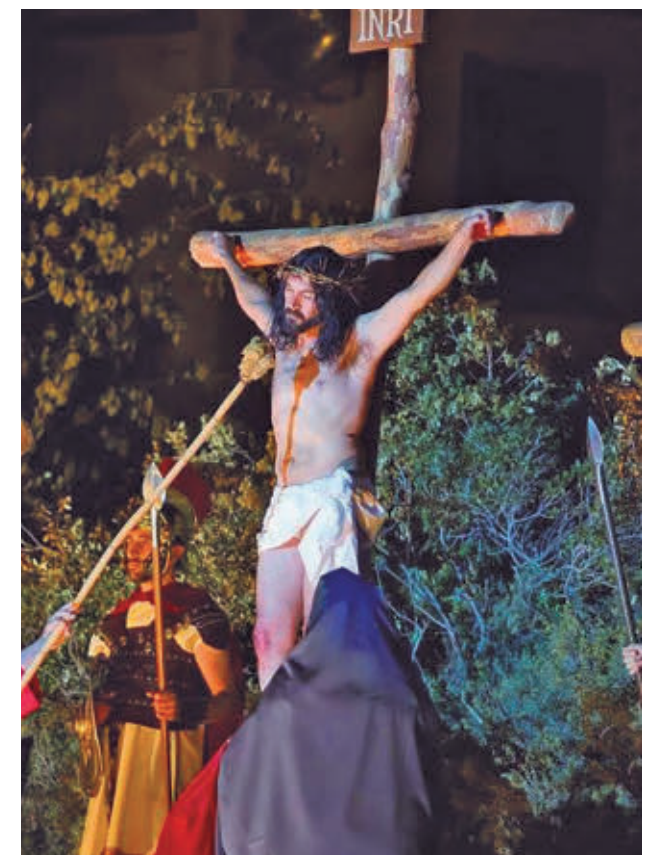
CHINCHÓN: Desde 1963, esta Pasión es la representación viviente más antigua de la región. Son 250 actores los que escenifican la muerte y resurrección de Cristo. Este evento, con más de 20.000 visitantes cada año, es Fiesta de Interés Turístico Nacional.

>> Domingo de Resurrección | 10:30 horas | Nuestra Señora de la Asunción