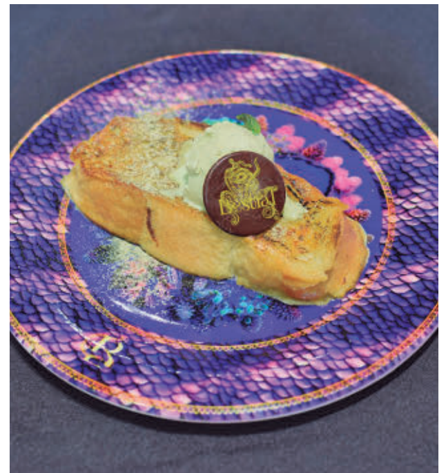
'Bestia', segundo puesto en la categoría Innovación ACYRE