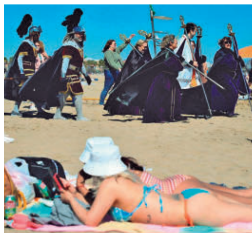
Turismo de sol y religioso se dan la mano

EL PERIÓDICO GENTE NO SE RESPONSABILIZA NI SE IDENTIFICA CON LAS OPINIONES QUE SUS LECTORES Y COLABORADORES EXPONGAN EN SUS CARTAS Y ARTÍCULOS