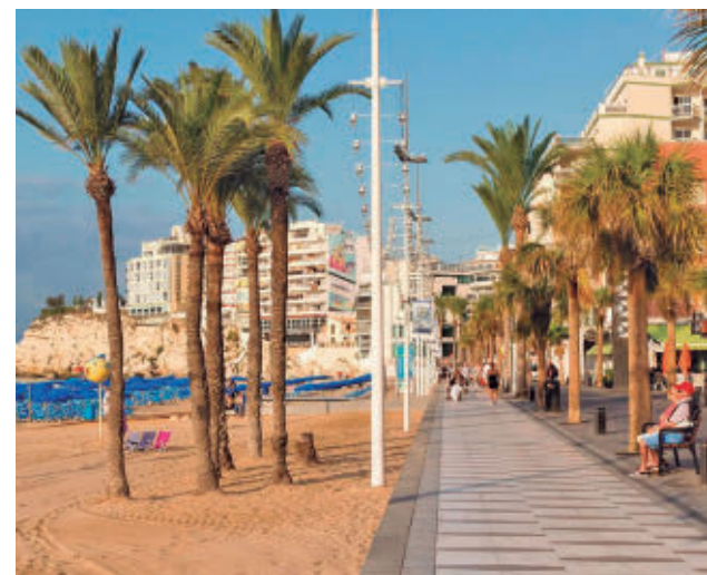
Playa de Benidorm