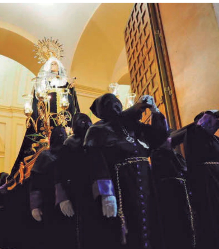
TORREJÓN DE ARDOZ: La Semana Santa torrejonera, Fiesta de Interés Turístico Regional, destaca por sus procesiones solemnes. La Procesión del Silencio, con imágenes atribuidas a la escuela de Gregorio Fernández, es uno de sus principales atractivos.

>> Miércoles Santo | A las 23 horas | Iglesia San Juan Evangelista