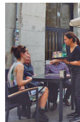
Terraza en Madrid

Andalucía será la comunidad autónoma que más empleo generará con 24.370 contratos, seguida de Cataluña (18.850), Madrid (16.570) y la Comunidad Valenciana (12.675). Estas cuatro regiones acumularán seis de cada diez contratos. Los perfiles más demandados serán los de camareros y cocineros.