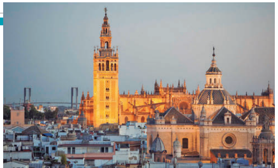
Sevilla es uno de los destinos más caros y solicitados por las procesiones

El informe explica que los españoles prevén aumentar el gasto durante la Pascua porque, en su opinión, los precios han subido (un 41% de ellos lo alega), a lo que se suma que el año pasado no hicieron nada especial y este año sí (25%) o porque la situación económica de su hogar ha