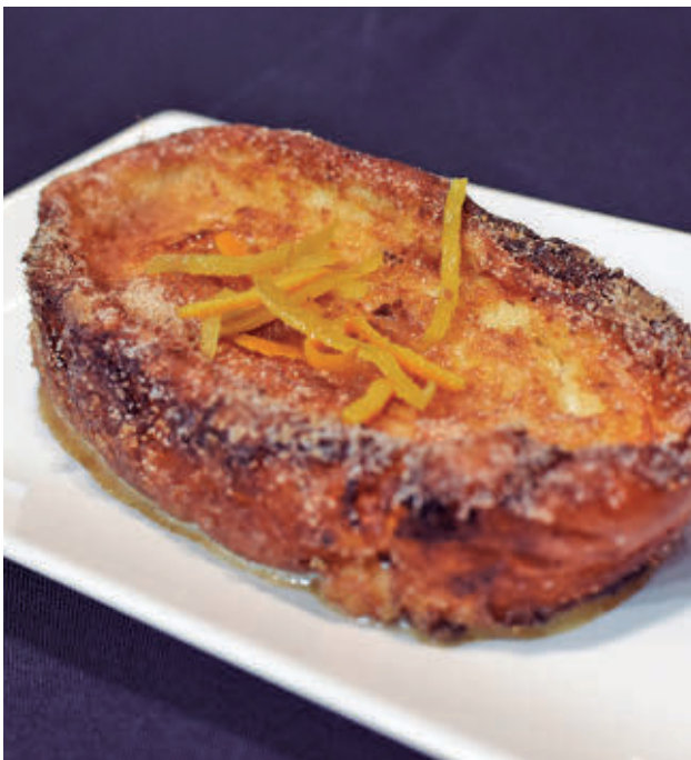
El segundo puesto en categoría tradicional es para Formentor