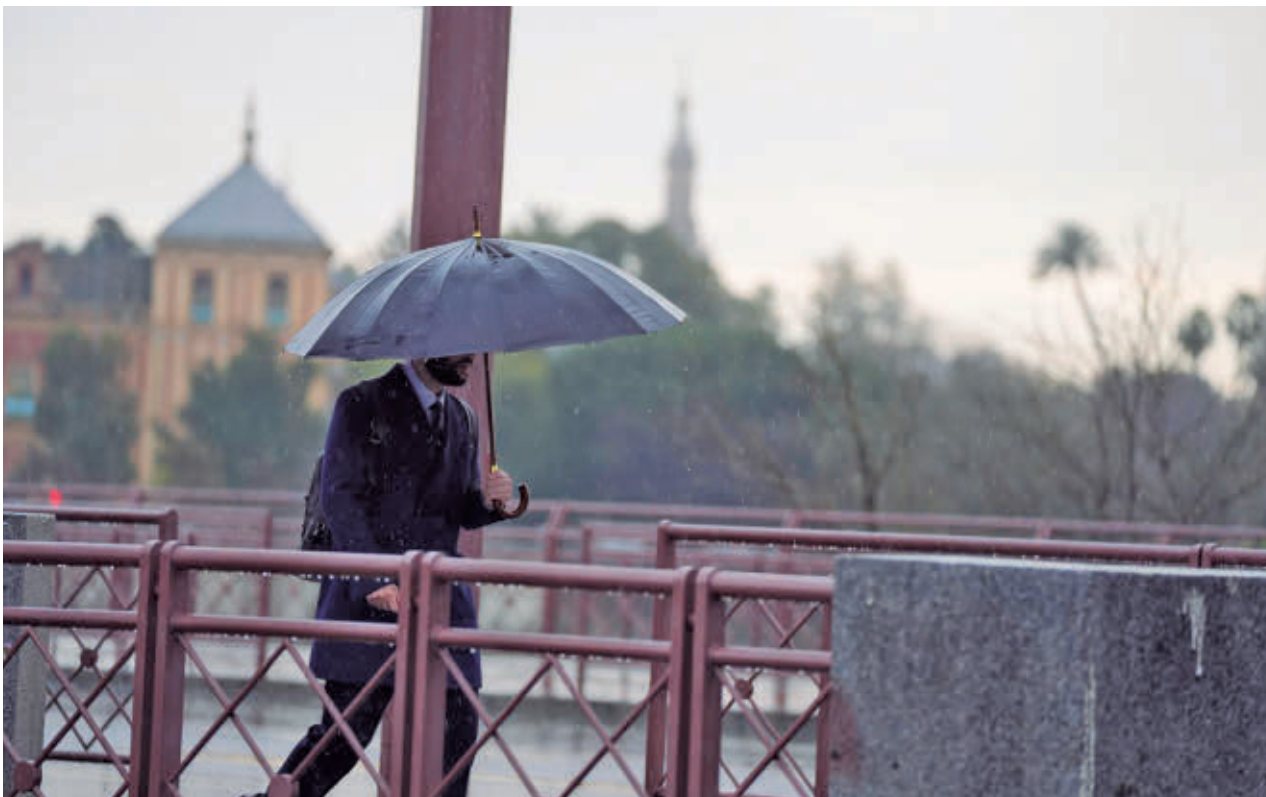
La lluvia vuelve a amenazar a las celebraciones de Semana Santa E. P.