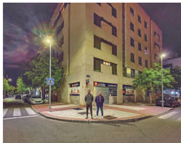
Algunas de las nuevas farolas

lle Chile y avenida Madrid), Lisboa (entre calle Veredilla y calle Londres), Río Guadiana (esquina calle Río Guadalquivir y en Ronda del Poniente). Del mismo modo, se han instalado balizas y puntos bajos en farolas en el acceso peatonal situado en la calle Lisboa. "Esta es una inversión más que se sumará a otras similares", señaló el alcalde, Alejandro Navarro.