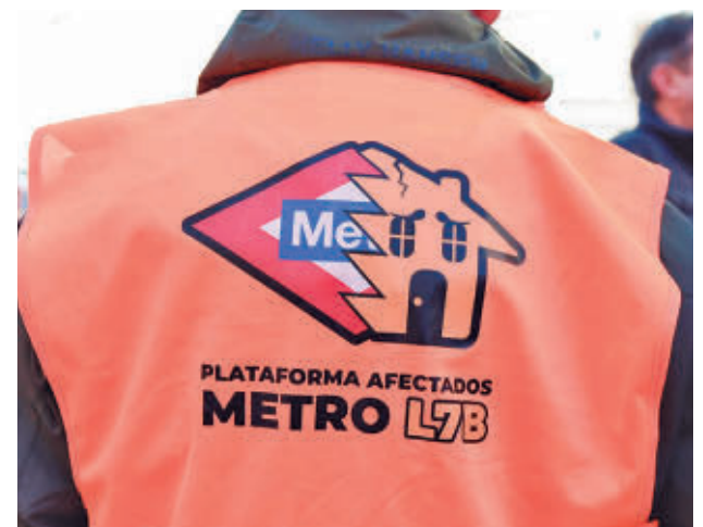
Protesta de los afectados por la Línea 7B

Reclaman "soluciones concretas y reales", con el agravamiento además por "la alarmante situación de la línea a su paso por Coslada", con el servicio cerrado entre las estaciones de Barrio del Puerto y San Fernando.