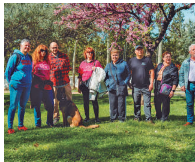
Presentación de la feria