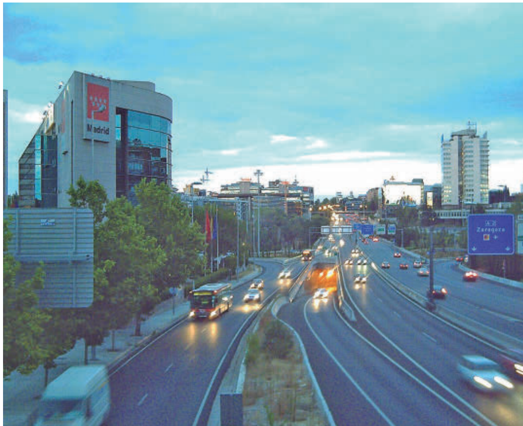
Autovía A-2 a su paso por la capital

Adicionalmente, para mejorar el funcionamiento de las líneas de autobuses metropolitanos, se aumenta en 150 metros la longitud de la vía de