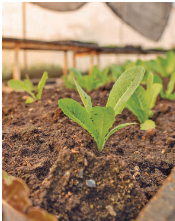
La iniciativa busca dar salida a los desperdicios de los huertos

El compostaje tratado en estos ámbitos no solo mejora el proceso de la materia orgánica, sino que siembra concienciación ambiental desde las aulas. Parte importante de esta iniciativa es la de poder reutilizar los desechos de los comedores y de los huertos, facilitando su tratamiento ‘in situ’ y evitando que algunos de ellos acaben en los vertederos. El alumnado participa activamente en todo el