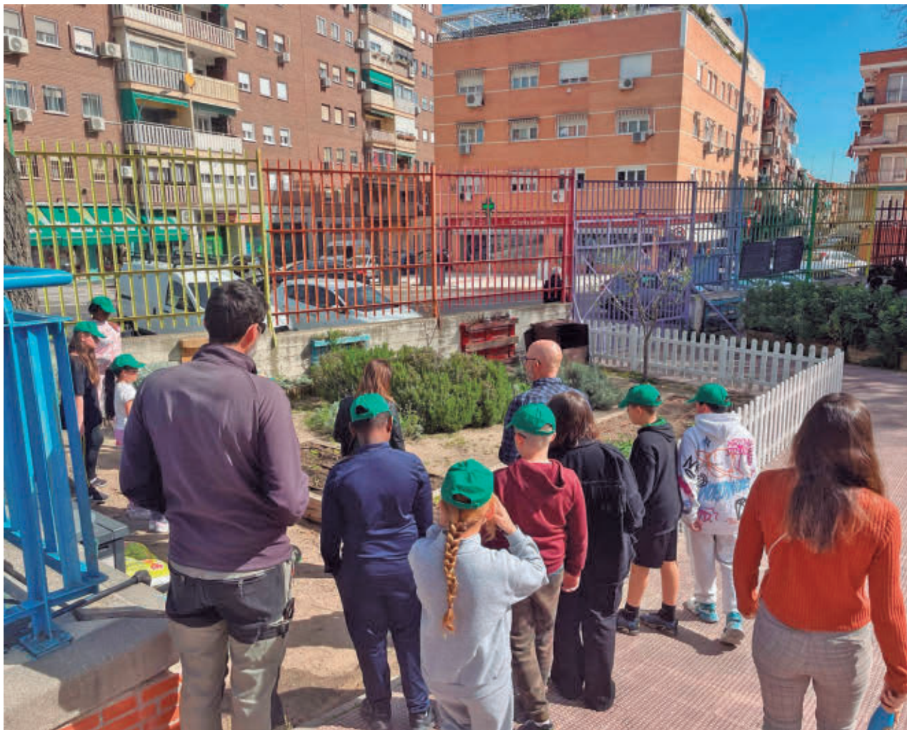
AYTO DE FUENLABRADA