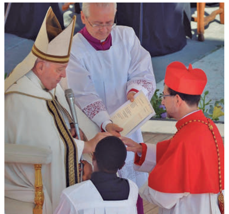
El Papa Francisco, con el arzobispo de Madrid, José Cobo

En total, son 11 los purpurados nacidos en España que forman parte de este colegio y que podrían, por tanto, suceder a Francisco. Además de los siete electores, los mayores de 80 años son: el cardenal y arzobispo emérito de