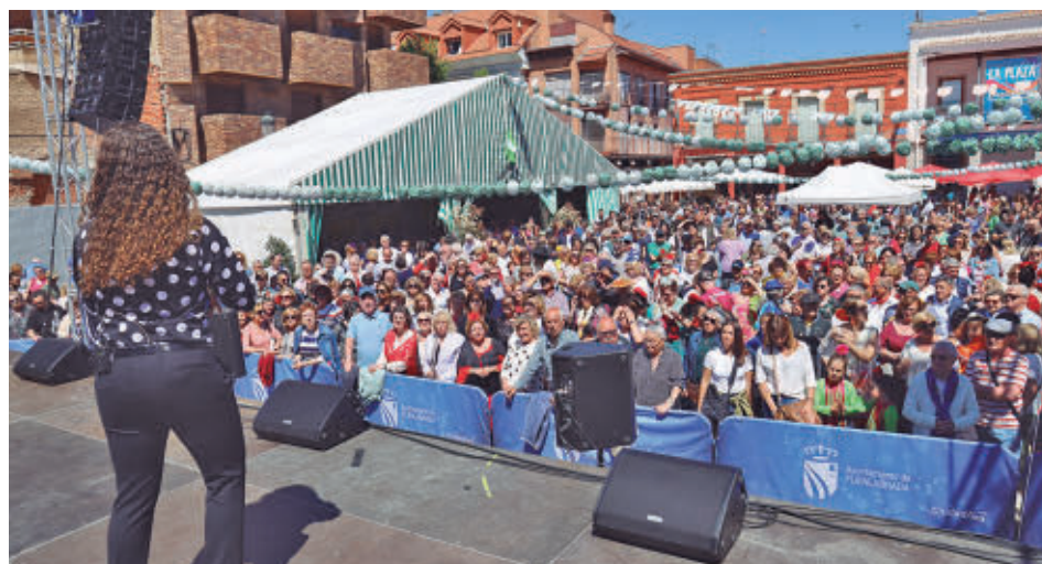
AYTO DE FUENLABRADA

Coros rocieros, sevillanas y trajes de faralae serán los protagonistas de la Feria de Abril de Fuenlabrada, que tendrá lugar en la Plaza de España del 25 al 27 de abril. La Casa Regional Andaluza es la encargada de organizar este evento, junto al Ayuntamiento de la localidad.