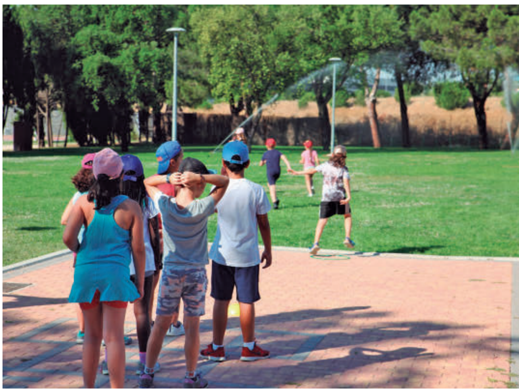
Las Fuenlicolonias ocupan con actividades lúdicas y educativas el tiempo estival de los menores