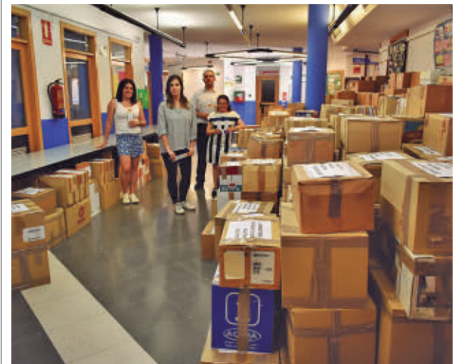
Cada año logran recoger centenares de ejemplares

Hasta el 30 de abril se recogerán obras de lectura narrativa de adultos e infantil, enciclopedias temáticas y generalistas, obras de investigación científica y humanística, revistas especializadas, libros de texto y audiovisuales en buen estado.