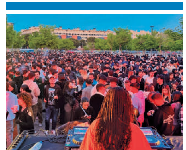
Quieren repetir el éxito del pasado año URJC

Más de un millón de usuarios de la zona Sur de Madrid ya disfrutan de la ampliación de la Línea 3 entre la estación de Villaverde Alto y la de El Casar en la localidad de Getafe, algo que posibilita tener otro enlace directo entre la capital y los municipios de esta parte de la región. Supone, además, una mejora de la conexión de la C-3 de Cercanías con la L-3, además de dotar a MetroSur (L12) de un segundo enlace con la capital, beneficiando directamente a los vecinos de Alcorcón, Fuenlabrada, Leganés y Móstoles. Con 129 millones de euros de inversión, las obras han requerido del trabajo de 2.000 operarios y han consistido en la perforación de un túnel de 2.600 metros combinando el modelo tradicional con la excavación secuencial, empleada por primera vez.