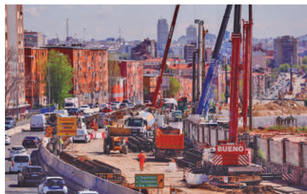
Las obras de soterramiento de la A-5

Así lo anunció el alcalde de Madrid, José Luis Martínez-Almeida, en la visita que realizó el pasado miércoles