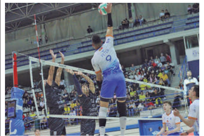
El Leganés ejerce como anfitrión RFEVB

Este sábado 26 (20 horas), el Ikasa Madrid defiende su cuarta posición en la cancha del líder de la categoría, el Plus Car Lanzarote.