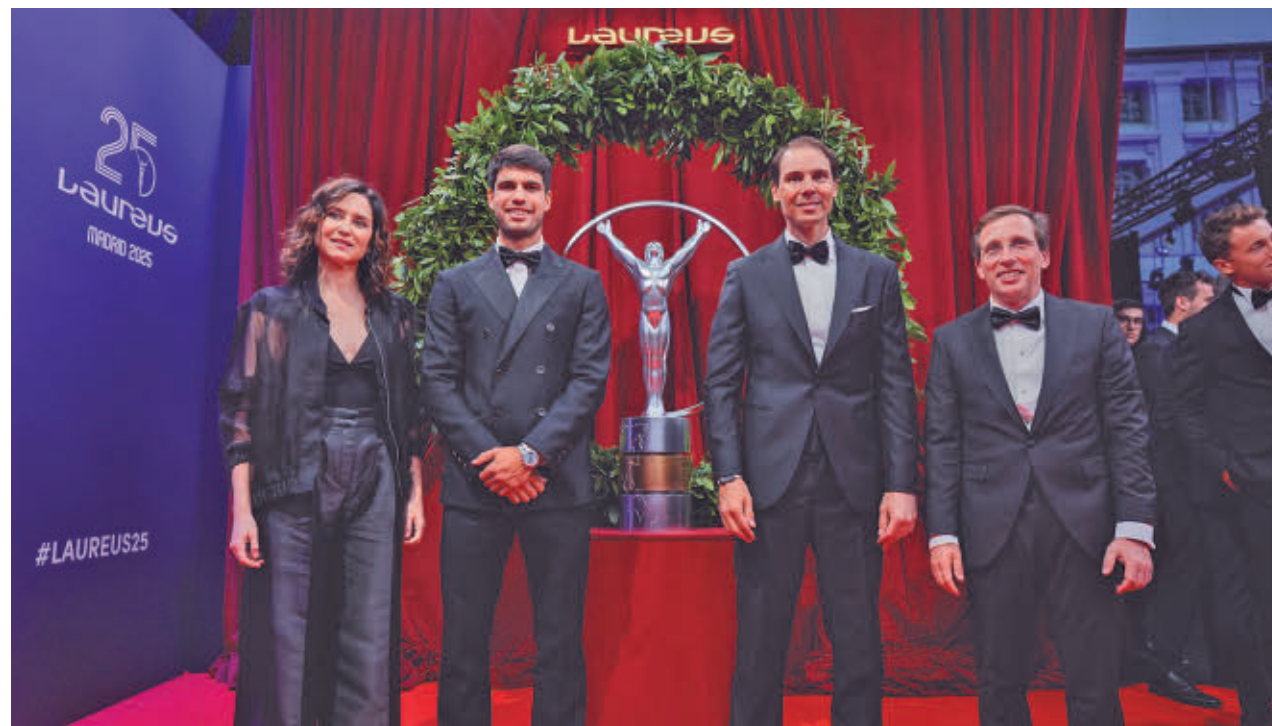
La presidenta regional, Isabel Díaz Ayuso, y el alcalde, José Luis Martínez-Almeida, junto a Rafael Nadal y Carlos Alcaraz

Consulte la actualidad regional y local en nuestra página web