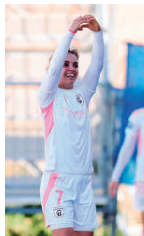
Andonova MADRID CFF

El otro equipo madrileño, el Atlético, viaja el domingo (12 horas) al campo del Levante con la necesidad de sumar otro triunfo para mantener la tercera posición.