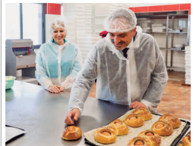
Los hornos mostoleños recuperan el sabor más tradicional

Los interesados pueden inscribirse mediante un formulario hasta la fecha del evento. Entre los puestos que se ofrecen figuran de logística, administración, atención telefónica y oficios técnicos.