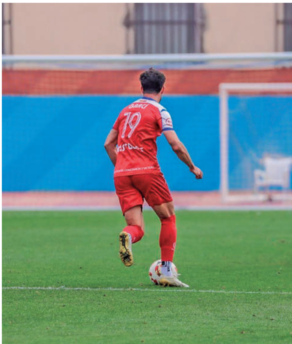
Garci, en el encuentro disputado en el campo del Melilla

La temporada ha estado marcada por las adversidades desde su inicio. El equipo consiguió el ascenso administrativo durante el verano, pero sus problemas competitivos provocaron la salida del