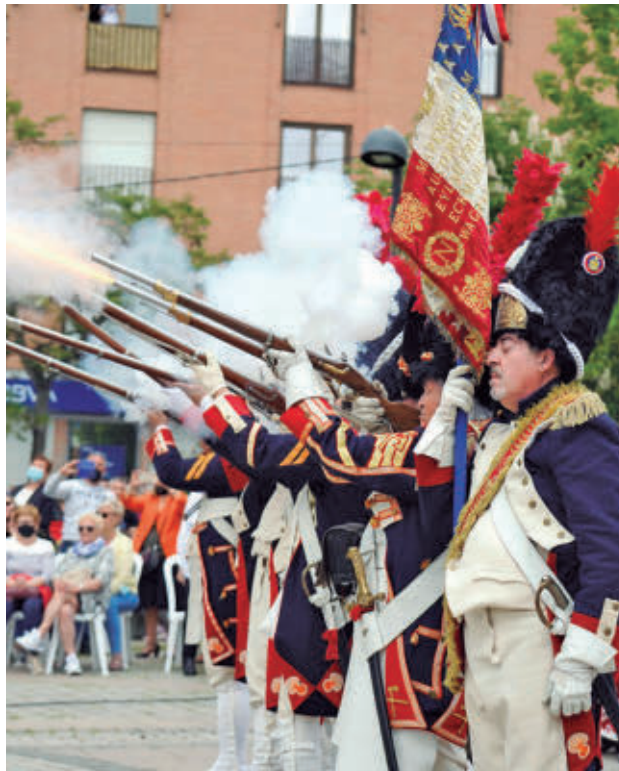
Las fiestas honran la memoria del pueblo que se alzó en 1808

El programa incluye la recreación histórica del alzamiento de 1808, que convierte las calles de Móstoles en un escenario vivo del pasado. Del 30 de abril al 30 de mayo, cinco