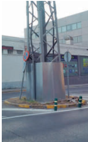
Vista actual de la estructura

El presupuesto previsto asciende a 110.021,59 euros. Tras la licitación y adjudicación de las obras, se prevé un plazo de ejecución de tres meses para los trabajos municipales, más un mes adicional para las actuaciones de la empresa eléctrica.