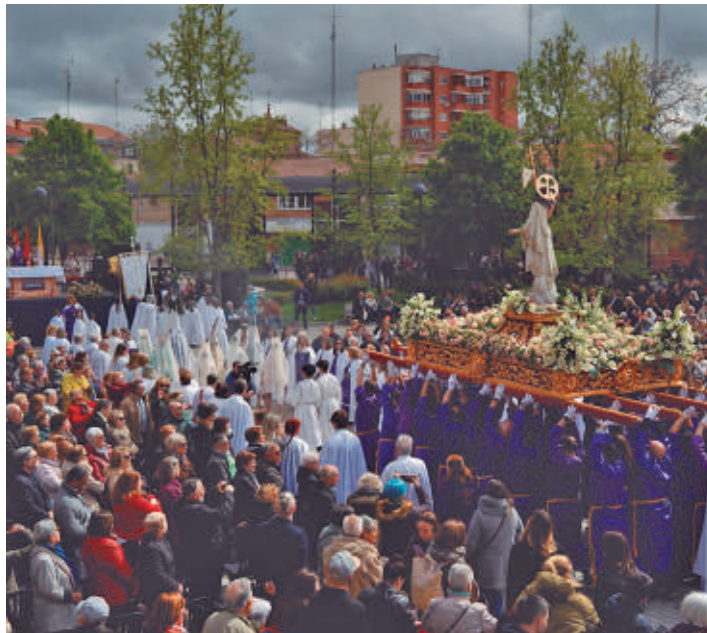
La Procesión del Encuentro volvió a reunir a miles de mostoleños

La Procesión del Encuentro, declarada Fiesta de Interés Turístico Regional desde 2010, congregó a miles de personas en la Plaza de Cua-