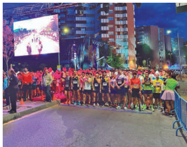
La Avenida Carlos V, punto neurálgico de la carrera

El evento, organizado por el Ayuntamiento en colaboración con la Asociación Atlética Móstoles, cuenta con una importante causa benéfica. Este año, los fondos recaudados se destinarán a la Asociación Contra el Cáncer Gástrico y Gastrectomizados. Los