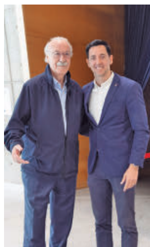
Presentación del torneo

patrocinio, vivirá una nueva edición los días 2, 3 y 4 de mayo. Organizado por CD Fútbol Tres Cantos, en colaboración con el Ayuntamiento de Tres Cantos y patrocinado por Skechers, congregará a 48 equipos de las catego-