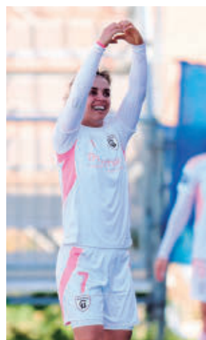
Andonova MADRID CFF

El otro equipo madrileño, el Atlético, viaja el domingo (12 horas) al campo del Levante con la necesidad de sumar otro triunfo para mantener la tercera posición.