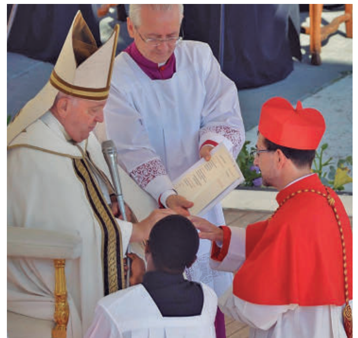
El Papa Francisco, con el arzobispo de Madrid, José Cobo

En total, son 11 los purpurados nacidos en España que forman parte de este colegio y que podrían, por tanto, suceder a Francisco. Además de los siete electores, los mayores de 80 años son: el cardenal y arzobispo emérito de