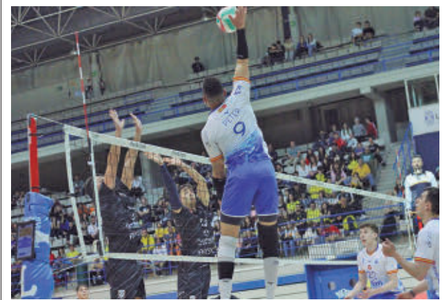
El Leganés ejerce como anfitrión RFEVB

Este sábado 26 (20 horas), el Ikasa Madrid defiende su cuarta posición en la cancha del líder de la categoría, el Plus Car Lanzarote.