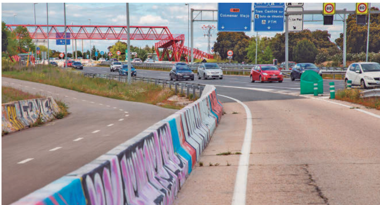
La remodelación permitirá aliviar el elevado volumen de tráfico de esta vía