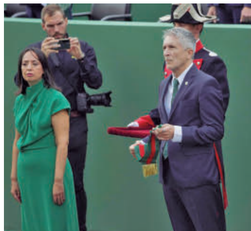
El ministro del Interior, Grande-Marlaska

EL PERIÓDICO GENTE NO SE RESPONSABILIZA NI SE IDENTIFICA CON LAS OPINIONES QUE SUS LECTORES Y COLABORADORES EXPONGAN EN SUS CARTAS Y ARTÍCULOS