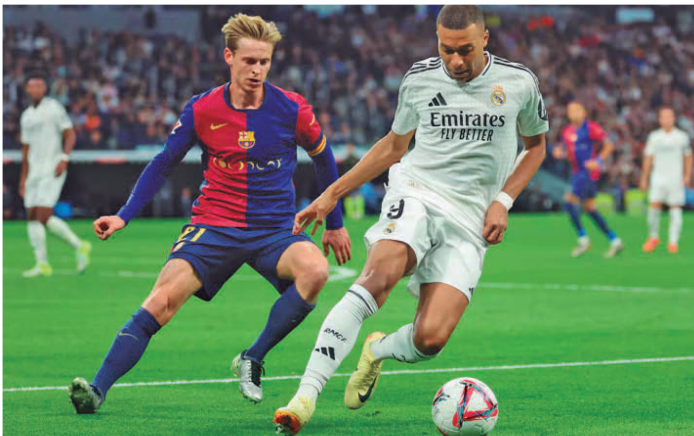
Imagen del partido disputado en la final de la Supercopa en el mes de enero