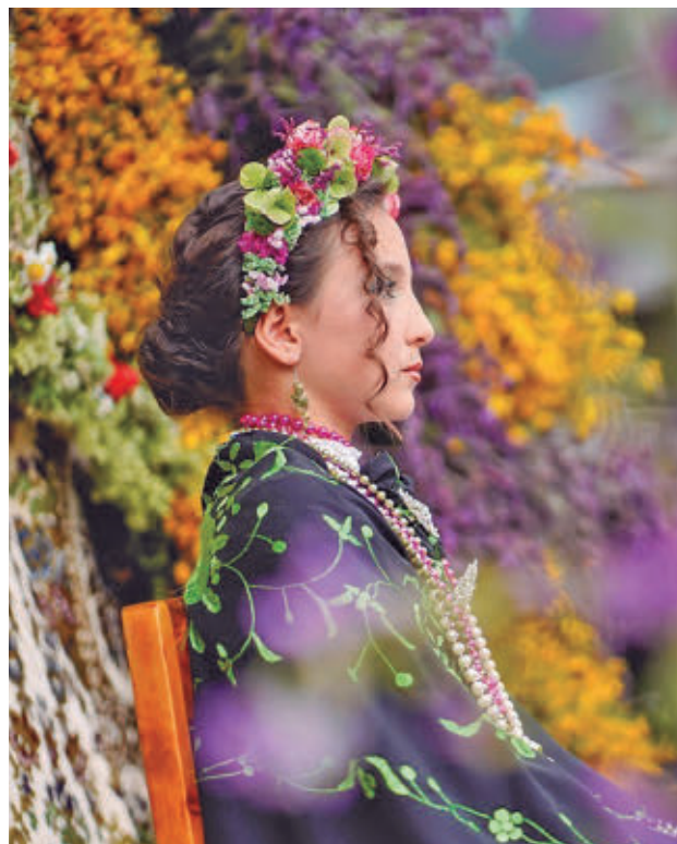
Esta fiesta se recuperó en la década de los años 70

La celebración arrancará a las 12 del mediodía, en la Plaza del Pueblo, con el 'Concierto del 2 de Mayo' ofrecido por la Banda Sinfónica de Colmenar Viejo, bajo la dirección de Francisco Juan Rodríguez. Ya en el turno vespertino, desde las 17 horas, tendrá lugar la exposición de las seis Mayas participantes ubicadas en cinco localizaciones (el pórtico de la calle Mar-