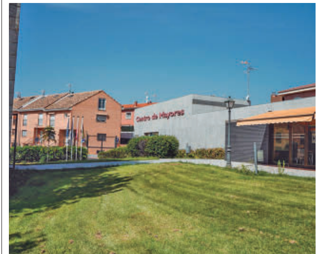
Las sesiones arrancaron este jueves 24

Para facilitar la participación de los usuarios de estos centros de mayores, en vez de fichas, habrá rotuladores para tachar los números que se vayan extrayendo de los bombos.