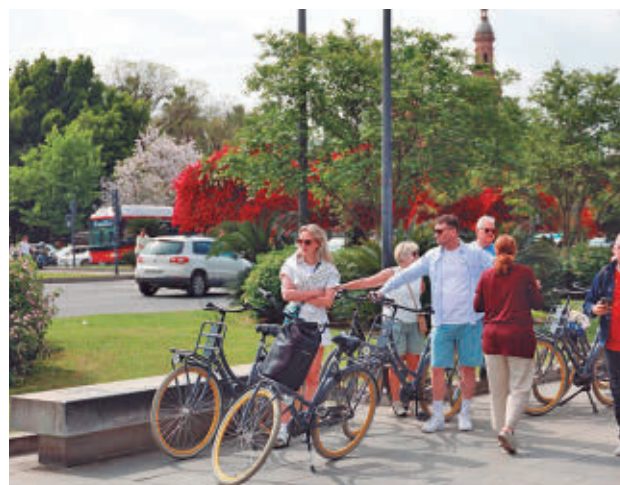
Varios turistas recorren el centro de Sevilla

respecto al mismo periodo de 2024. Por países, y mirando el gasto, Reino Unido fue el que más acumuló, un 15,9% del total; seguido de Alemania, con un 12,3%; y los Países Nórdicos que sumaron un 8,8%. El mayor número de visitantes registrados también lo encabeza Reino Unido con más de 3,1 millones (un aumento del 4,6%); seguido de Francia, con más de 2,1 millones (un incremento del 7,1%); y Alemania, con cerca de 2,1 millones (lo que supone un 0,1% menos). Según apunta el minis-