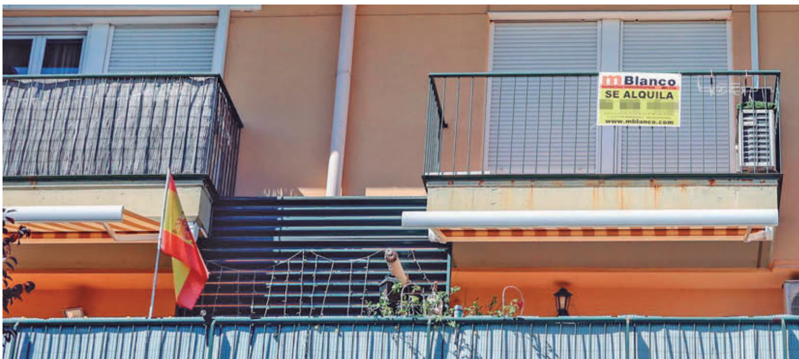
Los precios de las viviendas de segunda mano se han disparado en el último año