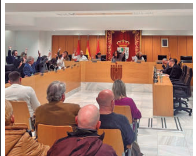
Imagen de un pleno de esta legislatura

venir escenarios que superen el aforo permitido. Además, habrá un puesto de la Policía Local en la zona de atracciones.