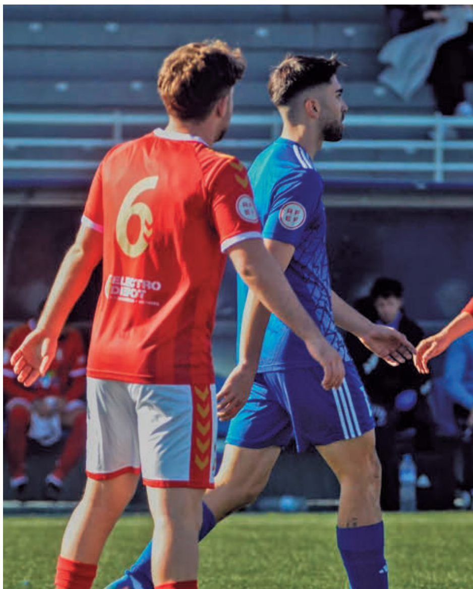
El campeón, el Alcalá, recibirá este domingo a Las Rozas RSD ALCALÁ

De ahí saldrán los cuatro participantes en las semifinales