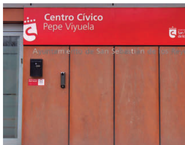
Los cursos presenciales serán en el Centro Cívico Pepe Viyuela

El primer curso, 'Financiación de entidades a través del patrocinio, mecenazgo y crowdfunding', se impartirá el 5 de junio por la plataforma Zoom. Los interesados deberán confirmar la inscripción del 2 al 4 de junio.