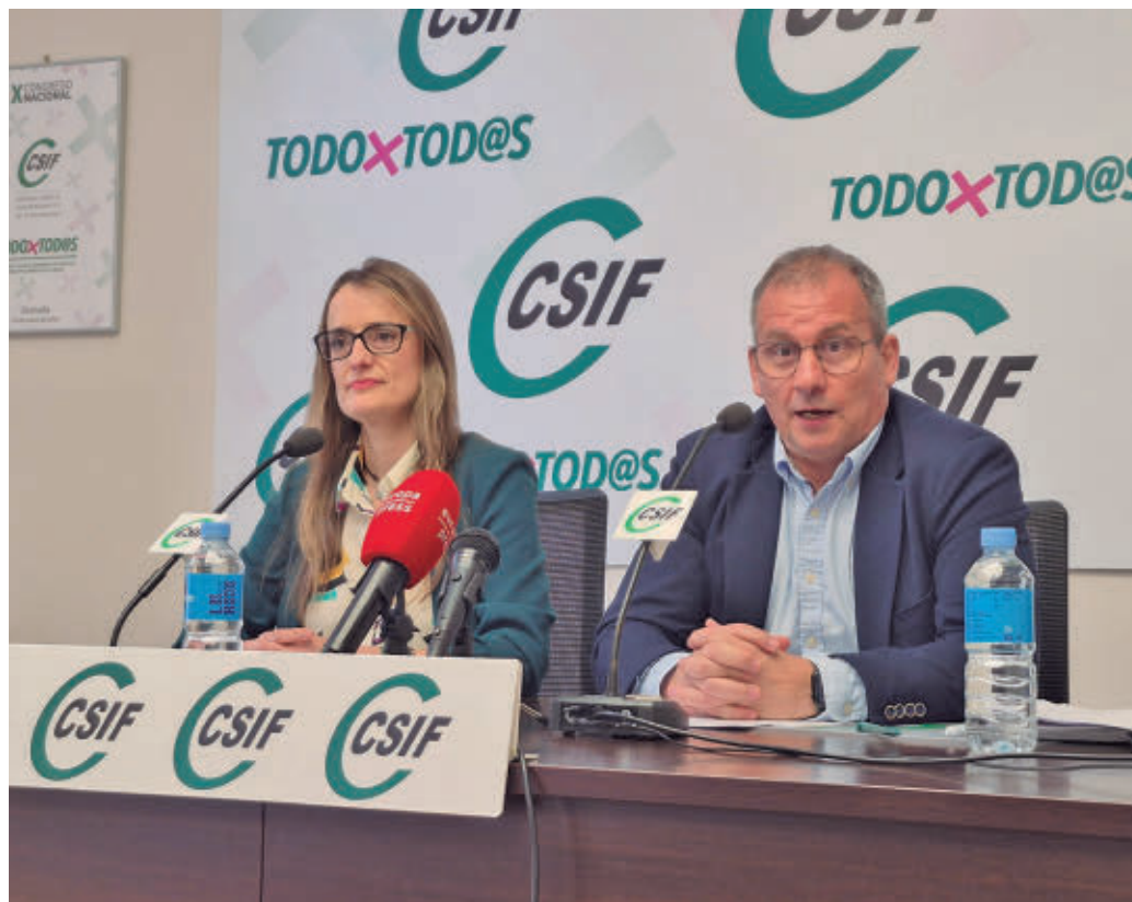
La Central Sindical Independiente y de Funcionarios (CSIF) ha presentado su encuesta CSIF

Una encuesta de CSIF advierte de que más de la mitad de profesores de escuela pública sufre problemas de convivencia con los alumnos • Los conflictos en redes sociales son el segundo problema detectado en los centros