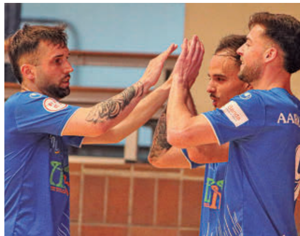
El Móstoles ya mira al 'play-off'