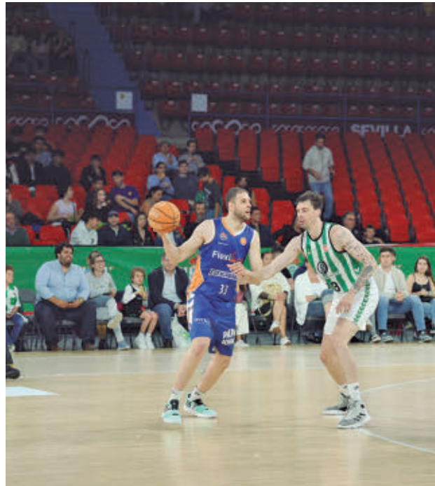
El 'Fuenla' cayó en su visita a Sevilla FEB

Con el billete para el 'play-off' de ascenso en el bolsillo desde hace varias semanas, tanto Movistar Estudiantes como Flexicar Fuenlabrada se presentan en la última jornada de la fase regular de la Primera FEB con el propósito de hacerse con la segunda posición. En estos momentos ese privilegio es para el cuadro estudiantil, aunque,