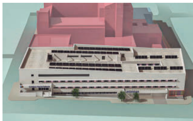
Las obras comenzarán en junio y durarán unos 36 meses

El proyecto incluye un nuevo edificio de siete plantas que añadirá 18.600 metros cuadrados a las instalaciones actuales. Dos plantas albergarán Urgencias y Ra-