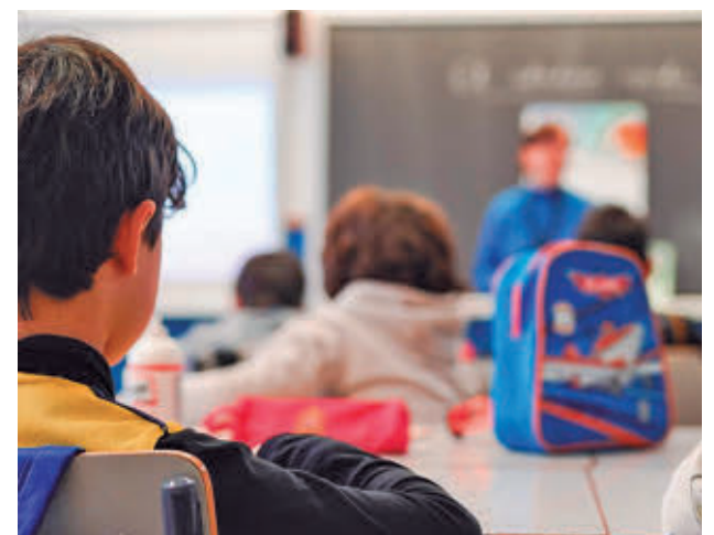
Las clases empezarán el 8 de septiembre

El último día de clases será el 19 de junio para todos los estudiantes, excepto los de segundo curso de Bachillerato, que dependen de las pruebas de acceso a la universidad. Las escuelas infantiles acabarán el 31 de julio.