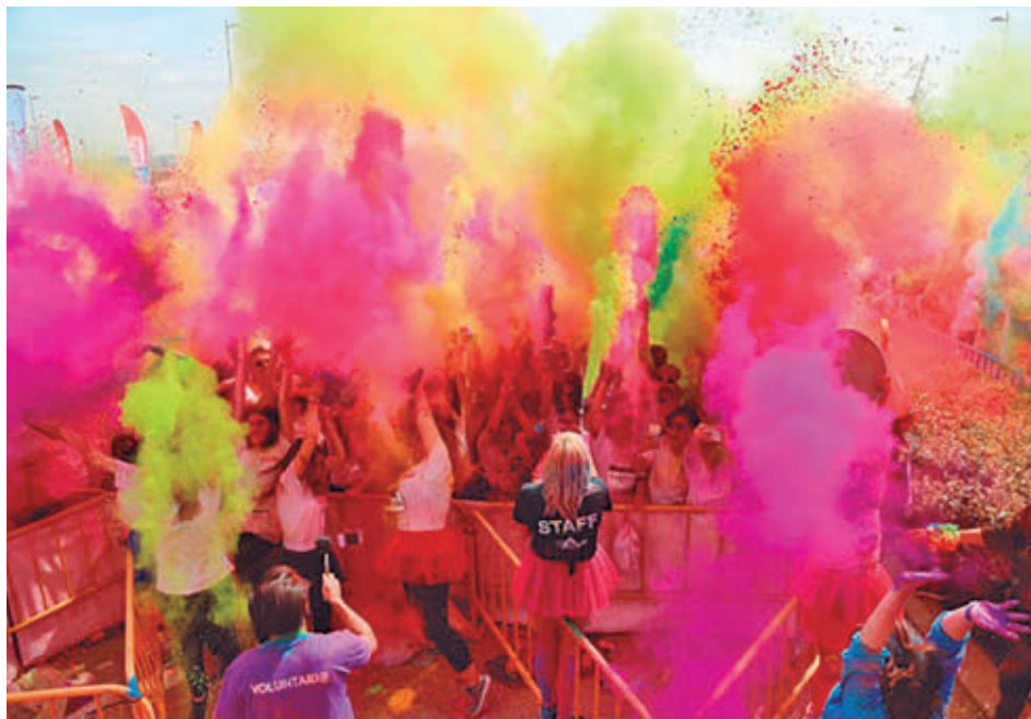
La carrera Holi recorrerá 2 kilómetros entre Iker Casillas y Finca Liana

Una hora antes del comienzo se entregarán camisetas, dorsales y bolsas con polvos holi. El polvo es biodegradable y seguro, aunque se recomienda protección para personas sensibles.