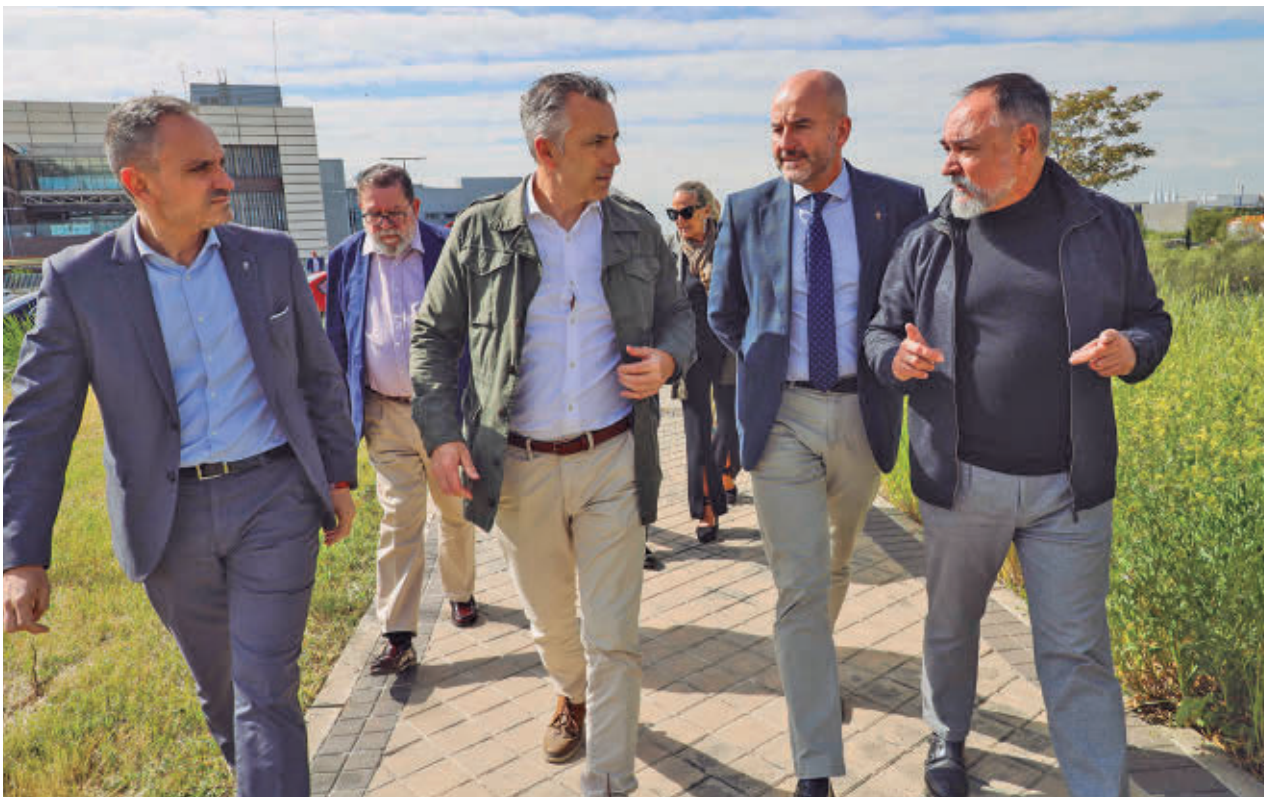
El nuevo polígono ocupará 1.970.549 m, el equivalente a 270 campos de fútbol