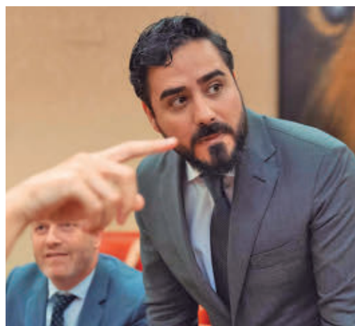
El eurodiputado Alvise Pérez

EL PERIÓDICO GENTE NO SE RESPONSABILIZA NI SE IDENTIFICA CON LAS OPINIONES QUE SUS LECTORES Y COLABORADORES EXPONGAN EN SUS CARTAS Y ARTÍCULOS