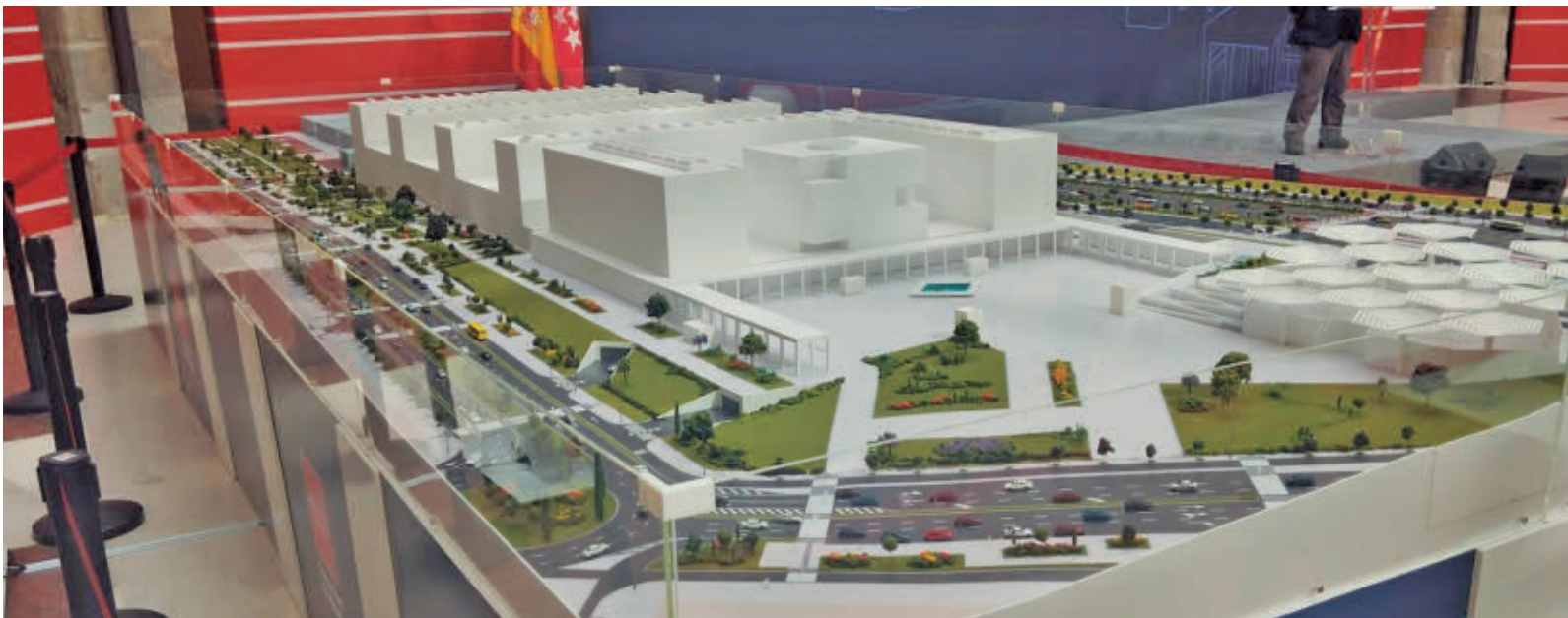
Maqueta de la futura Ciudad de la Justicia de la Comunidad de Madrid