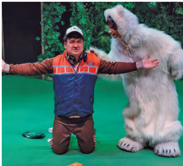
'Polar' trae una comedia en tres actos en el Teatro del Bosque