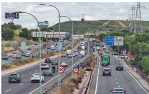
Se han producido 15 siniestros de tráfico en el Puente E.P

Además, de todos los fallecidos, 7 eran usuarios vulnerables (2 peatones, 2 ciclistas y 3 motoristas), mientras que