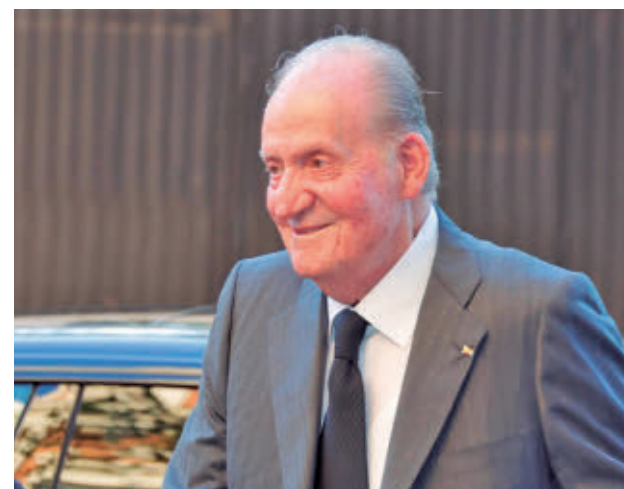
El rey emérito Juan Carlos I

Algunos de los presuntos delitos fiscales ya habrían prescrito.