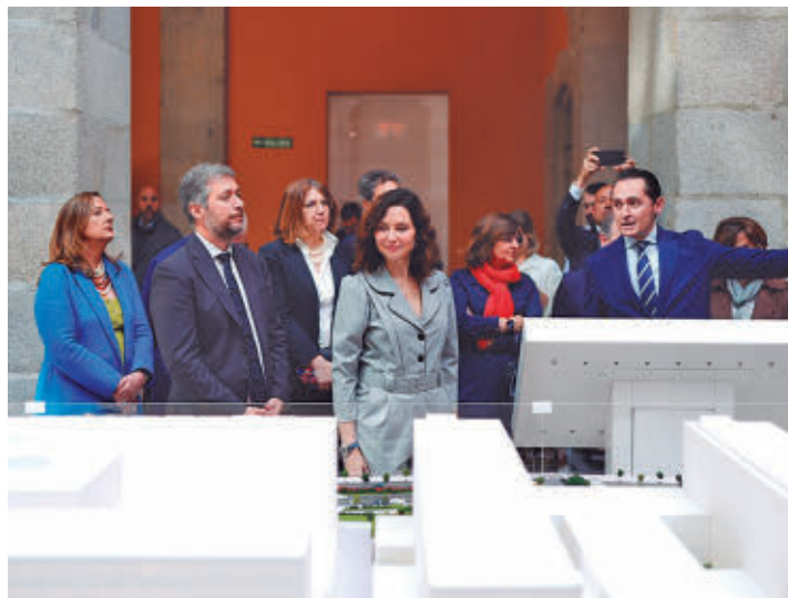
Díaz Ayuso presentó el proyecto

Una gran plaza de 13.500 metros cuadrados (casi tan grande como la Puerta del Sol), con zonas verdes, una gran fuente y aparcamiento para bicicletas, dará la bienvenida a los ciudadanos y profesionales que acudan a ella. Está previsto que más de 33.000 lo