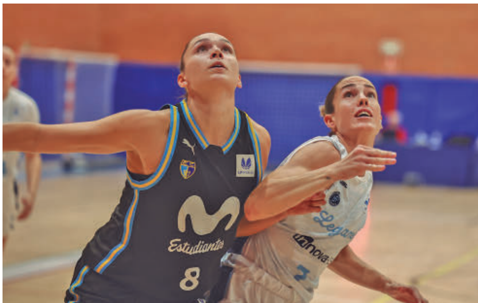
El primer derbi del curso se jugará en el Pabellón Europa FB MADRID

Por su parte, el Movistar Estudiantes dejó una buena imagen en su visita a la cancha del Casademont Zaragoza, aunque se marchó de vacío. El miércoles sumó otra derrota con el Ferrol (83-86).