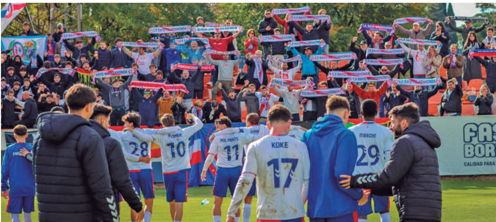
Imagen de los jugadores del Rayo Majadahonda celebrando el triunfo logrado recientemente en el campo de la RSD Alcalá