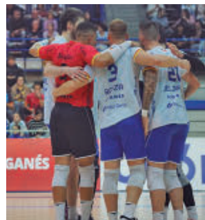
Triunfo ante el San Roque

Con 12 puntos en su casillero, solo dos menos que el primer clasificado, el Ikasa Boadilla afronta este sábado (18:30) un nuevo partido a domicilio. Será ante el Lleida Handbol, noveno en la tabla.