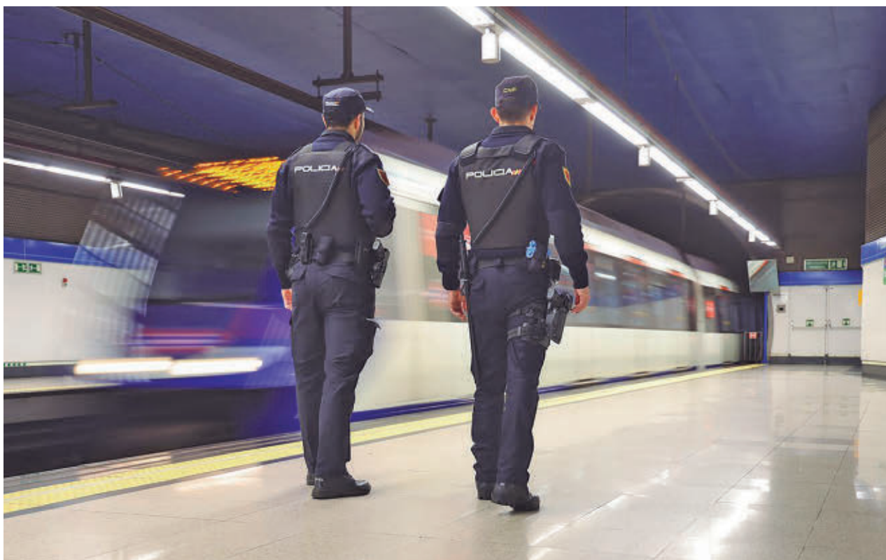
Dos agentes patrullan por uno de los andenes del suburbano madrileño