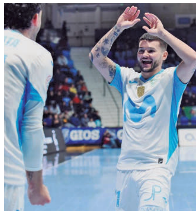
Pani y Pirata celebrando un gol en Pamplona

La novena jornada de la División de Honor masculina de waterpolo depara este sábado la visita del colista, el Encinas Boadilla, a la piscina del segundo clasificado, el Keio CN Sabadell.