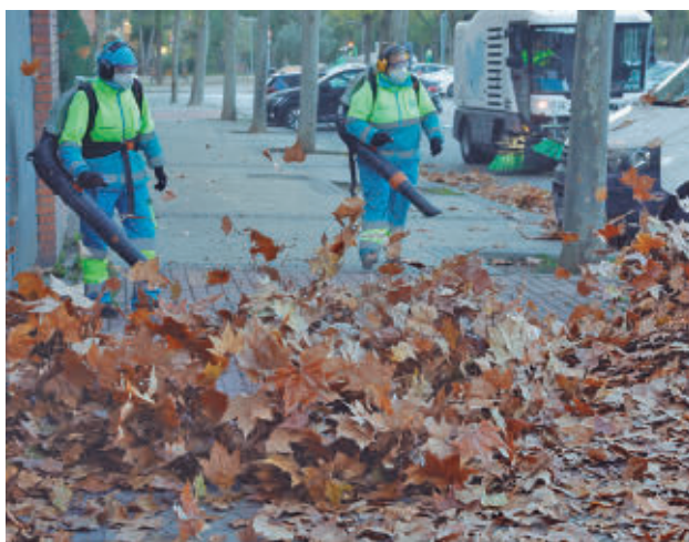
Dos operarios soplan las hojas acumuladas en una acera

Con el fin de garantizar los accesos a los garajes de residentes y la salida de vehículos aparcados en las plazas del Servicio de Estacionamiento Regulado (SER), habrá un dispositivo especial de Agentes de Movilidad.