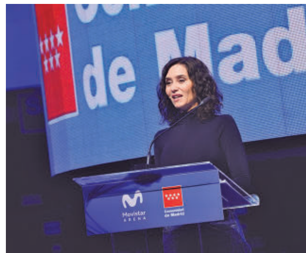
Isabel Díaz Ayuso en el Movistar Arena