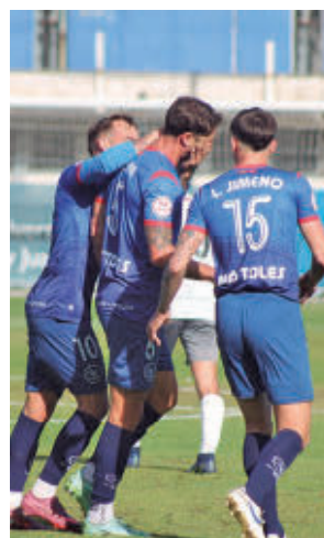
El Móstoles ya es tercero

También está a tres puntos del líder el CD Móstoles URJC antes de su duelo con el Trival Valderas en El Soto. Otro choque clave para la zona alta lo jugarán el sexto y el cuarto: Sanse B-Leganés B.