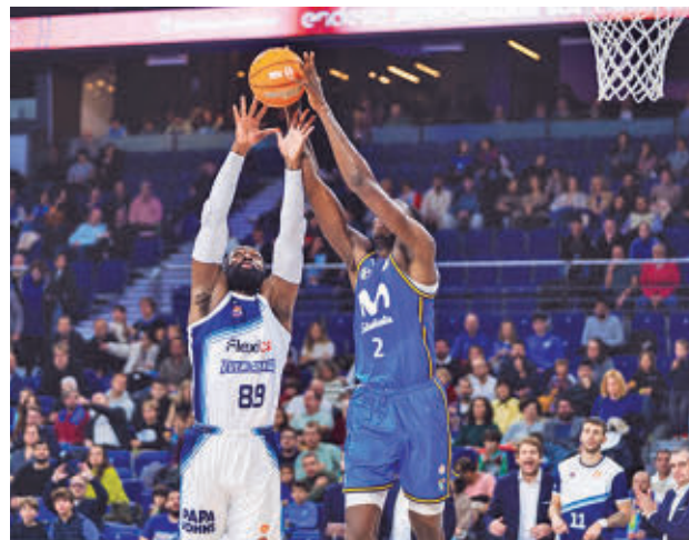
Mal momento de los dos equipos madrileños

En lo que también coinciden los dos representantes madrileños es en el amargo sabor de boca que les dejó la última jornada. Los fuenlabreños dejaban una de sus peores actuaciones en este curso para caer en casa por un concluyente 70-87 ante un equipo, el Inveready Gipuzkoa, que hasta entonces sólo había ganado un partido en la presente temporada. En