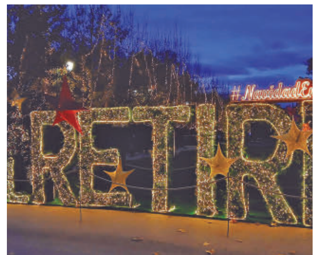
El nuevo letrero luminoso de la zona verde @PREZERO_ES

GenteMadrid.es Consulte la actualidad regional y local en nuestra página web