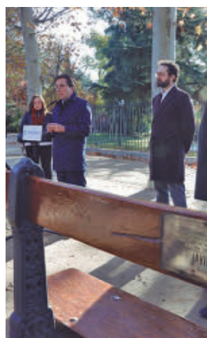
La intervención del alcalde