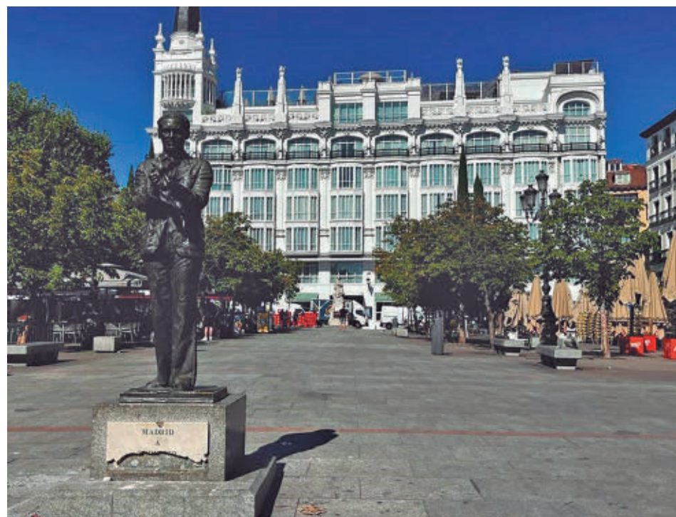
La céntrica plaza de Santa Ana

El conjunto incluye otros elementos decorativos adicionales como estrellas 3D y abetos navideños en cada extremo del letrero. "Está llamado a convertirse en un punto de interés fotográfico para los visitantes durante las próximas semanas", apuntan desde el Consistorio de la capital.