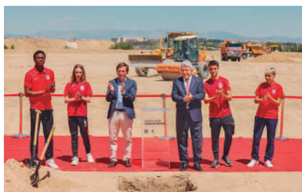
La primera piedra del proyecto se puso el 2 de julio de 2024

vulneró varios principios esenciales del procedimiento. En su resolución, la Sala estima un recurso contra el acuerdo del Pleno del Ayuntamiento de Madrid, de octubre de 2024, por el que aprobó el ‘Plan Especial Parque Olímpico Sector Oeste’, del distrito San Blas-Canillejas.