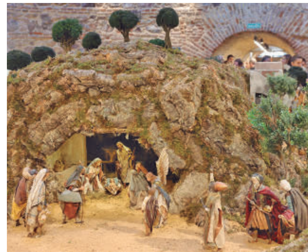
El belén monumental siciliano de la colección Basanta-Martín

Además, una docena de vitrinas acompañarán la instalación principal con piezas excepcionales de distintos belenes italianos en materiales como barro, madera, vidrio, cerámica o porcelana, representando la riqueza artística de todo un país.