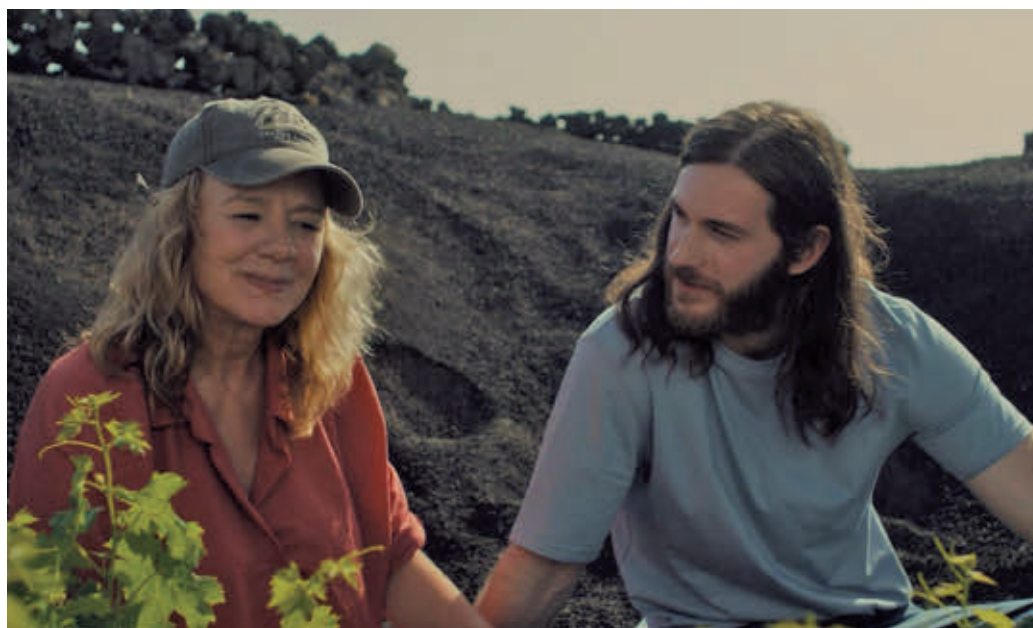
El personaje de Emma Suárez es el que más conexiones establece

La elección de las localizaciones no es casual. "Inicialmente estaba pensado el guion para rodar en un bos-