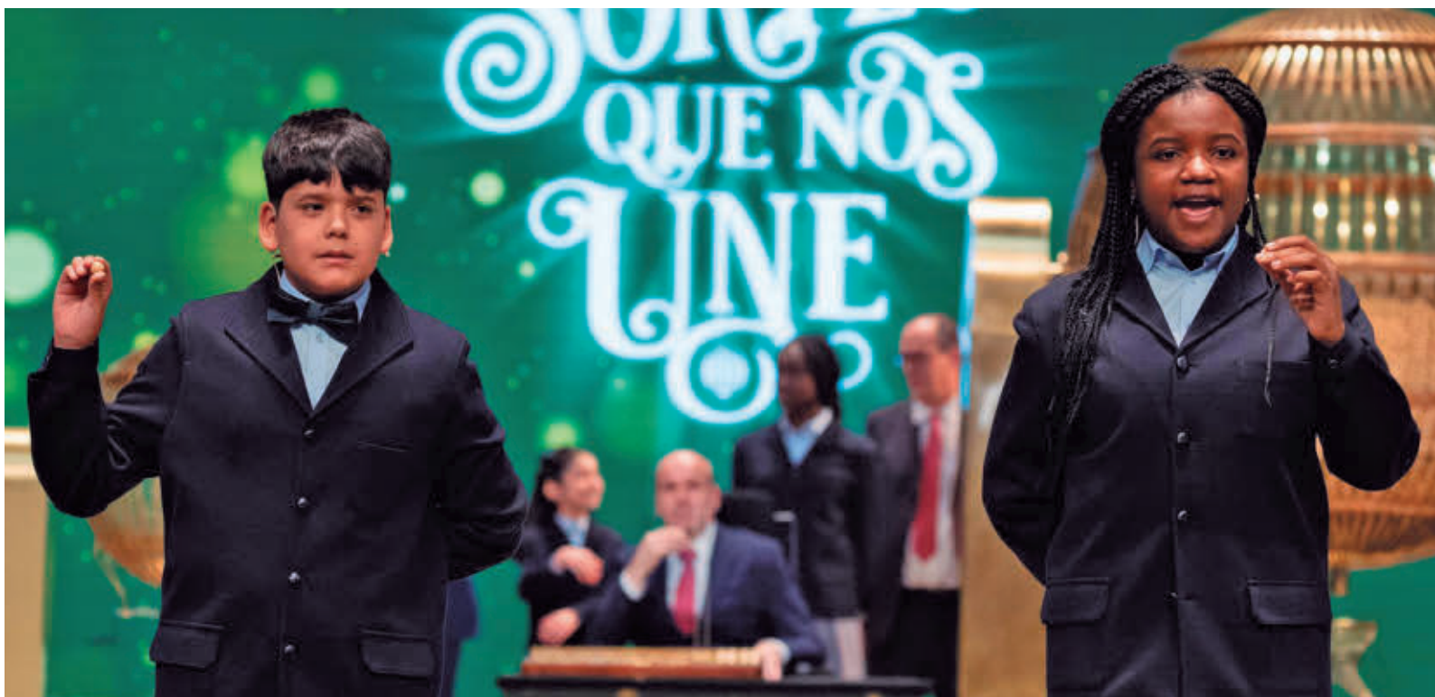
Los niños de San Ildefonso cantan los premios del Sorteo de Navidad EUROPA PRESS