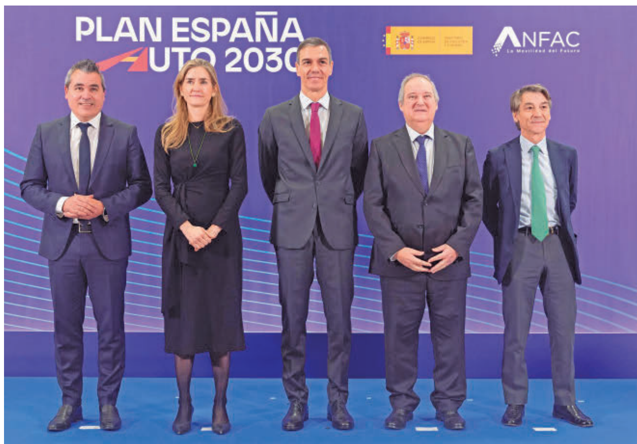
Presentación del nuevo plan para incentivar la venta de vehículos eléctricos