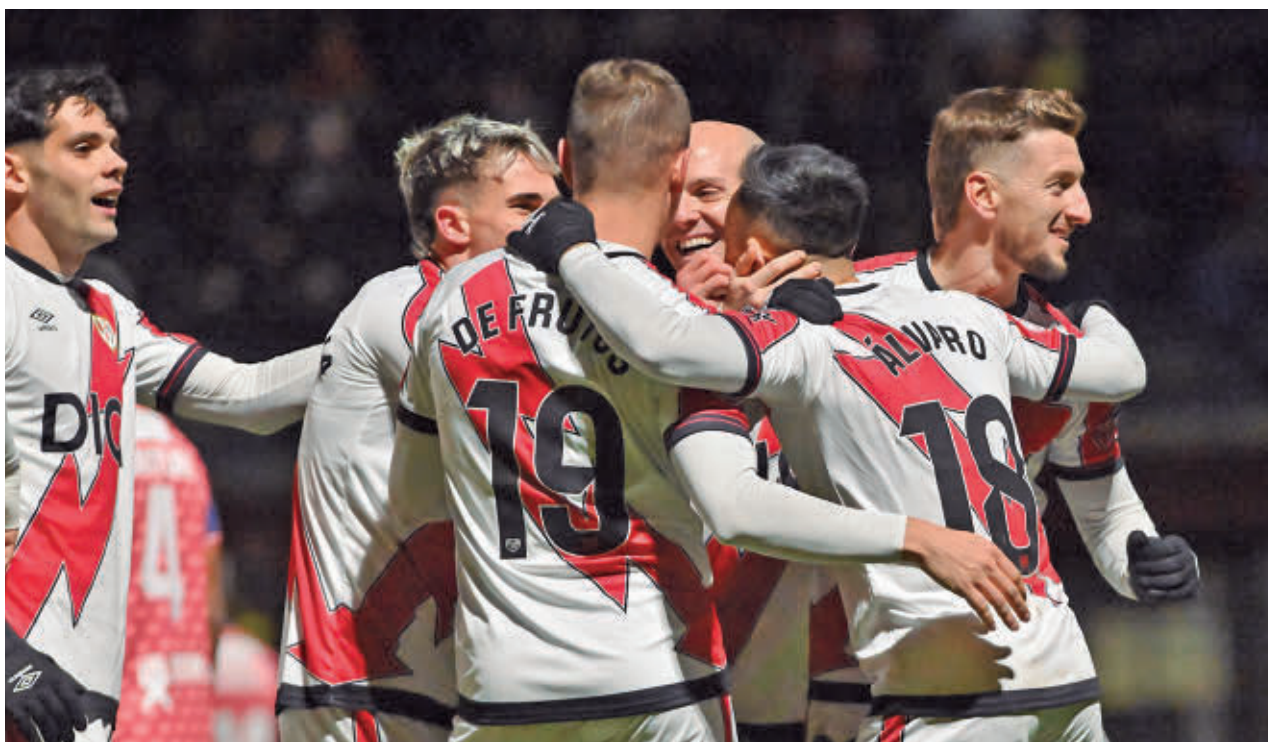
El Rayo sudó de lo lindo para eliminar en la anterior ronda al Real Ávila