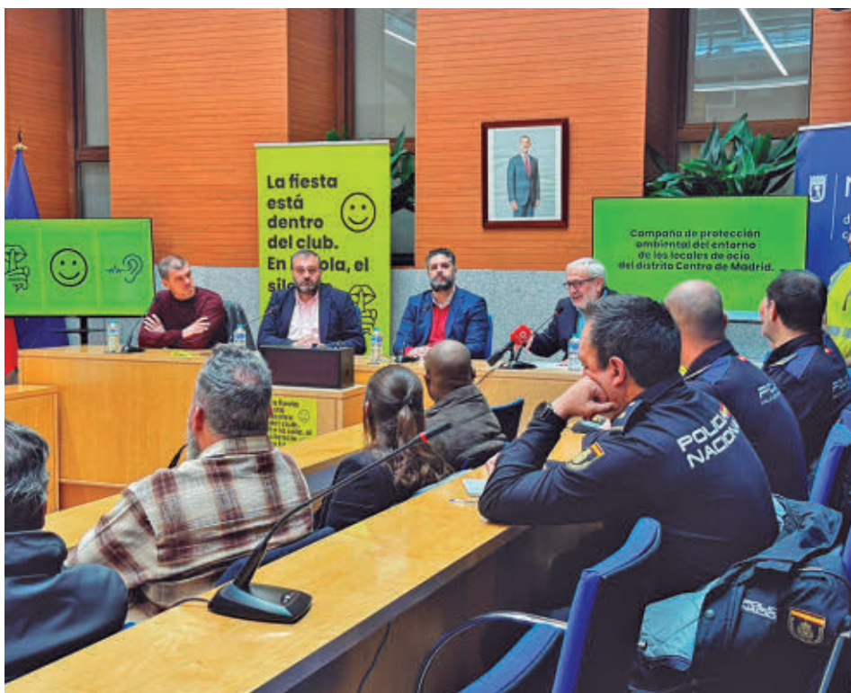
La presentación del balance tuvo lugar en el salón de Plenos de la Junta de Centro