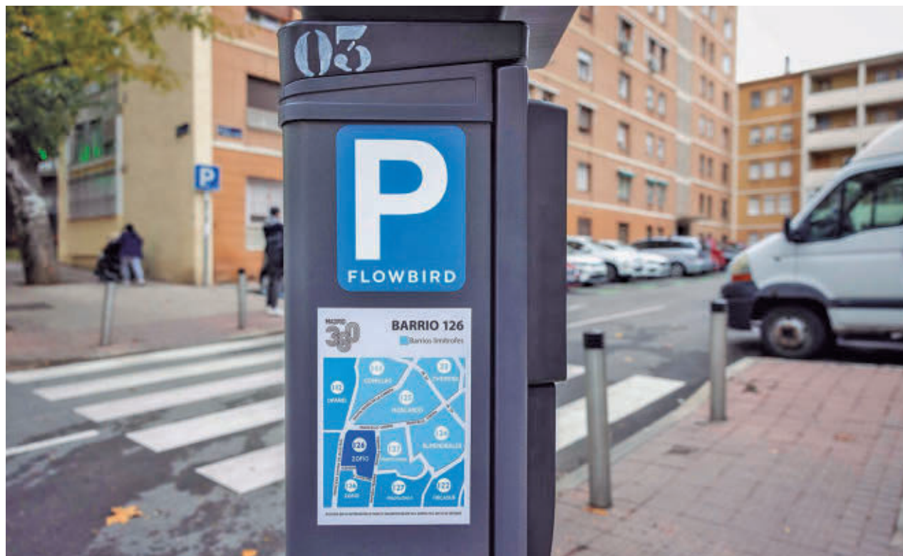
Uno de los nuevos parquímetros instalados en el barrio de Zofío (Usera)