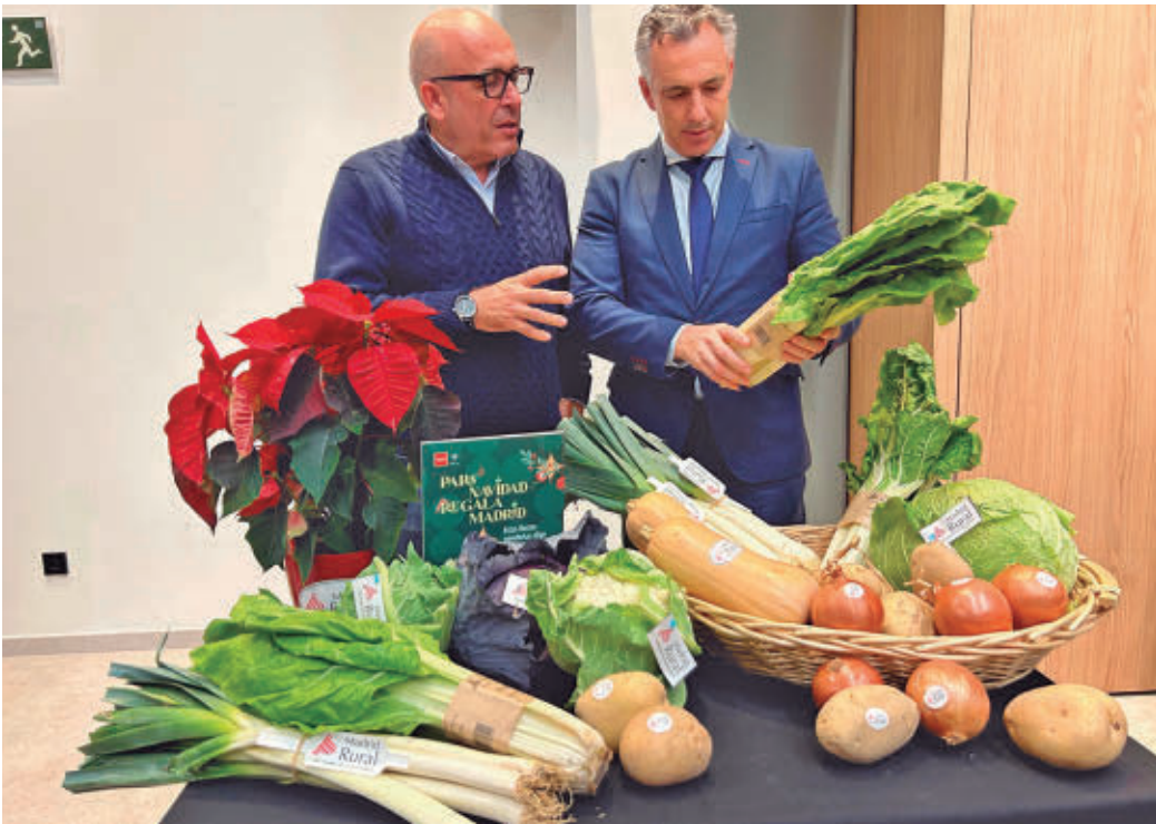
Algunos de los productos madrileños que se pueden comprar

mentarias de la Comunidad de Madrid (ASEACAM), anima con este proyecto a que los ciudadanos compren, consuman y utilicen la variada oferta de alimentos regionales en sus elaboraciones para estas fiestas. Para ello, ya se han puesto a la venta 2.500 cestas de Navidad 100% madrileñas, con 46 productos diferentes de 26 empresas participantes. Hay nueve lotes, cuyos pre-