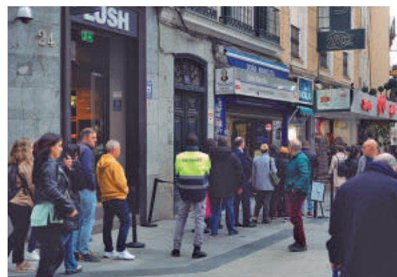
Gente haciendo cola para comprar lotería

'Gordos', seguida por Sevilla, con 19, Bilbao (16), Valencia (15), Zaragoza (14) y Cádiz (13). Otras ciudades españolas han sido agraciadas con el primer en repetidas ocasiones a lo largo de la historia del sorteo. Es el caso de Málaga, donde