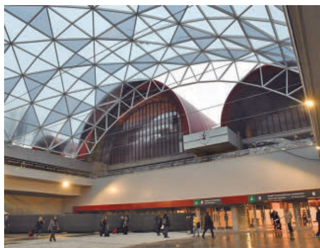
Así luce el vestíbulo tras la reforma

tud. El ensamblaje de esta máquina de última generación se está llevando a cabo a 27 metros de profundidad, punto donde se ubicarán las futuras vías de la prolongación de la Línea 11 del Metro de Madrid.