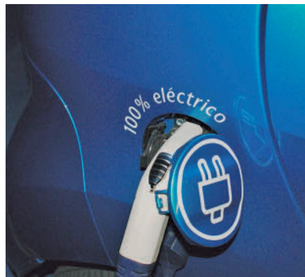
Vehículo eléctrico cargando

De hecho, el interés por el coche 100% eléctrico registra un descenso notable en 2025, y solo el 8% de los españoles lo compraría, frente al 13% de 2024. Las principales barreras citadas por los consumidores siguen siendo consistentemente