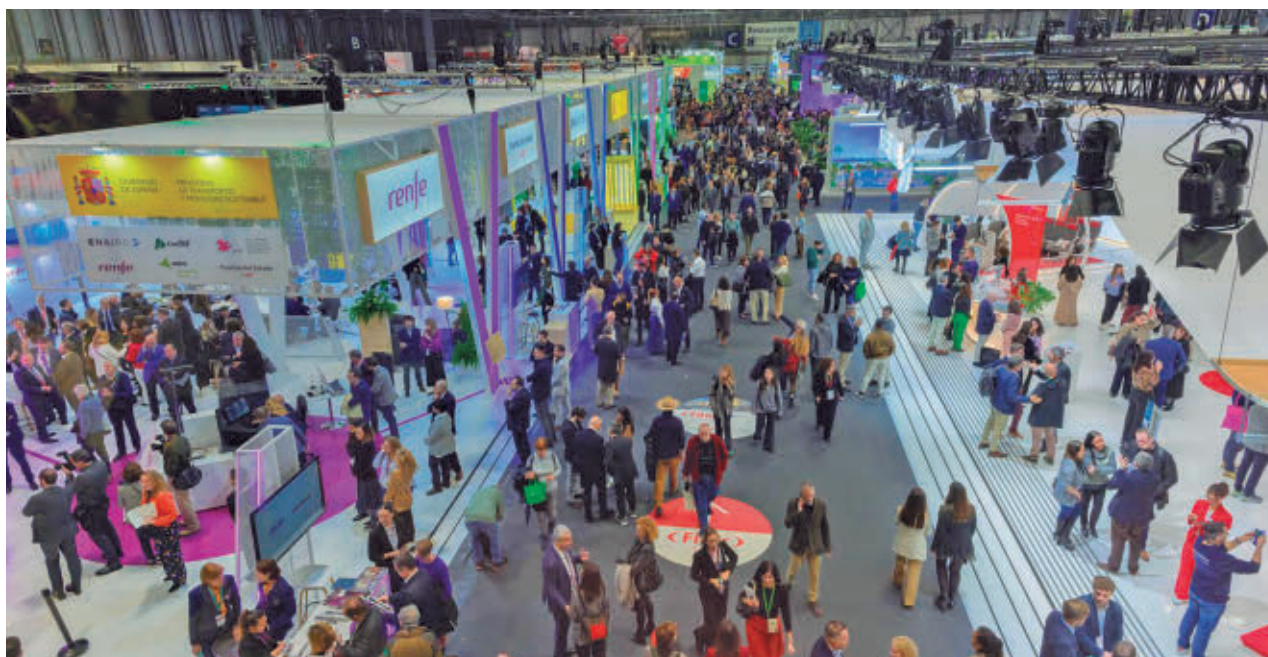
El recinto ferial de Ifema volverá a acoger una nueva edición de Fitur EUROPA PRESS

Son los países y regiones que se estrenan en Fitur