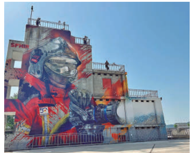
Mural del Parque de Bomberos de Alcalá

Navarro recordó que el Ayuntamiento ha destinado 15 millones en los últimos diez años a renovar los centros públicos y a instalar aire acondicionado en todas las aulas.