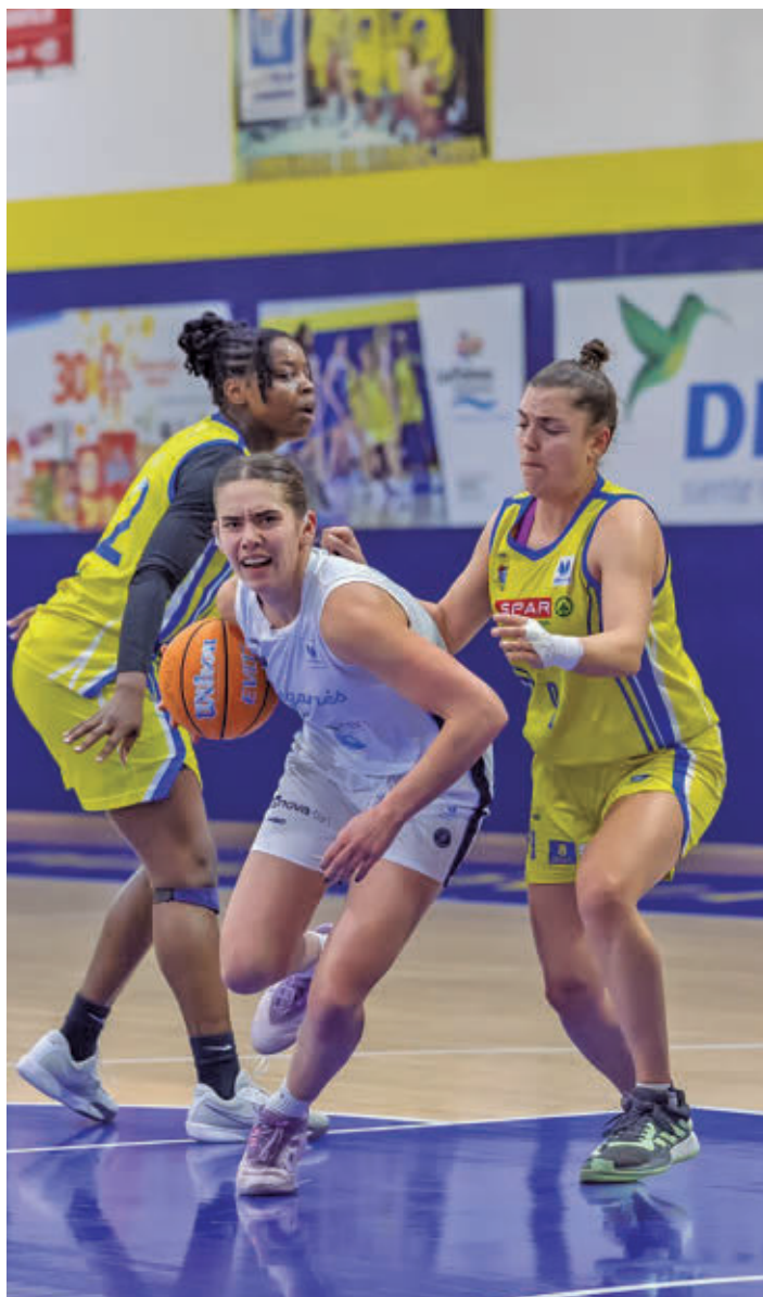
Imagen del partido en Gran Canaria

Pero hasta que llegue esa histórica cita en Tarragona a finales de marzo, el Innova-tsn Leganés deberá afrontar