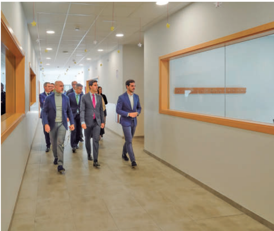
El consejero y el alcalde recorrieron las futuras instalaciones