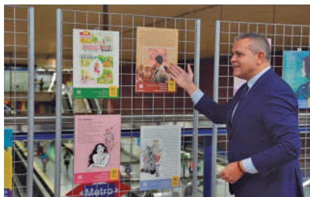
Jorge Rodrigo, en el primer acto tras su regreso

Rodrigo, que el pasado 16 de septiembre anunció su retirada temporal de la primera línea pública tras haberle sido detectado un cáncer, ha regresado más de 100 días después a su actividad con