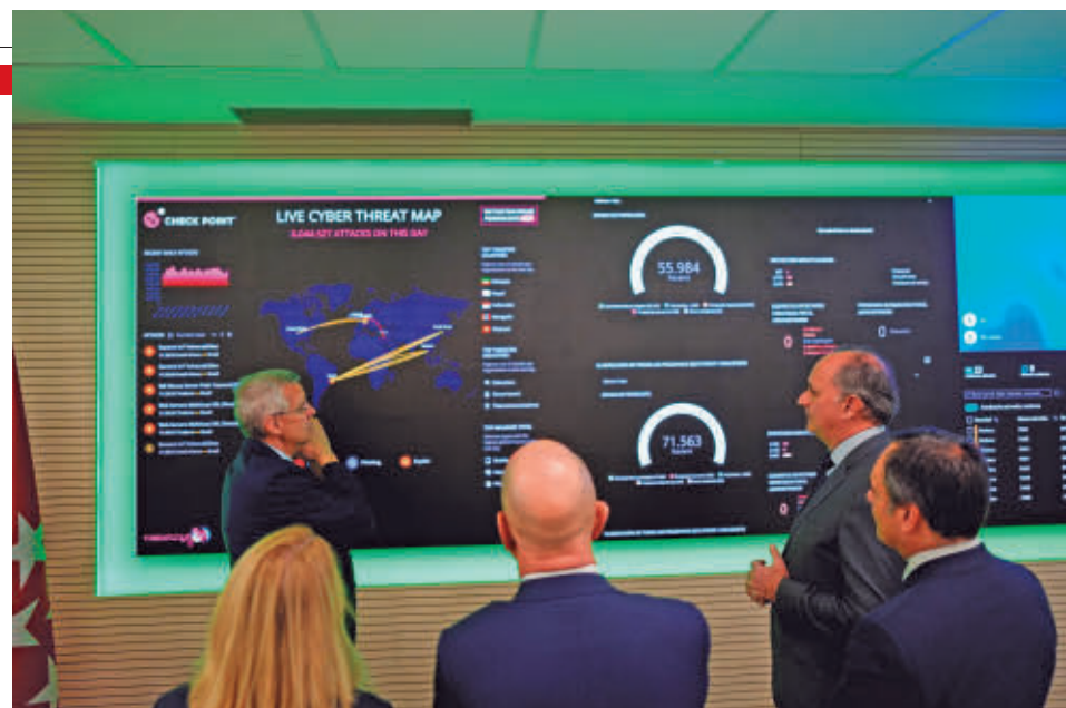
Una de las pantallas de control del nuevo centro

una sede “segura”, dotada con continuidad, tanto eléctrica como de operador de datos, y cuenta con un servicio “24/7”, que gestionará incidencias, analizará impactos, facilitará decisiones “ágiles” basadas