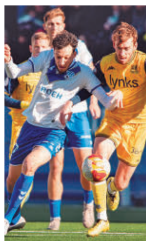
Empate ante el Europa

Esta jornada se jugarán el Hércules-Atlético Madrileño y el Castilla-Mérida.