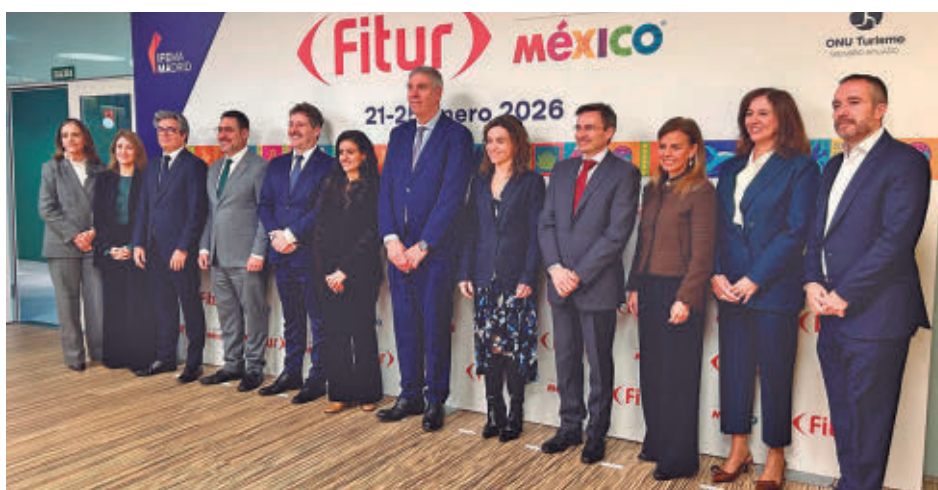
Presentación de la edición de este año de Fitur

general. La feria también ha incrementado en un 5% el número de empresas participantes, hasta las 10.000, y en ella estarán presentes 161 países y regiones. En esta edición se han unido como nuevos participantes 18 países y regiones: Abu Dabi, Dubái, algunas regiones de Alemania y Reino Unido, Angola, Argelia, Belice, Benín, Bután, Hai-