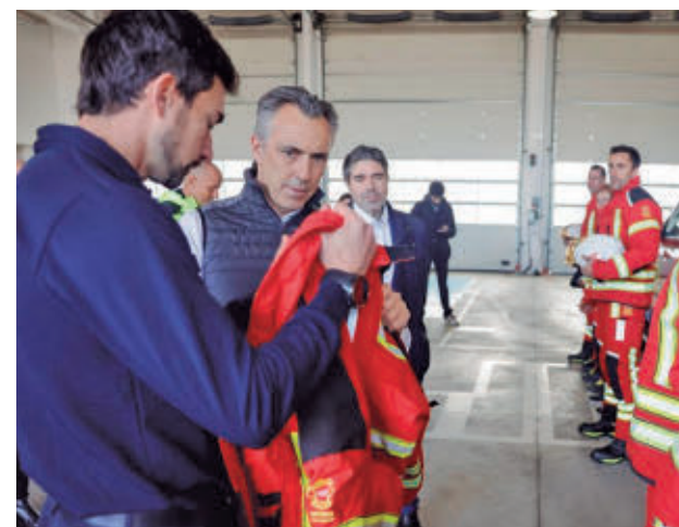
Presentación de los nuevos trajes

Otra de las características de los nuevos equipamientos es la optimización en la ergonomía, que permite a los trabajadores realizar movimientos completos ofreciéndoles una mayor comodidad. Asimismo, responden a la normativa de alta visibilidad para trabajos en la vía pública y cuentan con las certificaciones térmica y mecánica ac-