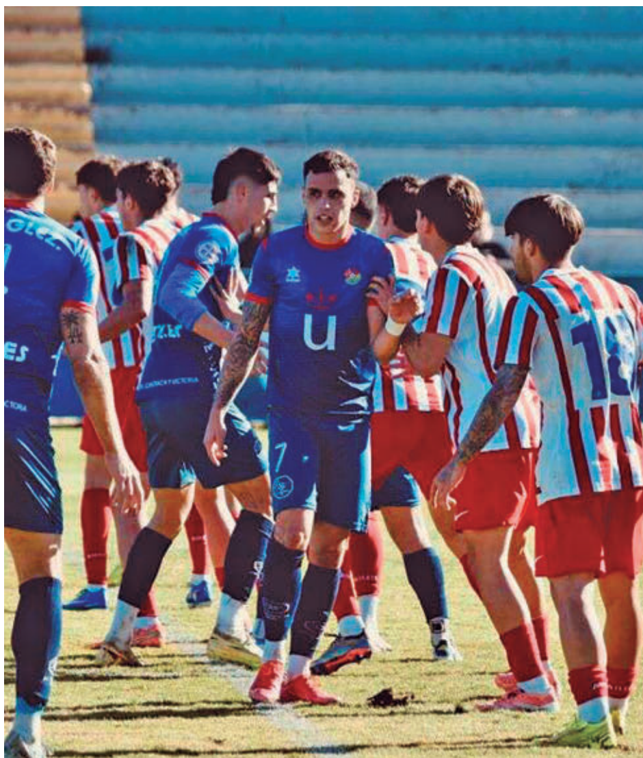
El Atlético C dio un golpe de autoridad al ganar en su visita a El Soto CD MÓSTOLES URJC

Sin demasiado tiempo para mirar al pasado, este fin de semana se disputa la jornada 18, con el líder, el Atlético de Madrid C, visitando La Mina, feudo de un Carabanchel que