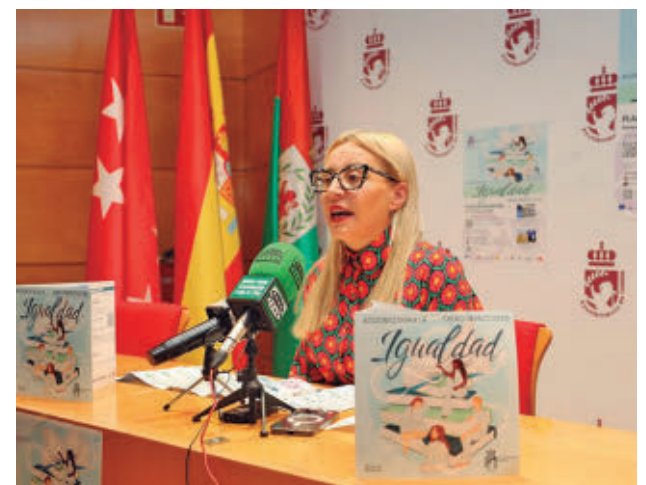
Presentación de la programación

Todas las propuestas están orientadas a la promoción de la igualdad efectiva entre mujeres y hombres, la prevención de las violencias machistas y el reconocimiento y respeto de la diversidad en todas sus expresiones. Se desarrollarán en el Centro de Información, Documentación y Asesoramiento a las Mujeres (Cidam) y en el Almudena Grandes.