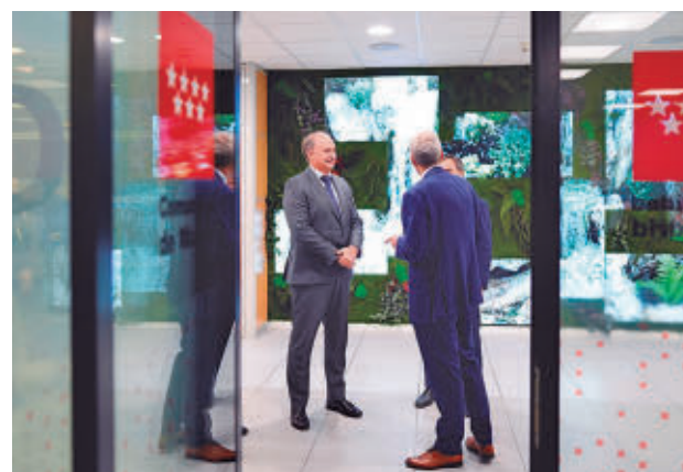
Entrada del nuevo CCIC

en datos y tratará de predecir posibles ciberataques.