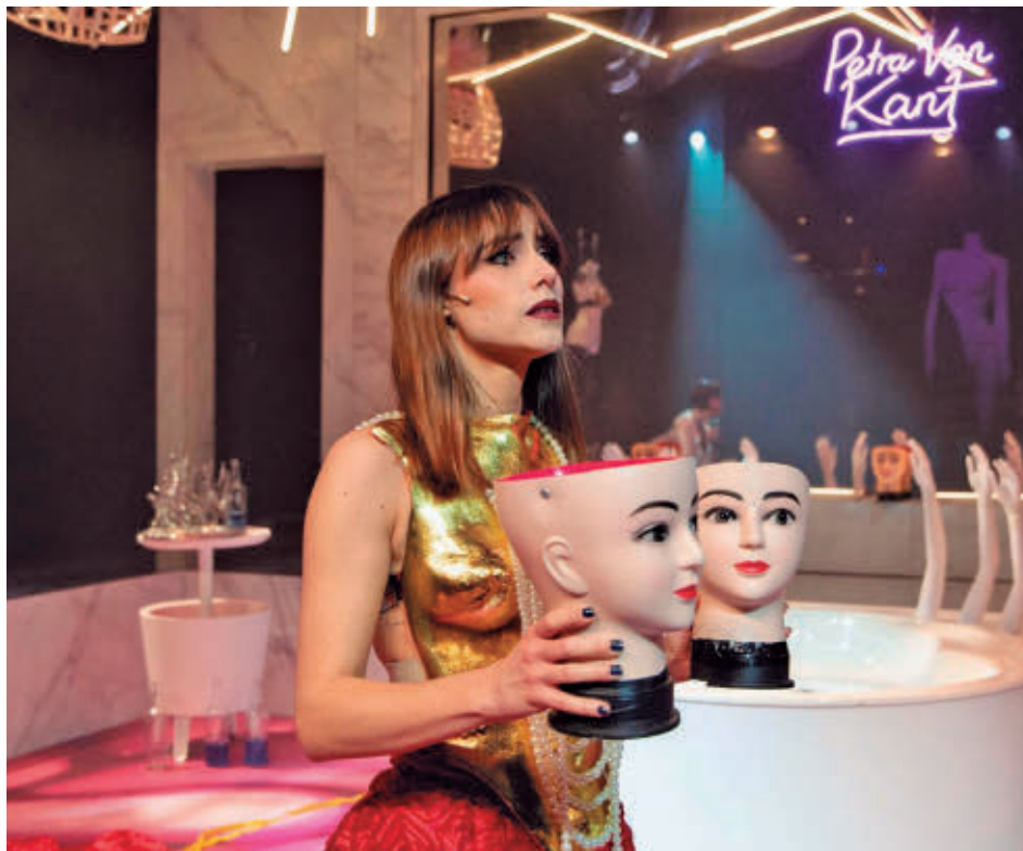
Aura Garrido en 'Las amargas lágrimas de Petra Von Kant'