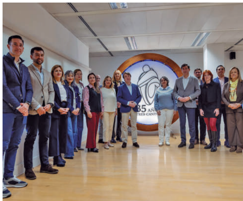
La presentación oficial tuvo lugar este pasado miércoles 14 AYTO DE TRES CANTOS

La dotación presupuestaria vinculada a estas ayudas en el presupuesto municipal del ejercicio 2025 es de 145.000 euros. Las ayudas