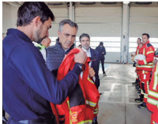
Presentación de los nuevos trajes

Otra de las características de los nuevos equipamientos es la optimización en la ergonomía, que permite a los trabajadores realizar movimientos completos ofreciéndoles una mayor comodidad. Asimismo, responden a la normativa de alta visibilidad para trabajos en la vía pública y cuentan con las certificaciones térmica y mecánica ac-