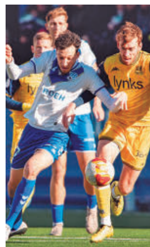
Empate ante el Europa

Esta jornada se jugarán el Hércules-Atlético Madrileño y el Castilla-Mérida.