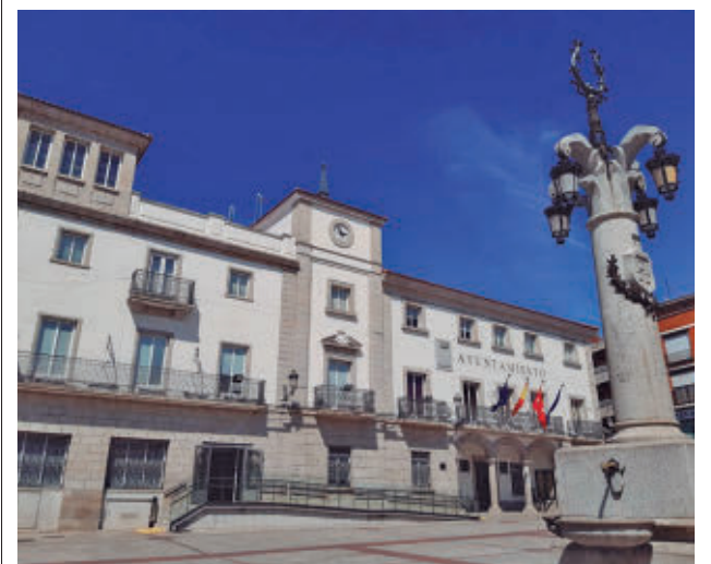
Ayuntamiento de Colmenar Viejo

Consulte la actualidad regional y local en nuestra página web