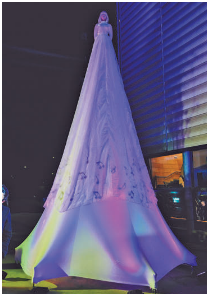
Móstoles propone un ambicioso recorrido por las artes escénicas

creciendo, innovando y ampliando miradas, con una programación de calidad pensada para todos los públicos", y añadió que "nuestra