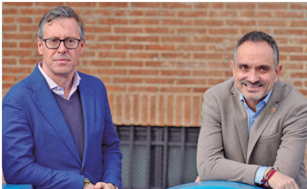
El número dos del PP de Madrid recordó que Vox obtuvo más de 220 concejales en 2023 y que 25 han abandonado sus listas