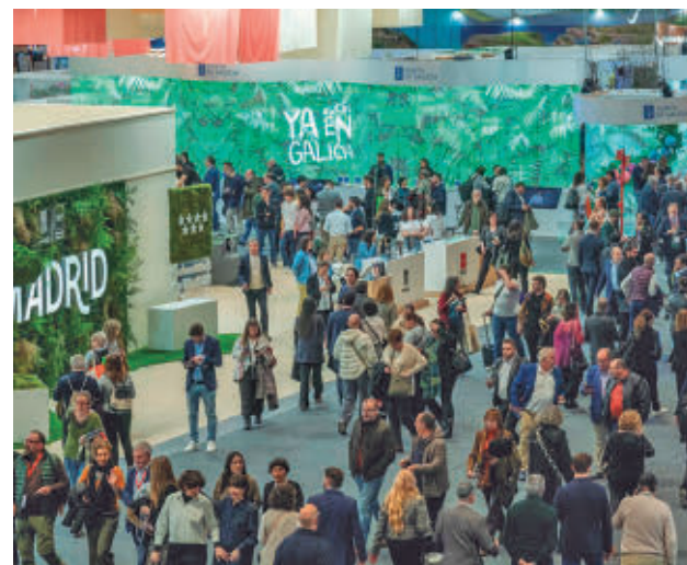
Madrid tendrá su propio stand