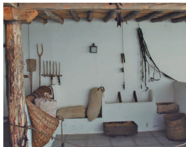
Casa de Andrés Torrejón con aperos de la época

Las visitas, que son gratuitas, se realizarán de forma periódica. La iniciativa, promovida por la concejalía de Cultura, Desarrollo y Promoción Turística, forma parte de la programación cultural municipal y busca fomentar el conocimiento y la difusión del legado histórico local.