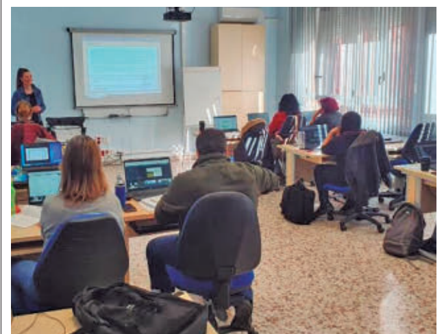
62 cursos gratuitos para desempleados y ocupados

Ambas trabajadoras habían sido apartadas tras participar en una asamblea sindical. La sentencia fija una indemnización de 7.501 euros para cada afectada por daños morales y concluye que no existió justificación objetiva ni razonable para las destituciones.