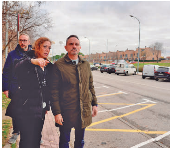
El alcalde, acompañado de la edil de Movilidad y Transportes

Se trara de estacionamiento en batería situado entre las calles Benito Pérez Galdós y Pintor Velázquez • La configuración de la vía permite reducir la velocidad de circulación