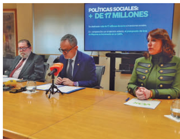
Presentación de los presupuestos aprobados por el PP y Vox

El Gobierno municipal subrayó también el aumento de recursos para mantenimiento urbano y programas sociales.