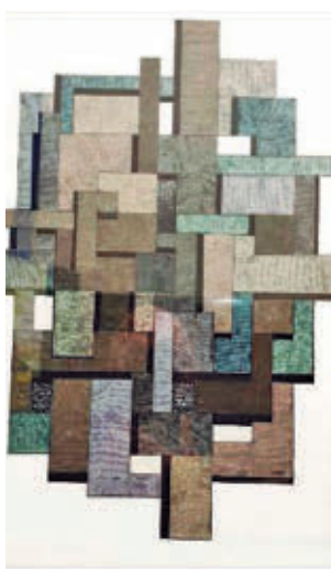
En el CSC Caleidoscopio