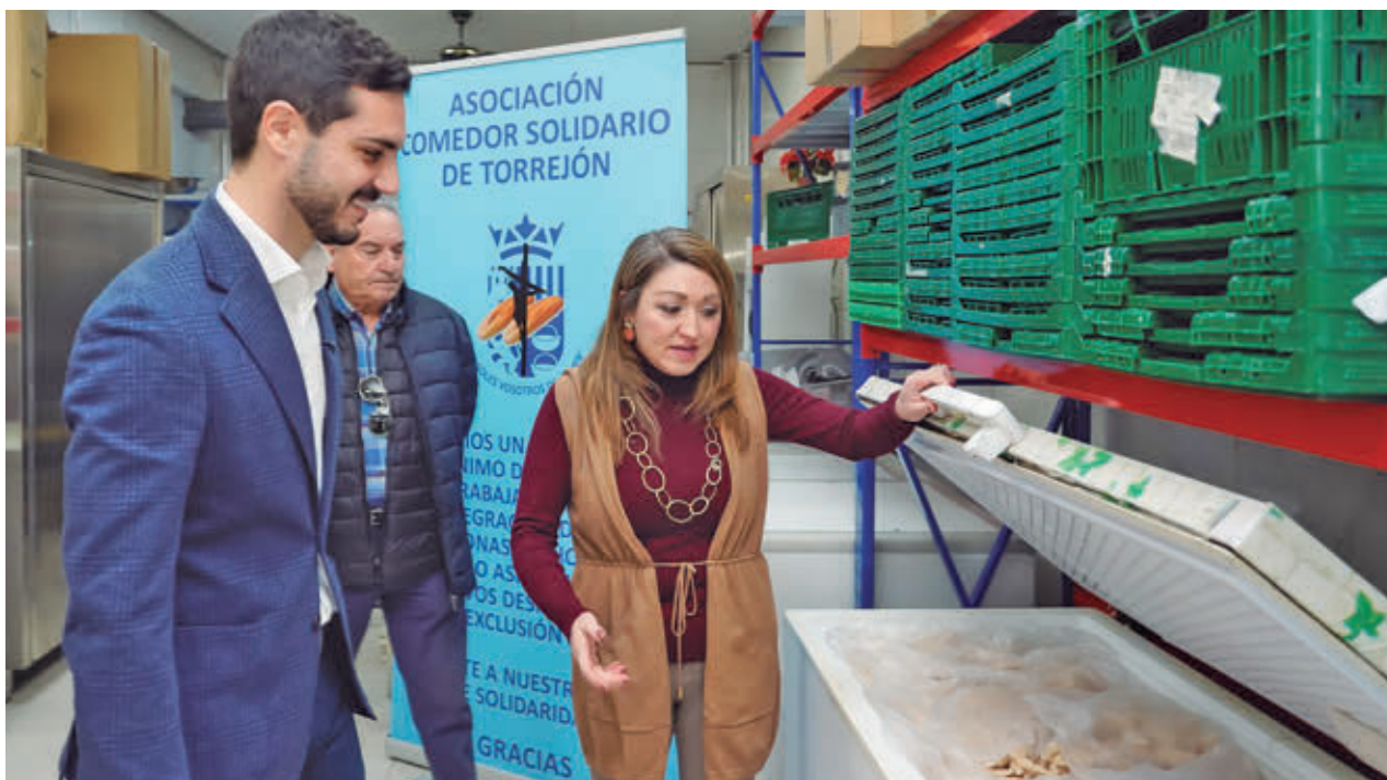
El alcalde visitó esta semana las instalaciones del Comedor Solidario