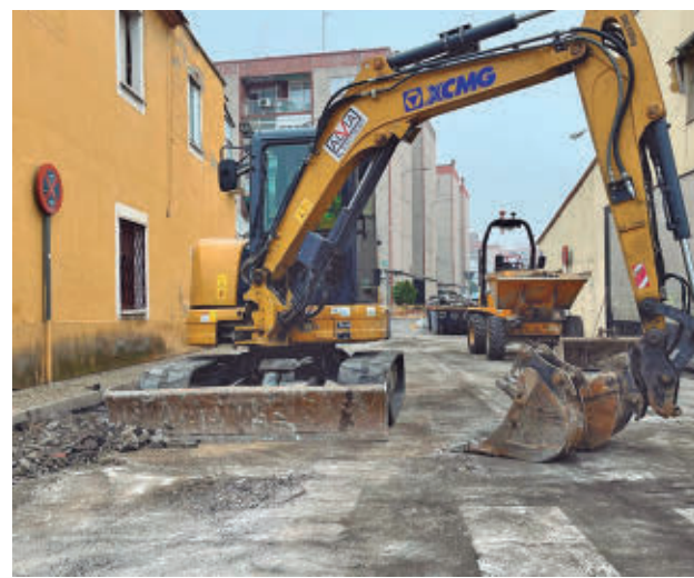
Obras en la calle de Caballería Española