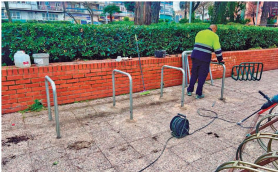
Un operario procede a la sustitución de uno de los aparcabicis

GenteMadrid.es Consulte la actualidad regional y local en nuestra página web