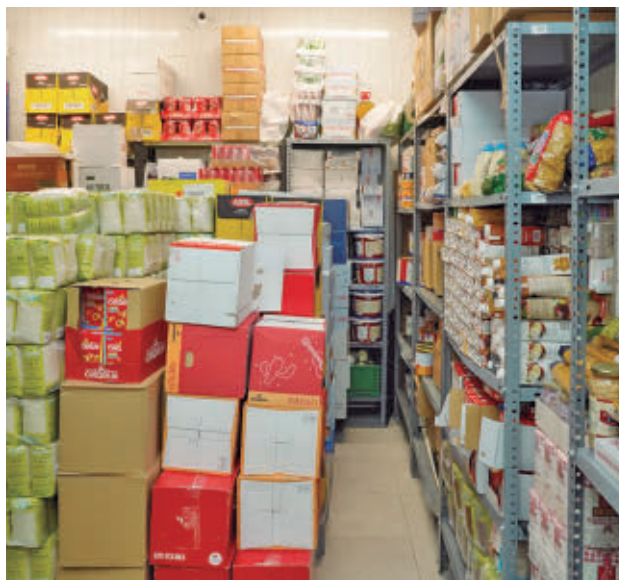
Almacén del Comedor Solidario

a los vecinos que "más lo necesitan". Se trata de una subvención extraordinaria mediante convenio de colaboración directa que viene a atender "las necesidades financieras inmediatas" que tenía la entidad para asegurar la continuidad de sus servicios (servicio de comedor Solidario y centro de acogida y encuentro para personas sin hogar), al encontrarse a la es-