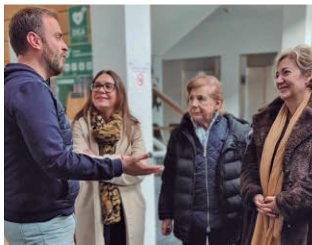
Encuentro entre los dos alcaldes

en política de mayores y tratar asuntos en materia de servicios sociales y soledad no deseada". "Hemos construido un Centro de Mayores referente para otros municipios de la Comunidad de Madrid y del que todos quieren conocer los servicios que ofrecemos porque aquí todos nuestros mayores se sienten integrados", señaló el regidor argandeño.