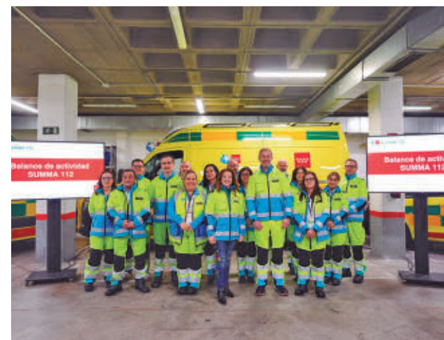
Presentación de los datos de 2025

Por su parte, las Unidades de Atención Domiciliaria (UAD) fueron requeridas en 98.235 emergencias.