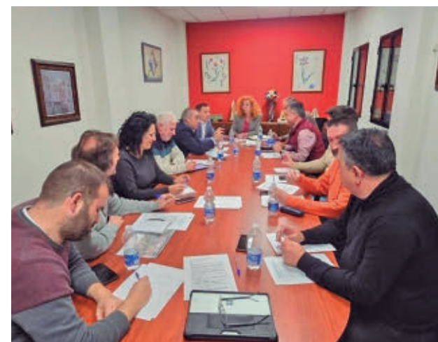
Reunión de la Plataforma Ríos Limpios

Durante la cita, todos los gobiernos locales implicados acordaron de manera unánime impulsar una moción que será elevada a los respectivos plenos municipales para ratificar el compromiso institucional con la protección del río Jarama.