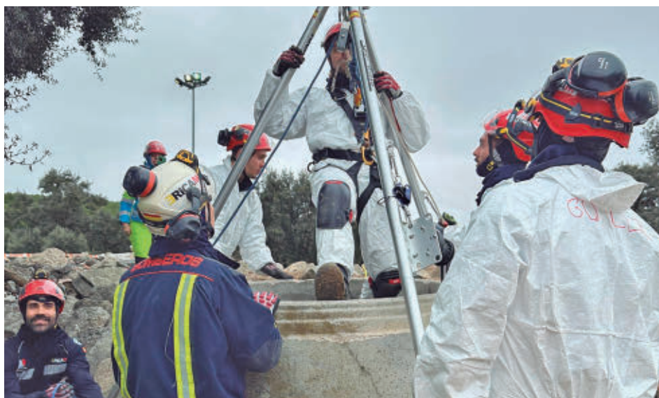
Uno de los ejercicios que se llevaron a cabo

Estas actividades forman parte del calendario anual de entrenamiento del ERICAM, especializado en el rescate en caso de grandes terremotos, como los ocurridos durante los últimos años en Lorca, Haití, Chile, Ecuador, Turquía y Marruecos, donde intervino este equipo. Dada la versatilidad de sus miembros,