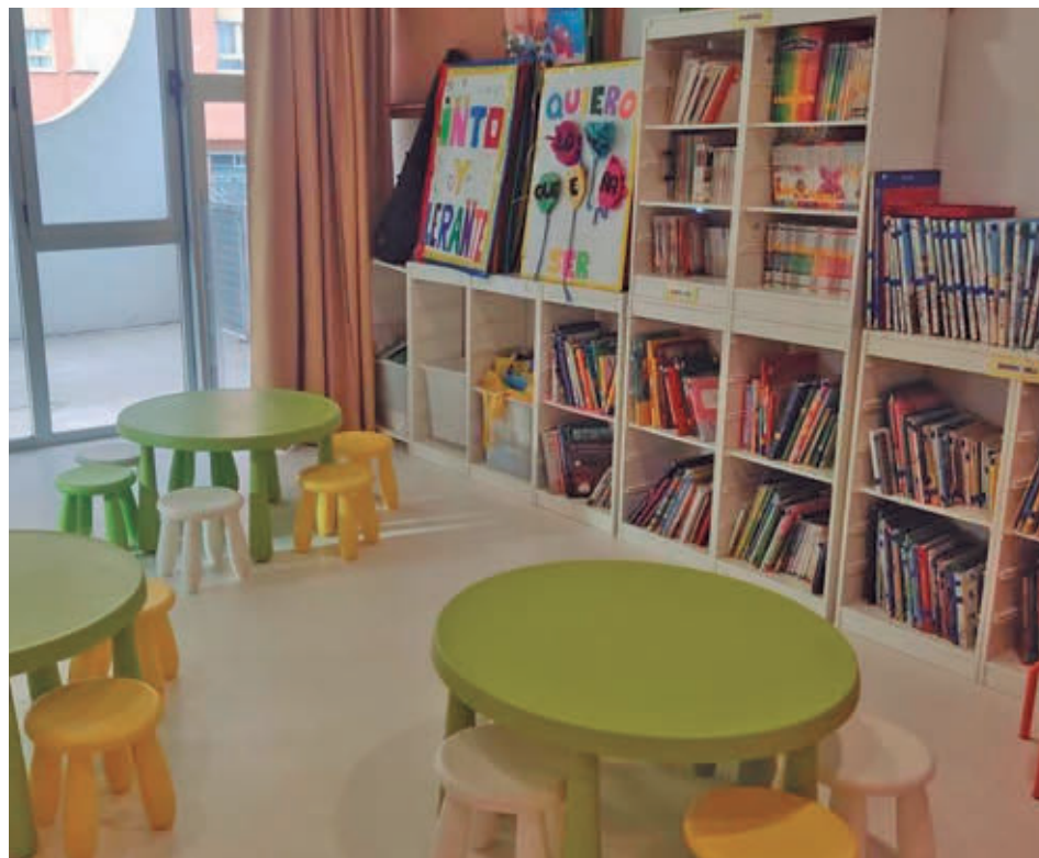
Una de las escuelas infantiles de Leganés

LOS DOS CONTRATOS TIENEN UNA DURACIÓN DE UN AÑO