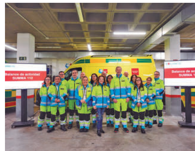
Presentación de los datos de 2025

Por su parte, las Unidades de Atención Domiciliaria (UAD) fueron requeridas en 98.235 emergencias.