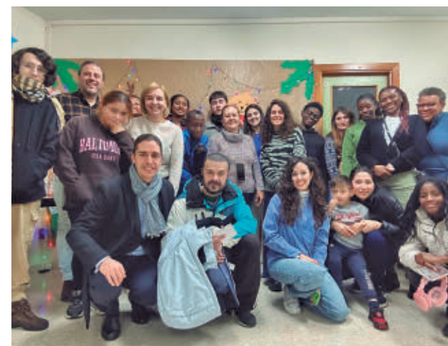
Algunos de los participantes en el programa

Se busca el asesoramiento, el apoyo y la intervención con familias acogedoras para mejorar el bienestar de los niños y adolescentes acogidos en familia extensa; la mejora de la dinámica relacional de los menores con sus núcleos acogedores, con su familia de origen y con el contexto socio-cultural y educativo en el que viven; y el desarrollo de las competencias educativas y habilidades parentales de las familias acogedoras basadas en el "buen trato a la infancia".