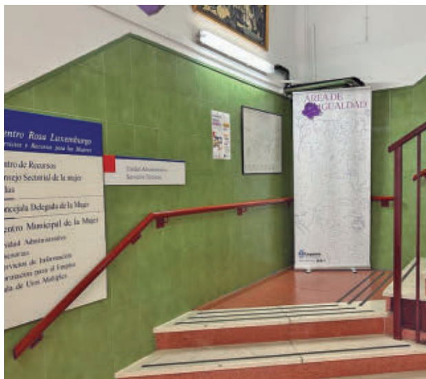
Las instalaciones se han renovado últimamente

Se trata de un recurso especializado cuya finalidad es dispensar alojamiento temporal, seguro e inmediato, así como manutención y otros gastos por el tiempo necesario para llevar a cabo la recuperación de las víctimas