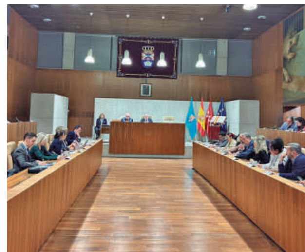
Sesión plenaria del mes de enero

GenteMadrid.es Consulte la actualidad regional y local en nuestra página web