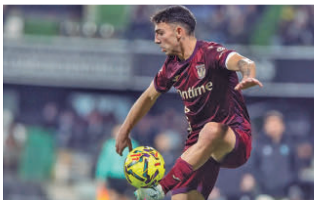
El Leganés perdió en su visita a Castellón CD LEGANÉS

el estadio de Butarque. Tras su derrota del pasado fin de semana, los pepineros ocupan la decimoquinta posición con 26 puntos, solo tres por encima del Granada, el primero de los equipos que perderían la categoría si la temporada acabase ahora mismo.