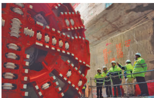
Operación de esta semana en el nuevo túnel

ca y la futura estación de Comillas. Este momento marca el encuentro de los dos frentes de excavación que avanzan desde puntos opuestos, certificando la correcta alineación, geometría y avance de la obra. “Se trata de una operación de alta precisión, que evidencia la calidad del