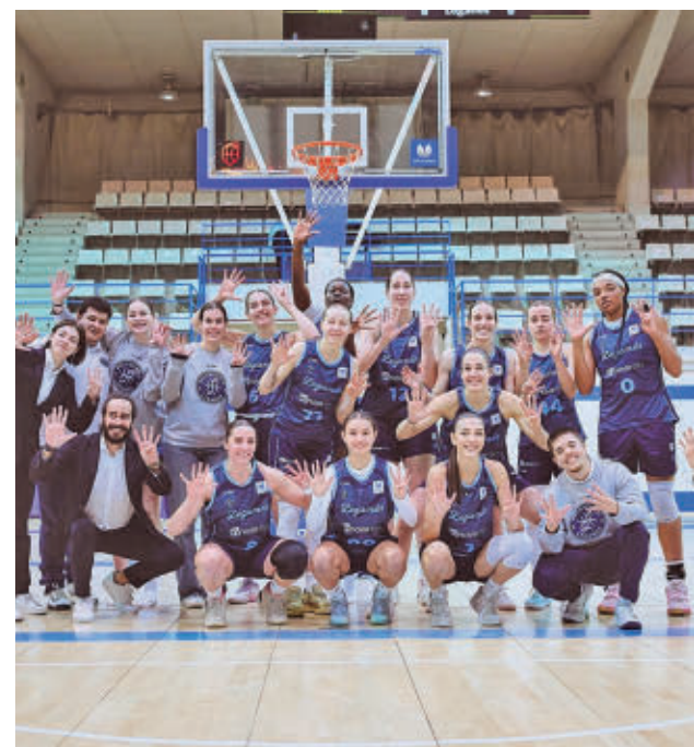
Celebración de las jugadoras pepineras

El nuevo técnico se estrenó en el cargo con un convincente triunfo en el campo del Eibar por 1-3 gracias al doblete de Nautnes y a otro tanto de Melgard, remontando el 1-0 inicial de las armeras. Este domingo el Madrid CFF tiene la oportunidad de escalar un puesto en la clasificación, ya que tiene a un solo punto al Atlético.