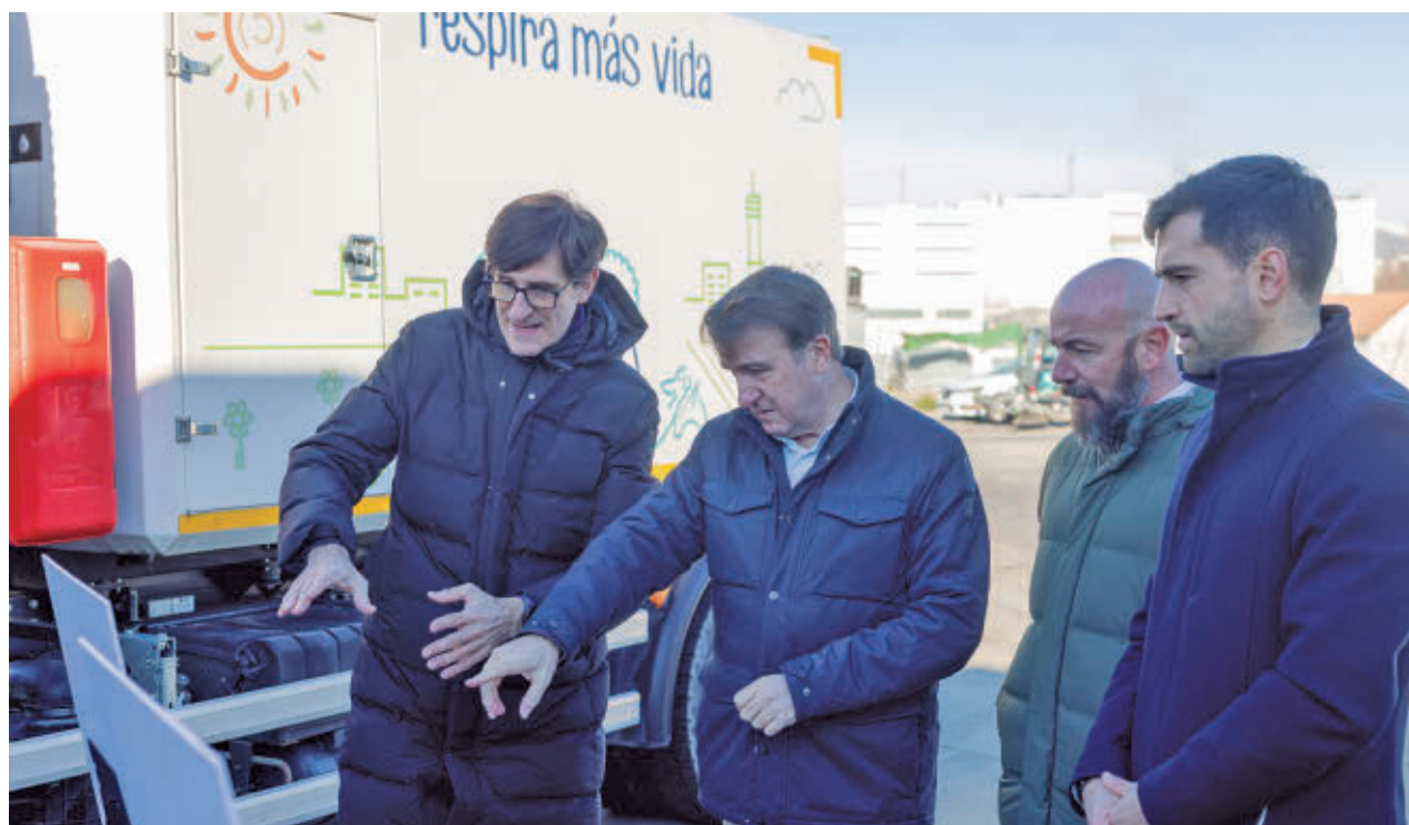
AYTO DE TRES CANTOS