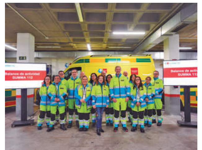
Presentación de los datos de 2025

Por su parte, las Unidades de Atención Domiciliaria (UAD) fueron requeridas en 98.235 emergencias.