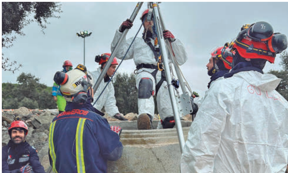
Uno de los ejercicios que se llevaron a cabo

Estas actividades forman parte del calendario anual de entrenamiento del ERICAM, especializado en el rescate en caso de grandes terremotos, como los ocurridos durante los últimos años en Lorca, Haití, Chile, Ecuador, Turquía y Marruecos, donde intervino este equipo. Dada la versatilidad de sus miembros,