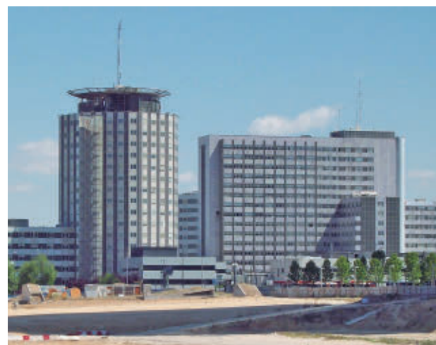
Hospital de La Paz

También se han analizado los mejores servicios clínicos del país en 40 especialidades. En este ámbito, la sanidad pú-