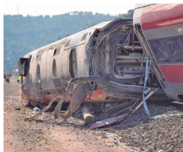
Uno de los trenes siniestrados