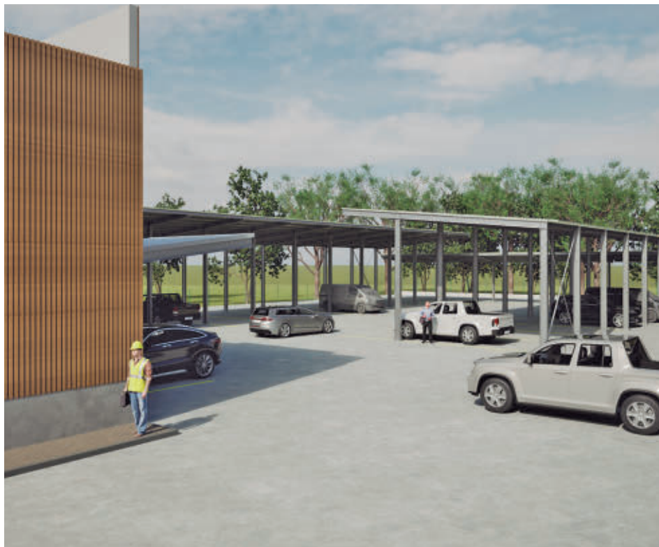
Imagen del proyecto diseñado para este espacio AYTO DE TRES CANTOS

Las obras de reforma contemplan dos actuaciones: la