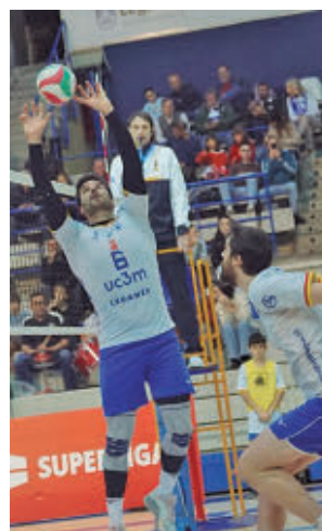
Cita a domicilio

En lo que respecta a la Liga Iberdrola, jornada de descanso para todos sus integrantes, incluyendo a un FEEL Alcobendas que continúa como colista tras caer ante el CV Sayre. El día 31 visitará al Kiele Socuéllamos.