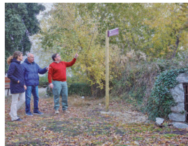
Visita institucional a uno de los caminos AYTO DE COLMENAR VIEJO

El manual fija los parámetros técnicos de la señalización y establece que la cartelería irá impresa en vinilo RFT RA1 a todo color, con resolución de 1.400 ppp, tintas ecosolventes y una lámina transparente de protección UV y antipintadas. El presupuesto total de esta actuación supera los 10.000 euros.