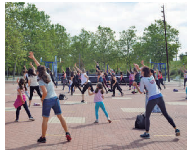
Una de las actividades llevadas a cabo

Según destacan desde el Consistorio tricantino, estas ayudas concedidas han permitido el desarrollo de un amplio abanico de actividades que generan un importante impacto social en la localidad, contribuyendo a la cohesión social, la formación, la participación ciudadana y el bienestar de la población.