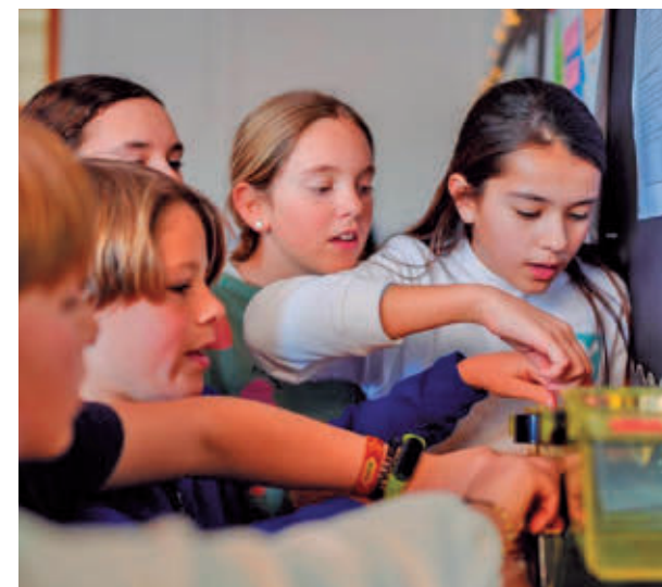
Una de las actividades el pasado curso

La Liga Minecraft está diseñada para que los estudiantes de segundo y tercer ciclo de Primaria desarrollen habilidades de informática, de investigación histórica y de reinterpretación de espacios. Los equipos irán obteniendo puntuaciones de un jurado, de manera que los grupos que más registros vayan acumulando irán pasando a las siguientes etapas del torneo.