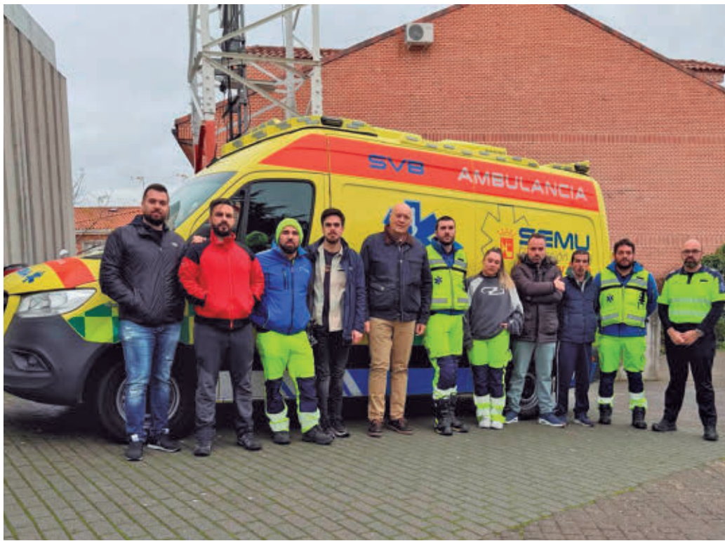
El balance de este servicio en relación al año pasado es positivo AYTO DE COLMENAR VIEJO