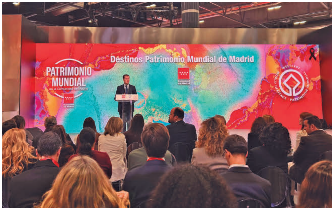
Uno de los eventos organizados esta semana en el stand de Madrid en Fitur

El consejero resaltó que, más allá de la capital, la Comunidad de Madrid ofrece tres ciudades Patrimonio de la Humanidad (Alcalá de Henares, Aranjuez y San Lorenzo de El Escorial), además de enclaves reconocidos por la Unesco, como el de Hayedo de Montejo. A ello se suman las once Villas de Madrid y una amplia red de recursos históricos, culturales y naturales distri-