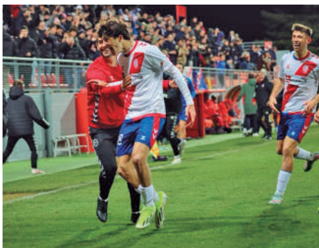
Nuevo triunfo en casa ante el Conquense

En la zona baja destaca un duelo directo entre el Siello Temple, que está dos puntos por encima del descenso, y el México FC.