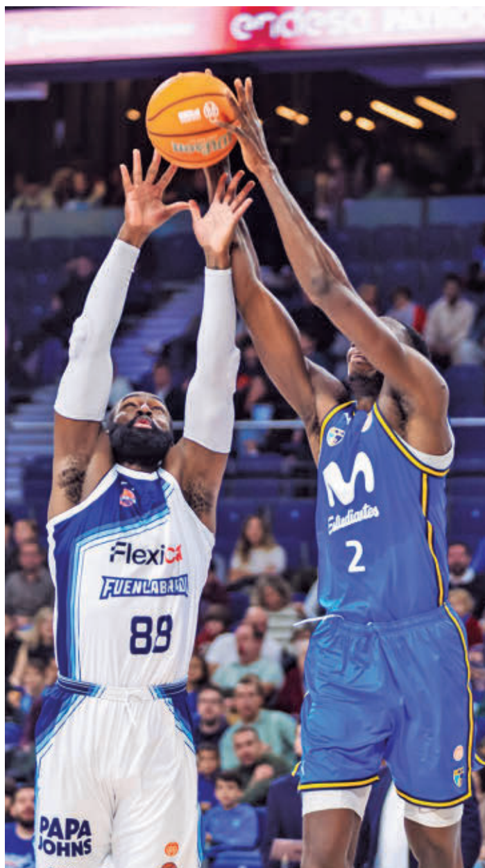
Imagen del derbi jugado este curso MOVISTAR ESTUDIANTES

La otra semifinal la protagonizan el Súper Agropal Palencia y el Flexicar Fuenlabrada (17 horas). Los locales son cuartos en Liga y vienen de imponerse precisamente al Cloud.gal Ourense Baloncesto. Por su parte, el Flexicar Fuenlabrada parece haber dejado atrás su mala racha liguera (llegaron a encadenar seis derrotas) y se ha reenganchado a la pelea por el 'play-off' de ascenso gracias a tres triunfos consecutivos, el último de ellos en la cancha