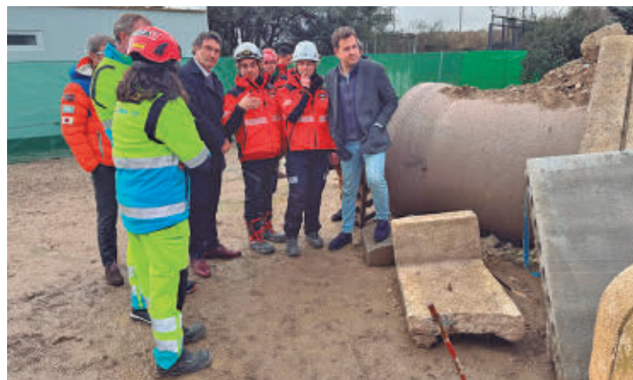
Visita de los representantes políticos

Rescue) concedida por el INSARAG (Internacional, Search and Rescue Advisory Group) de la ONU. Así, es el único cuerpo en España, junto a la Unidad Militar de Emergencias (UME), que cuenta con esta habilitación para realizar este tipo de operaciones y búsquedas.