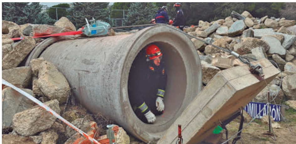
El simulacro se realizó en una explanada situada en Las Rozas