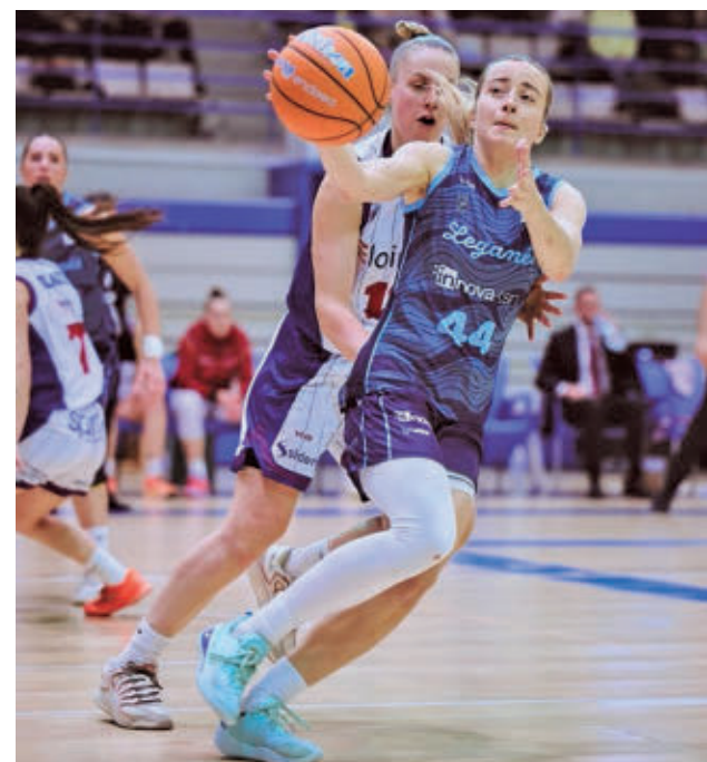
El Leganés ganó al Gernika tras una prórroga

En Liga, el Flexicar Fuenlabrada viene de encadenar tres triunfos consecutivos ante Cartagena, Zamora y Palmer Basket Mallorca.