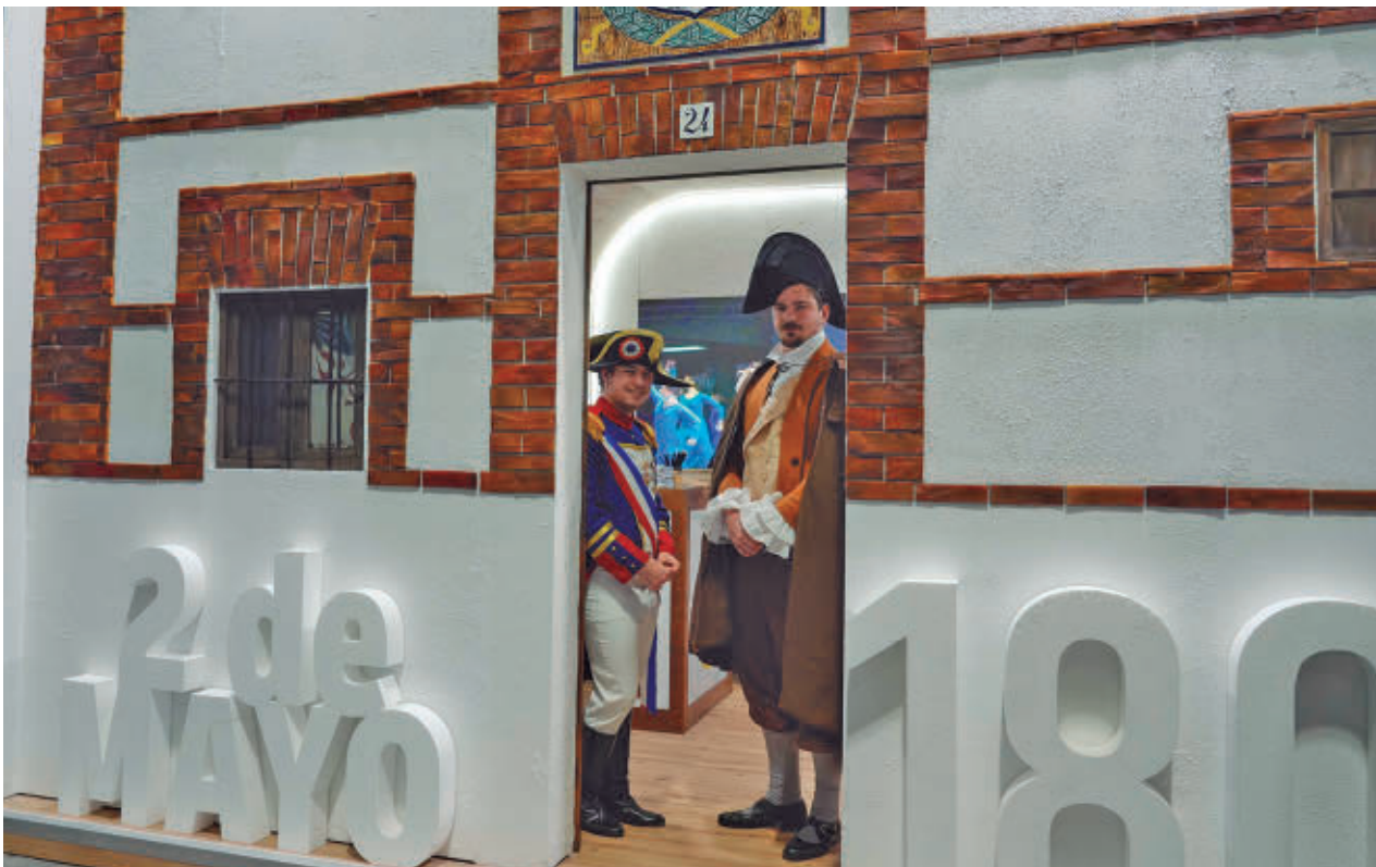
El diseño del stand puso en valor el papel de la ciudad como impulsora del levantamiento del 2 de mayo de 1808