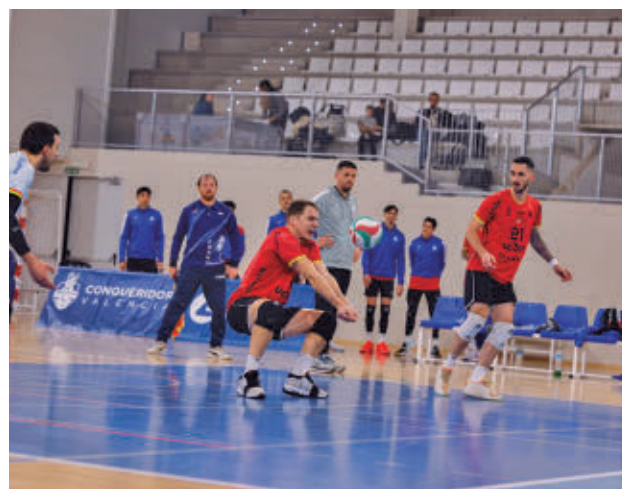
El UC3M Leganés continúa en buena dinámica

De este modo, el UC3M Leganés sigue mirando a la zona noble. Es octavo en la clasificación con 17 unidades, justo una más que su próximo rival, el Unicaja Costa de Almería. El cuadro an-