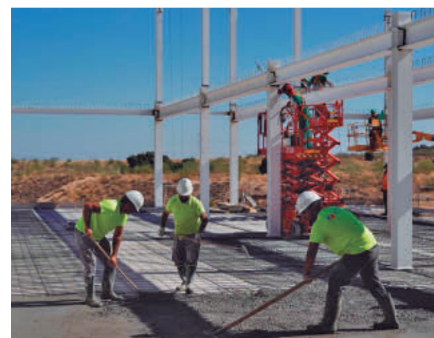
Trabajadores de la construcción en Madrid

"Tenemos una tasa de actividad que es la más alta de toda España. Esto demuestra que Madrid sigue siendo el refugio donde todas las personas vienen a encontrar un buen empleo y además un empleo estable", concluyó.