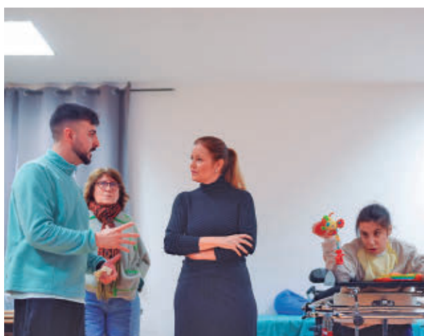
La consejera visitó el centro de la Fundación Inclusive

Dávila destacó "la atención altamente personalizada y los cuidados tan específicos que se prestan en este