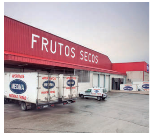
El grupo Borges es propietario de la firma desde 2025

El cierre ha afectado a cerca de un centenar de trabaja-