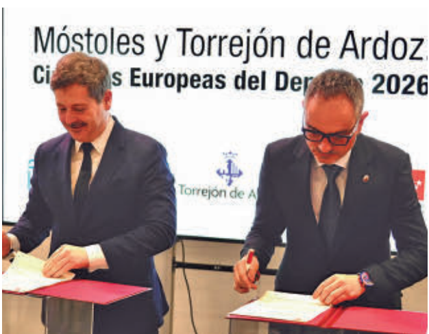
El protocolo tendrá vigencia hasta el 31 de diciembre de 2026

Desde el Ayuntamiento se ha valorado de forma positiva el volumen de trabajo desarrollado.