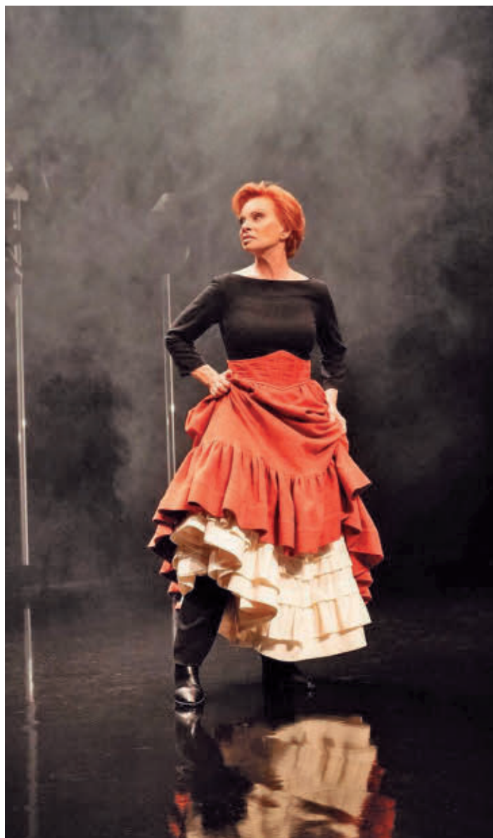
Reflexión musical sobre los ideales, la ética y el papel de la mujer

Una de las voces más emblemáticas de la música española actúa este sábado 31 a las 20 horas al Teatro del Bosque ● Es una revisión contemporánea y musical del personaje literario