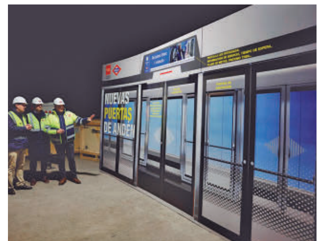
Instalación de una puerta en Legazpi

Construidas con componentes antivandálicos, serán transparentes para ofrecer una mayor sensación de amplitud, permitirán conocer cada una de las entradas a través de distintos colores y contarán con serigrafías, barras de seguridad y elementos contra atrapamientos. Las pantallas led de la parte superior reflejarán información de utilidad.