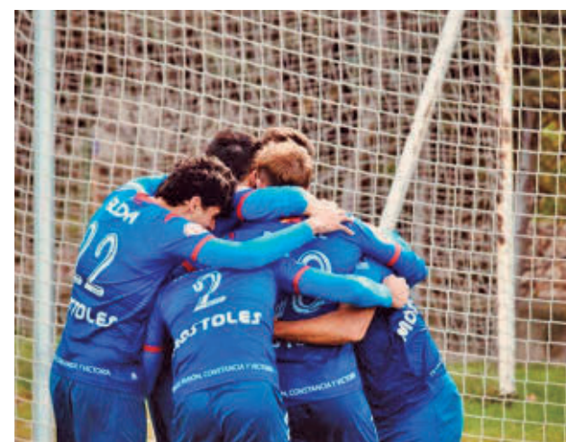
Los jugadores azulones celebran el triunfo frente al Adarve

El CD Móstoles es cuarto, empatado a 39 puntos con el CD Leganés B y a uno solo del líder, el Atlético de Madrid C, y del segundo, Las Rozas, que será su próximo rival liguero el domingo en El Soto a las 11:45 horas.