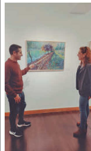
Museo de la Ciudad

ñ GenteMadrid.es Consulte la actualidad regional y local en nuestra página web