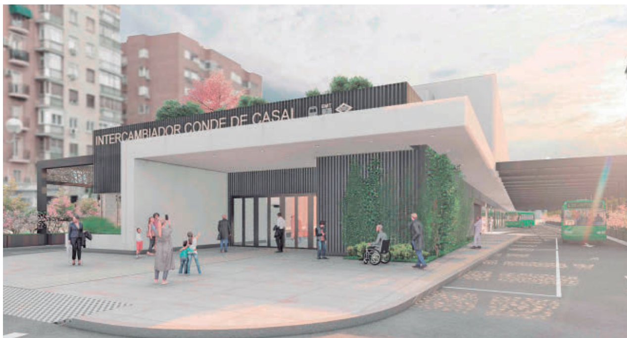
Así será el nuevo intercambiador de Conde de Casal cuando esté finalizado

Para poder contar con el abono transporte en el móvil el primer requisito es tener una Tarjeta Transporte Público Personal (TTP Personal) física y disponer de un ‘smartphone’ con sistema operativo Android 9.0 o superior. La aplicación se puede descargar en la Google Play Store y después solo hay que seguir las indicaciones. Se espera que en los próximos meses esté también disponible para móviles iPhone.