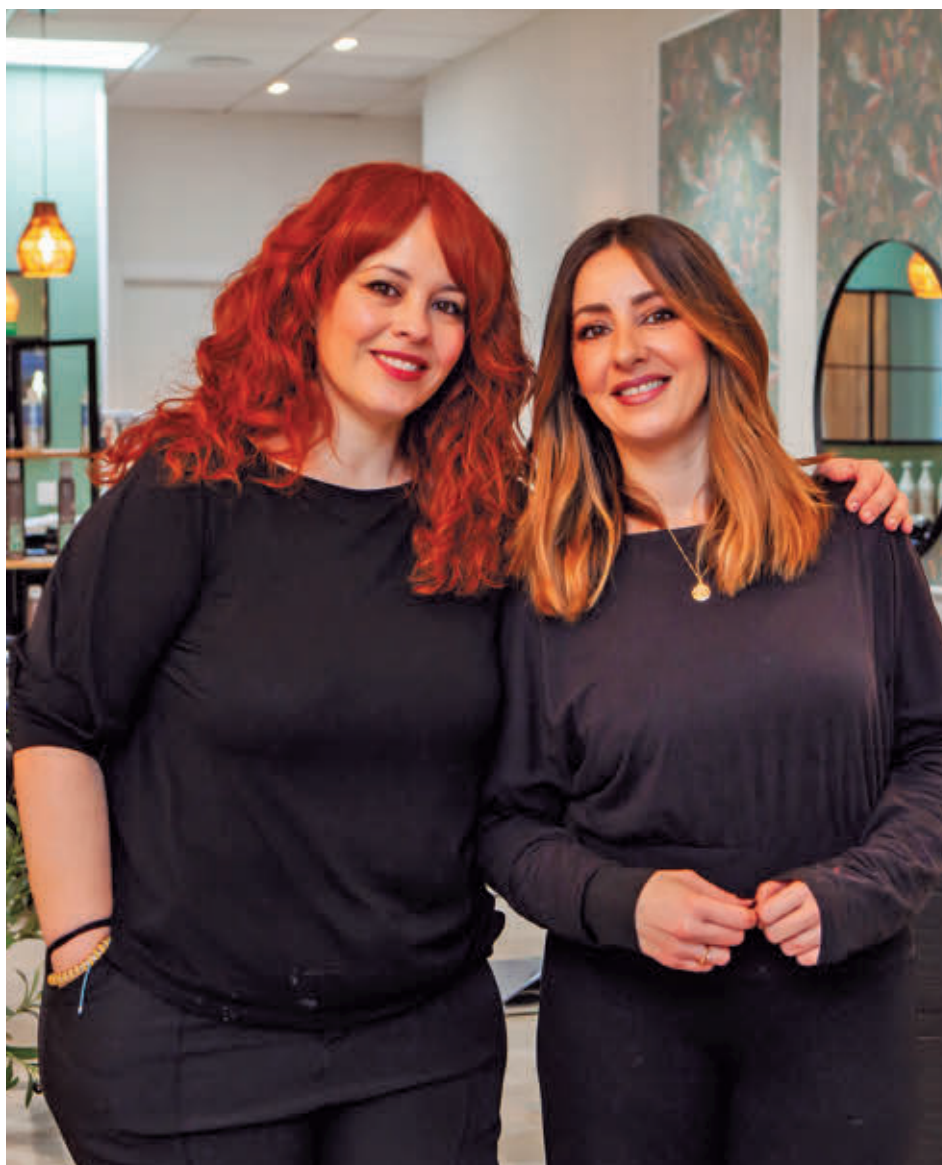
Dos de las mujeres que se beneficiaron de este programa el año pasado

La mayoría de las inserciones impulsadas por el programa en el último año se han concentrado en el sector servicios, el "principal motor" del mercado laboral español.