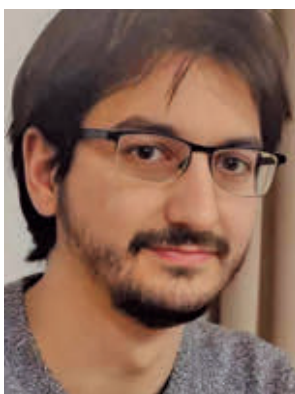
Imagen del ganador