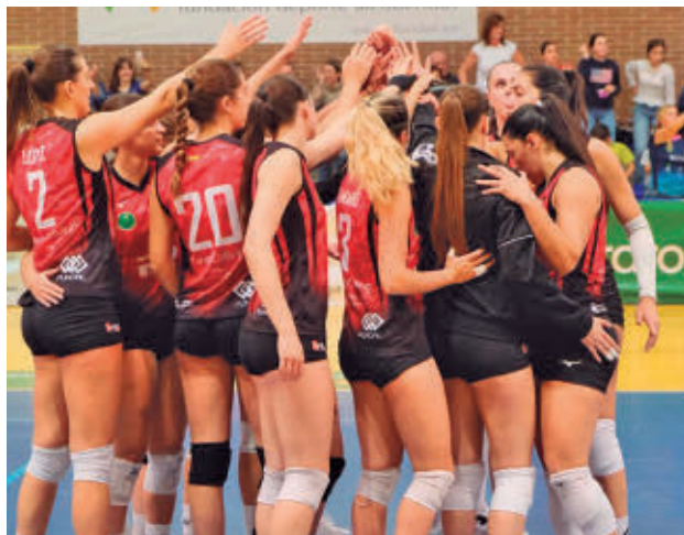
Triunfo clave ante el Socuéllamos RFEVB