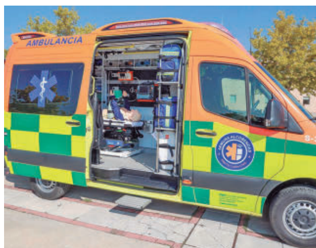
Uno de los proyectos estrella de la legislatura

Desde su puesta en marcha, se han gestionado 3.113 avisos, de los que 2.515 han requerido asistencia sanitaria. El tiempo medio de respuesta se ha situado en los seis minutos y medio. El Gobierno local destaca que este tiempo de respuesta es hasta tres minutos menos que otros servicios municipales de urgencia similares y que avala este recurso.