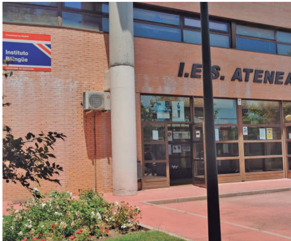
Instalaciones del IES Atenea de San Sebastián de los Reyes

EL AÑO PASADO ANIMÓ A LOS ALUMNOS A CONSIDERAR LA VÍA DE LA CIENCIA