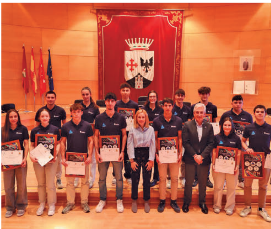
Los premiados, junto a la alcaldesa y el concejal de Deportes