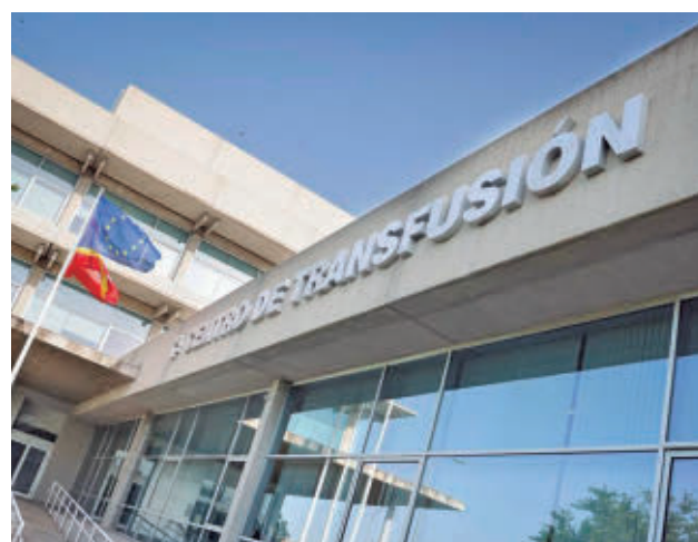
Centro de Transfusión de la Comunidad de Madrid

las". De aquí se recogerán muestras que representarán a casi el 64% de la población madrileña, aunque por el momento no se ha detallado cuáles serán estas EDAR. A medida que avance el proyecto, y en función de las necesidades y los propios resultados, la Comunidad de Madrid podría cambiar las depurado-