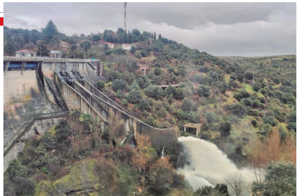
El desembalse se realiza para evitar crecidas e inundaciones

Además, el Cuerpo de Agentes Forestales de la Comunidad de Madrid mantiene durante estos días una vigilancia constante del caudal de ríos y arroyos, especialmente en el entorno del río Alberche y en municipios