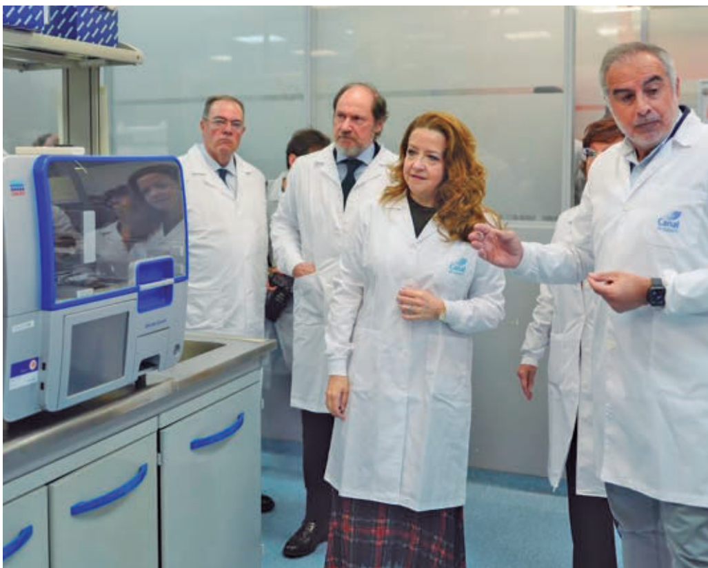
Fátima Maute visitó el Laboratorio de Aguas Depuradas del Canal de Isabel II

El proyecto se llevará a cabo en varias estaciones depuradoras para "reforzar la salud de los madrileños" • Permitirá realizar una "radiografía científica" que servirá para "adoptar medidas concretas" contra el consumo de sustancias