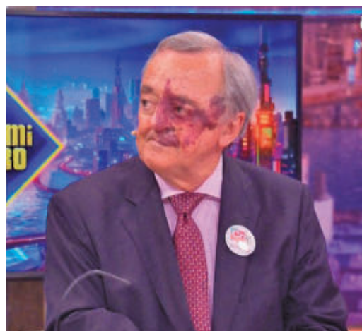
El científico Mariano Barbacid

EL PERIÓDICO GENTE NO SE RESPONSABILIZA NI SE IDENTIFICA CON LAS OPINIONES QUE SUS LECTORES Y COLABORADORES EXPONGAN EN SUS CARTAS Y ARTÍCULOS