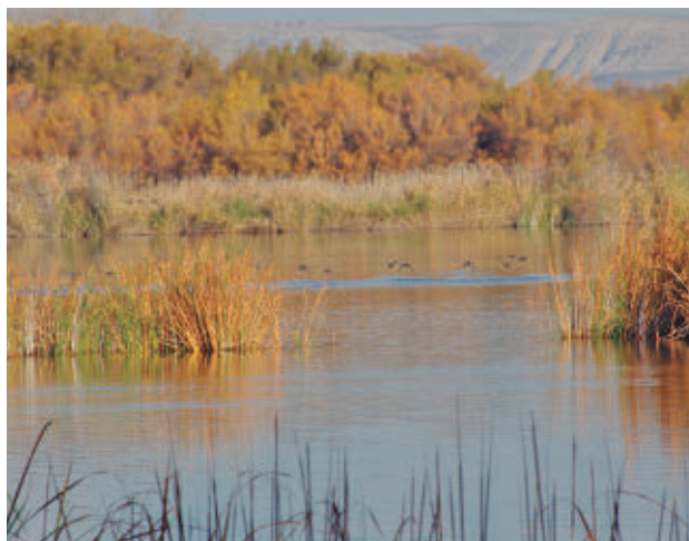
Uno de los humedales de la Comunidad de Madrid

los ecosistemas autóctonos. Para estos trabajos, que comenzarán el próximo 1 de abril, el Ejecutivo autonómico va a destinar 5,6 millones de euros, con los que se van a rehabilitar, entre otras, la laguna de Soto de las Juntas en Rivas-Vaciamadrid, las de Belvis en Paracuellos de Jarama, la laguna de San Juan en