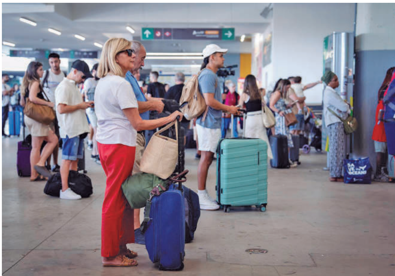
Viajeros en el aeropuerto Adolfo Suárez-Madrid Barajas.

Rutas directas Son las que tiene la región con Estados Unidos