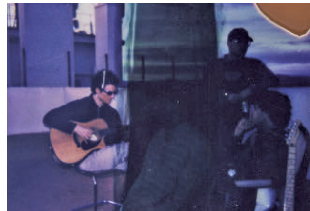
El álbum fue grabado durante quince días intensos en 2024

La banda valenciana presenta este sábado 7 de febrero su segundo álbum, ‘Vida y milagros’, donde habla de algunos cambios vitales en primera persona • El concierto tendrá lugar en la Sala El Sol en Inverfest