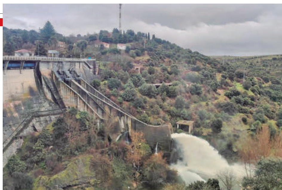
El desembalse se realiza para evitar crecidas e inundaciones

Además, el Cuerpo de Agentes Forestales de la Comunidad de Madrid mantiene durante estos días una vigilancia constante del caudal de ríos y arroyos, especialmente en el entorno del río Alberche y en municipios