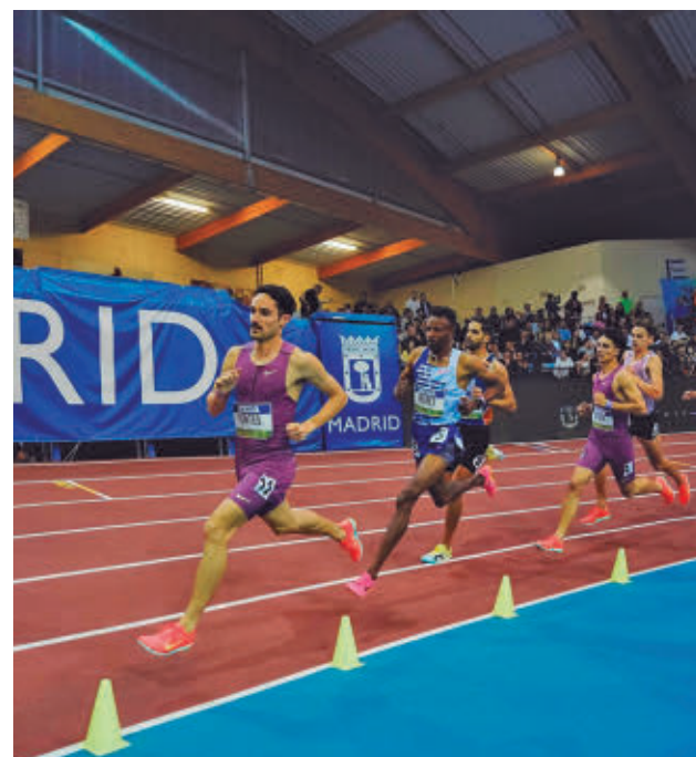
Imagen de la pasada edición RFEA

Por su parte, el Flexicar Fuenlabrada se ha metido de lleno en la carrera por la fase de ascenso tras encadenar cinco triunfos, los dos últimos ante el mismo rival. El pasado sábado 30 asaltaba la cancha del Ourense por 69-72 y, apenas cuatro días después, repetía triunfo ante el cuadro gallego, esta vez en el Fernando Martín, en un choque correspondiente a la jornada 11 que fue aplazado en su día.