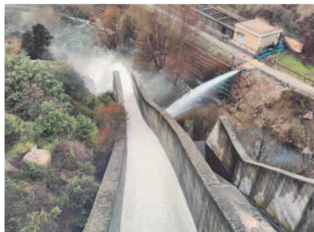
Los embalses de la región están en niveles muy altos

como Villamanta, Villamanilla, Aldea del Fresno y Villa del Prado, así como en el río Tajuña a su paso por Morata de Tajuña.