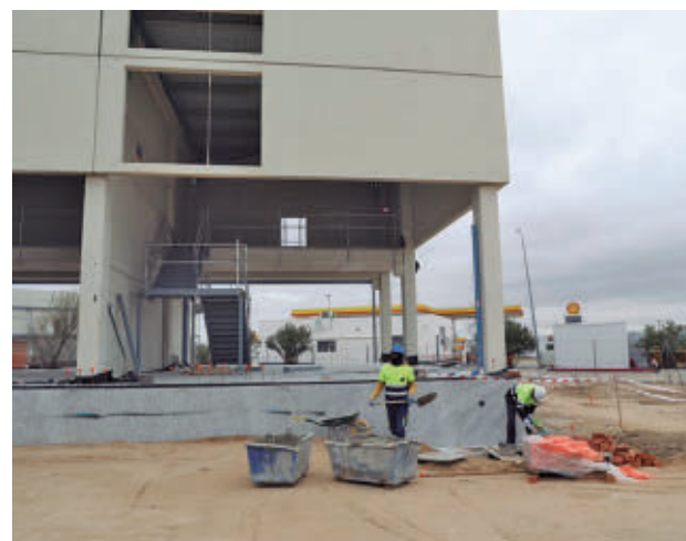
El desempleo descendió en la construcción un 9,2%

Por sectores, el desempleo disminuyó en términos interanuales un 9,2% en la construcción, un 2,7% en la industria y un 1% en los servicios. Esta caída se mantiene, en re-