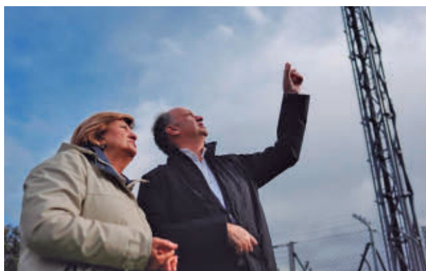
El consejero visitó una de las antenas

Este canal de ayuda funciona a través del teléfono gratuito 91 030 82 27, al que