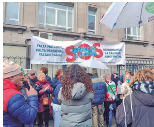
Un momento de la concentración de protesta