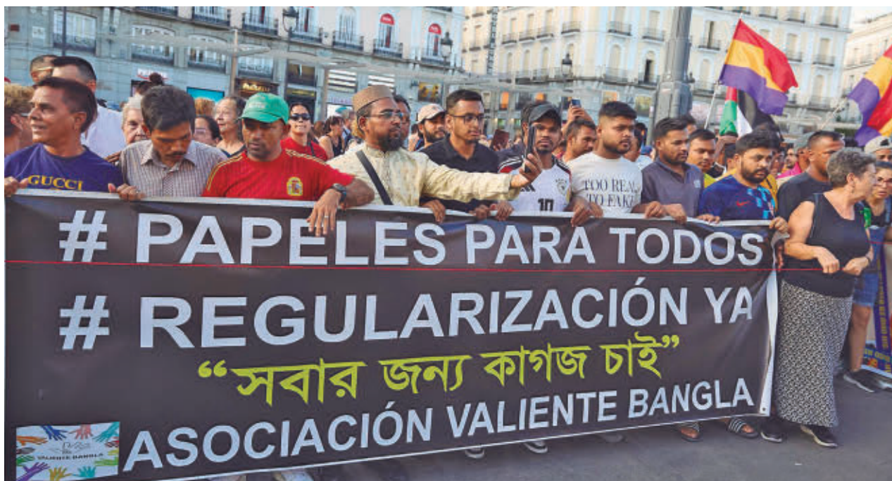
Foto de archivo de una protesta en favor de la regularización de inmigrantes

Contaba con el apoyo de un facilitador judicial, otra figura en la que la Comunidad de Madrid es pionera. La víctima estaba "muy nerviosa, con mucho miedo, así que desde la OAVD se propuso al juez este servicio. Aceptó y entró en la sala con Eika", han explicado. La mujer ha podido declarar y se ha ido "muy agradecida por el apoyo y la ayuda prestados". La Comunidad cuenta con 147 perros de este tipo.