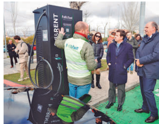
Nuevo cargador ultrarrápido

Lo más novedoso es que el equipo de energía eléctrica no necesita obra civil, sino que se alimenta del lugar donde se instale sin necesidad de tener que aumentar la potencia contratada. Además, esta tecnología puede llegar a entornos con limitaciones de acceso a fuentes de abastecimiento.