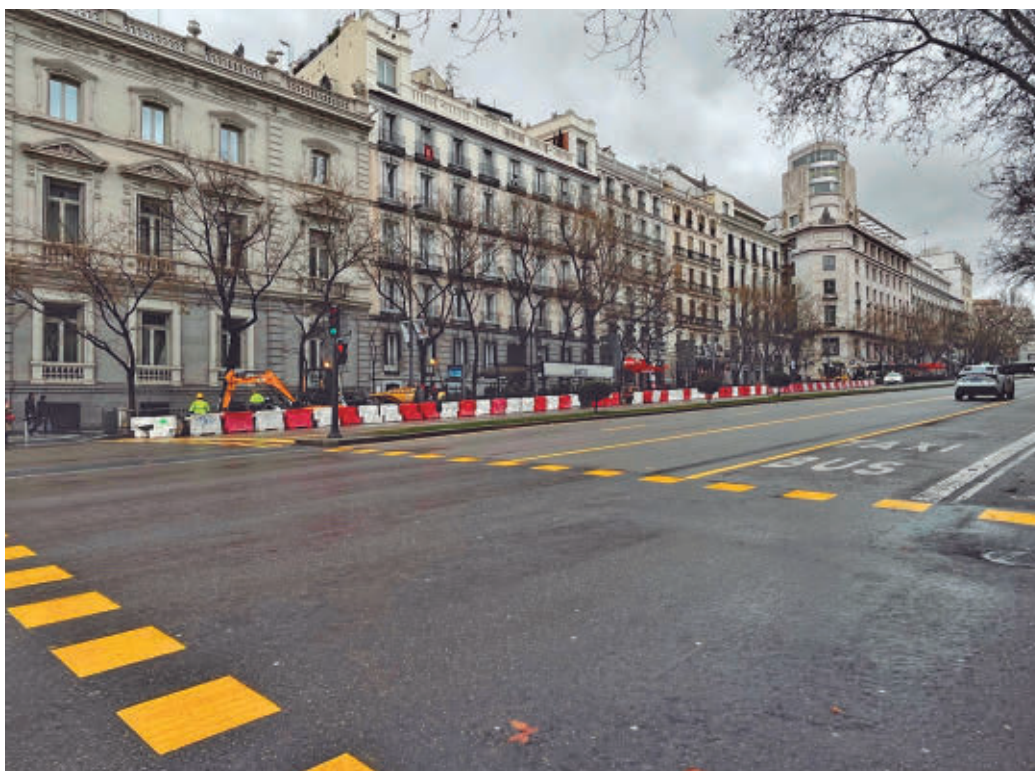
Madriños y visitantes podrán acceder a pie a la Puerta del Alcalá