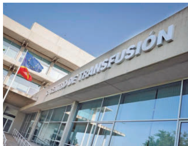
Centro de Transfusión de la Comunidad de Madrid

las". De aquí se recogerán muestras que representarán a casi el 64% de la población madrileña, aunque por el momento no se ha detallado cuáles serán estas EDAR. A medida que avance el proyecto, y en función de las necesidades y los propios resultados, la Comunidad de Madrid podría cambiar las depurado-