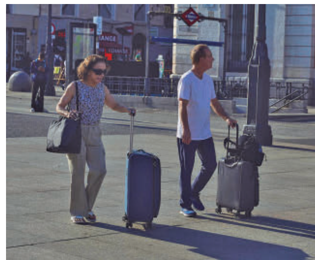
Turistas en el centro de Madrid