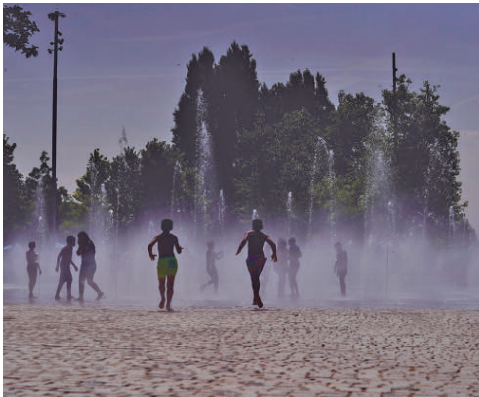
Varios niños jugando en el entorno de Madrid Río

Además, los encuestados restan relevancia a la contaminación, que aparecía siempre como una cuestión que les quitaba el sueño y a los problemas de limpieza, que bajaron en su orden de preferencias del 16,4% al 15,3%.