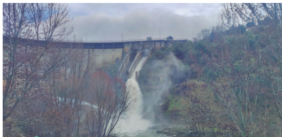
Una de las presas que está soltando agua esta semana en la región