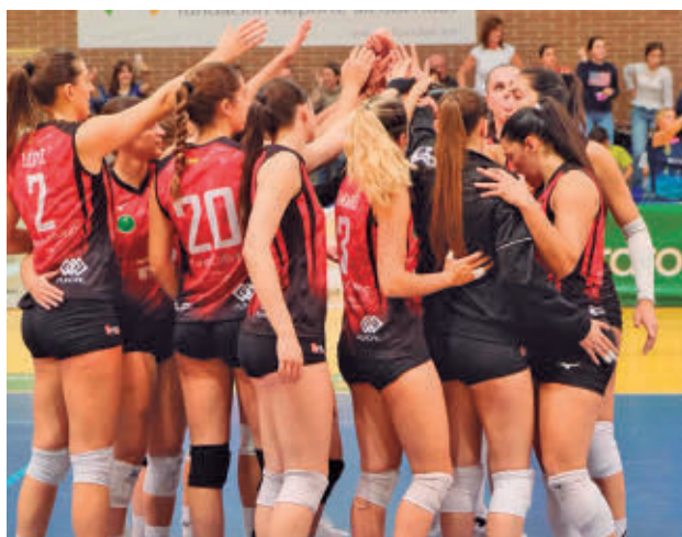
Triunfo clave ante el Socuéllamos RFEVB