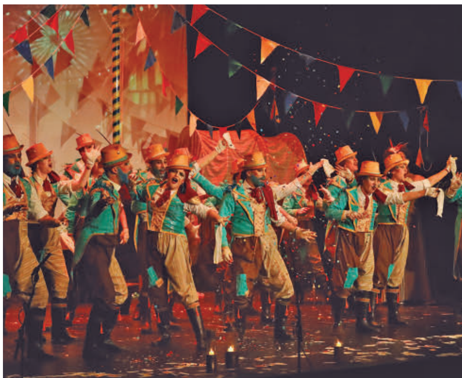
Como novedad, este año se celebrará el Gran Festival de Chirigotas y Comparsas

Ese mismo día se celebrará también la Fiesta Cocoloco Family Carnival y el Pregón de Carnaval, que en esta edición