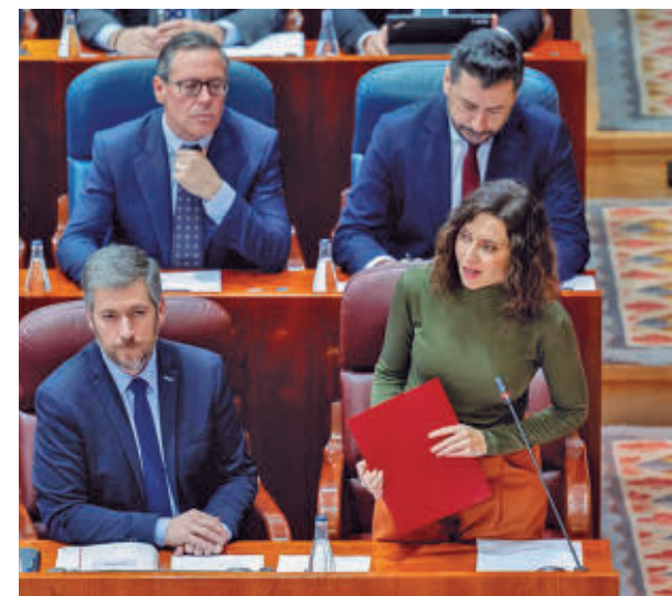
Ayuso, durante su intervención en la Asamblea