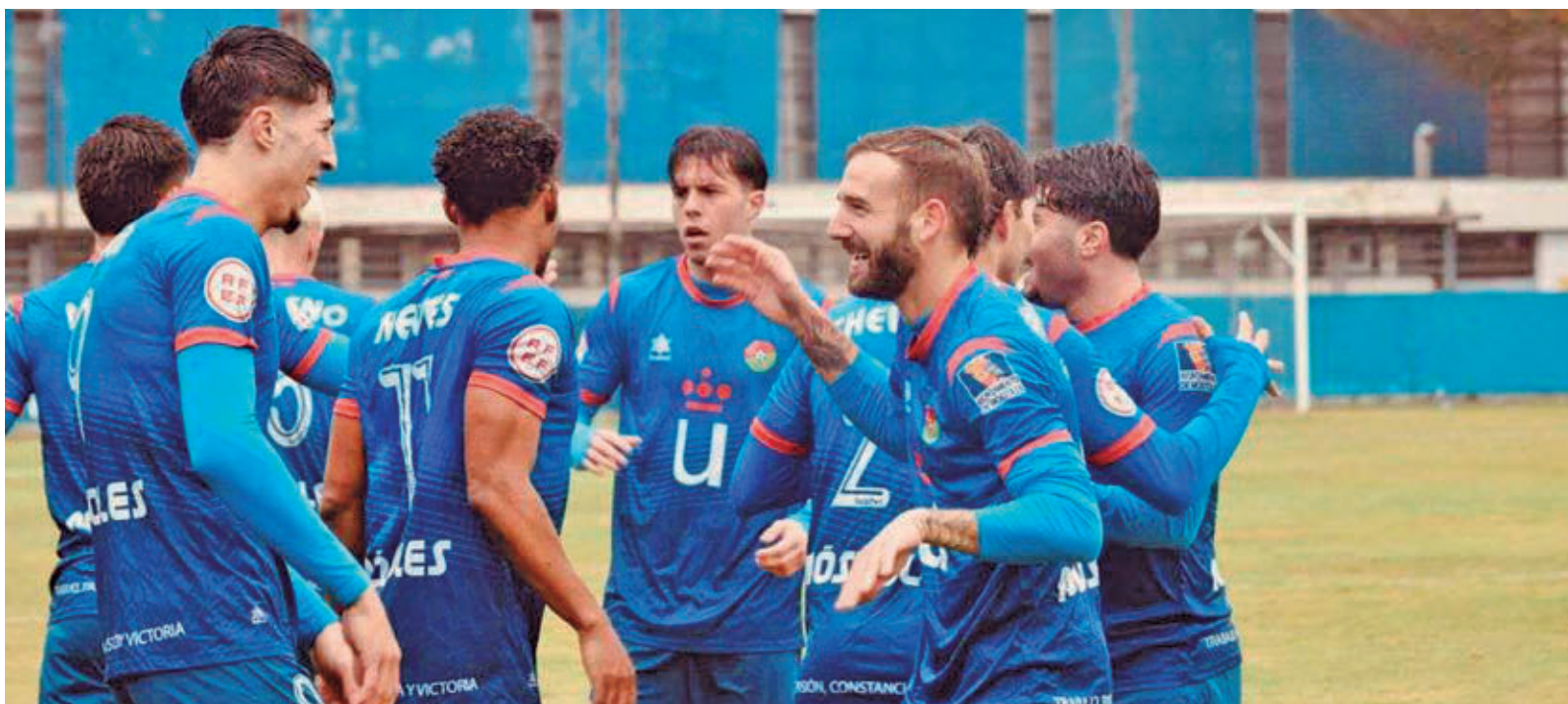
Los jugadores del CD Móstoles celebran el triunfo ante Las Rozas CF