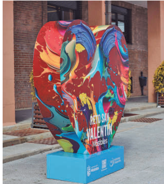
Línea de ayudas de Móstoles Desarrollo para sufragar gastos

La iniciativa incluye un concurso de decoración de escaparates con dos categorías: 'MeGustaSanValentinMD', destinada a propuestas tradicionales vinculadas a esta