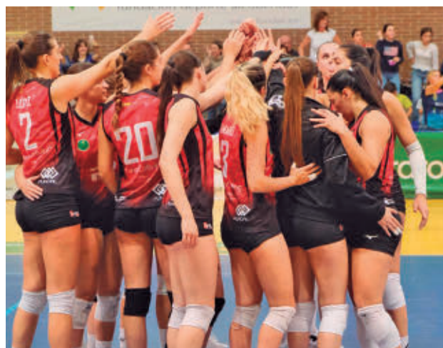
Triunfo clave ante el Socuéllamos RFEVB