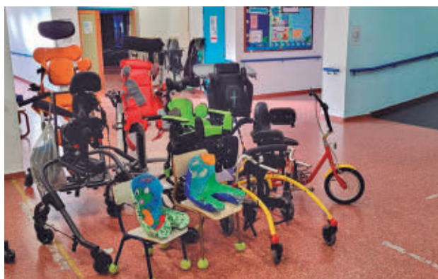
El plazo de inscripción estará abierto hasta el 22 de febrero

El programa estará dirigido a familias con menores de entre 4 y 17 años con discapacidad física, intelectual o del