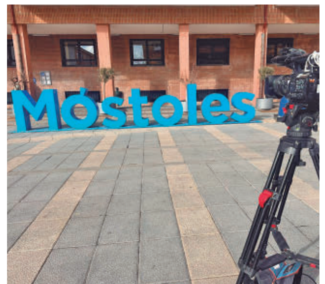
Móstoles refuerza sus canales de comunicación digital

Desde el Ayuntamiento han precisado que se trata de un canal unidireccional, concebido exclusivamente para la