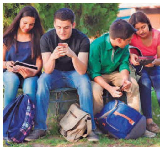
El uso de las redes sociales por menores, a debate

EL PERIÓDICO GENTE NO SE RESPONSABILIZA NI SE IDENTIFICA CON LAS OPINIONES QUE SUS LECTORES Y COLABORADORES EXPONGAN EN SUS CARTAS Y ARTÍCULOS