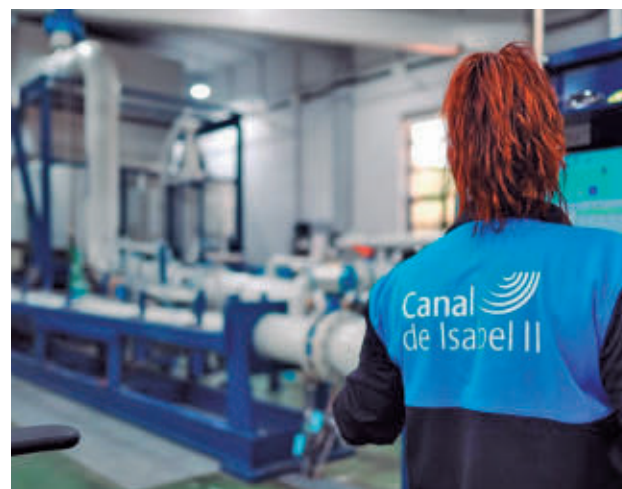
Trabajadora del Canal de Isabel II

Las acciones contemplan la rehabilitación y adecuación de filtros, la ampliación y