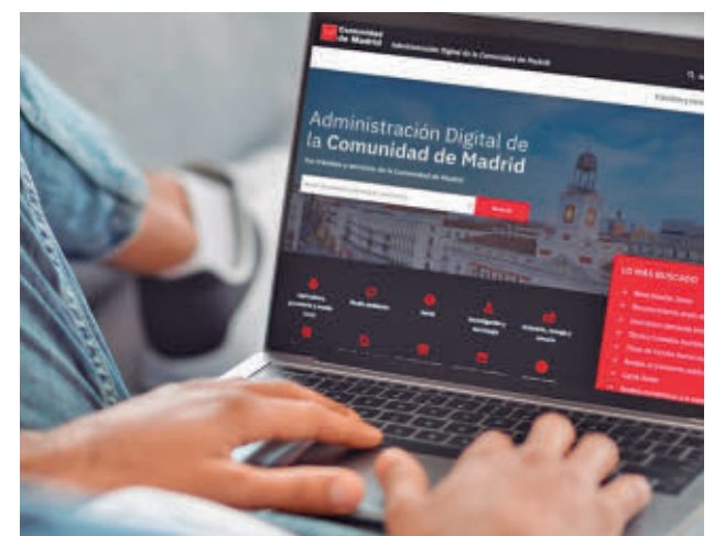
Página web de la Comunidad de Madrid

acuerdo con la normativa europea, para garantizar un uso fiable de esta tecnología, siempre con supervisión humana, "por lo que no va a suponer la eliminación de ningún puesto de trabajo", según explicaron los responsables del texto. Para ello, incorporará medidas que garanticen la transparencia de los algoritmos, la defensa de información personal y el control ético de los sistemas automatizados.