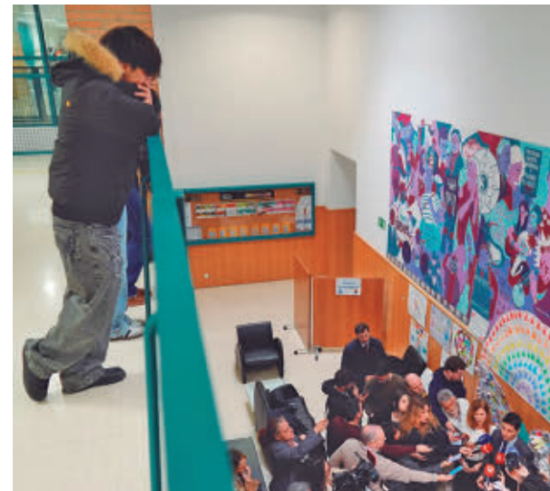
Un joven observa la presentación

El Hospital Gregorio Marañón cuenta con la única unidad pública en España dedicada a las personas que muestran comportamientos adictivos en relación con el juego de apuestas, videojuegos, sexo, compras compulsivas y redes sociales.