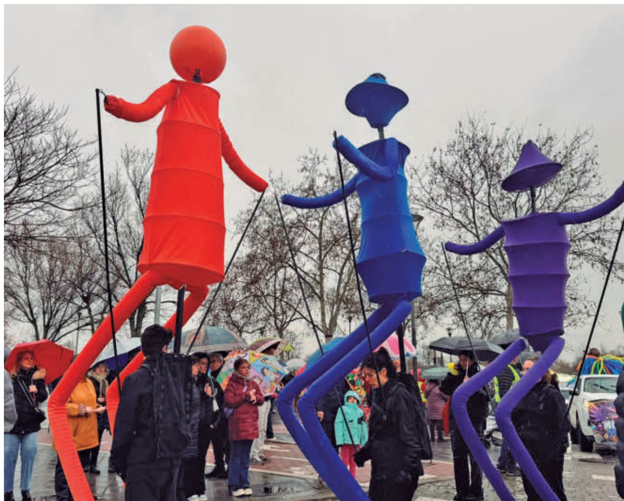
AYTO DE ALCORCÓN