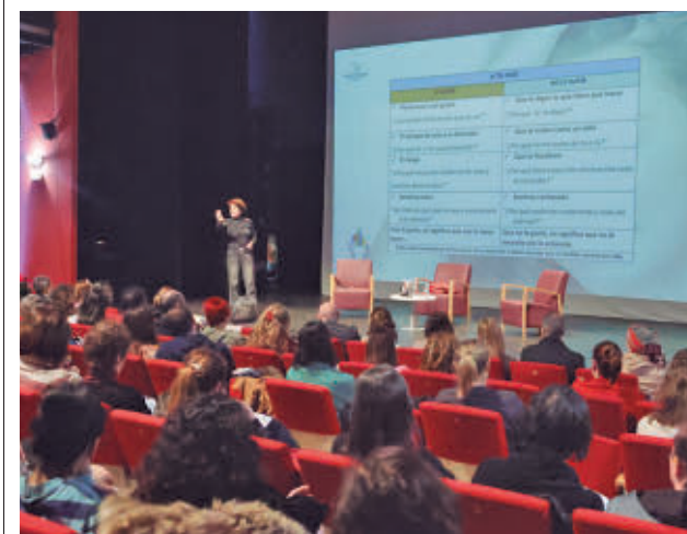
Un momento de la sesión

La Concejalía de Salud Pública, Consumo y Bienestar Animal del Ayuntamiento de Alcorcón ha puesto en marcha una campaña municipal para fomentar un uso saludable de las pantallas en la infancia y la adolescencia, coincidiendo con la celebración del Día de Internet Seguro. La iniciativa se articula a través de varios carteles informativos que se colocarán en espacios visibles de la ciudad y se difundirán también a través de las redes sociales municipales. En ellos se advierte de que, entre los 0 y los 6 años, es necesario limitar el uso de pantallas, ya que los menores “desconectan de la realidad” y “reemplazan el contacto humano”. Igualmente se recuerda que no deben utilizarse como ‘chupete digital’ para calmar llantos, evitar el aburrimiento o tranquilizar.