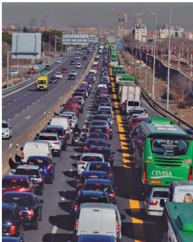
Uno de los tramos de la A-5

El recrecido del firme alcanzará los 3 centímetros en el tronco principal y en las vías