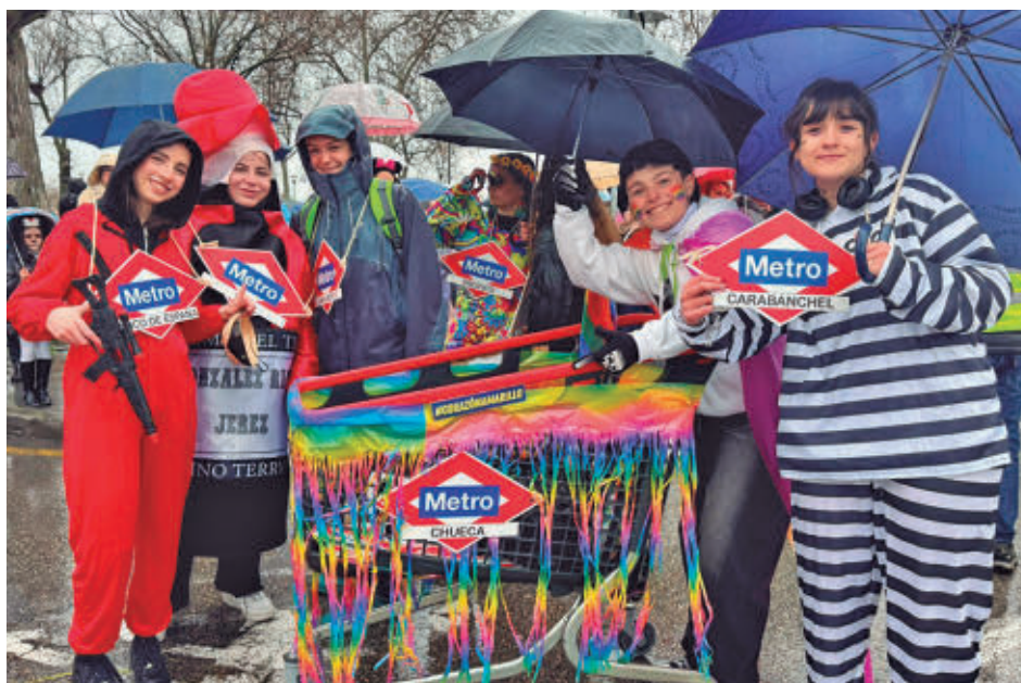
El Gran Desfile de Carnaval recorre varias de las principales calles este sábado AYO DE ALCORCÓN

Centro del Títere, con grandes máscaras inspiradas en el universo creativo de Pablo Picasso. El recorrido cuenta con la batucada Samba da Rúa y el pasacalle steampunk de Circódromo, con diez artistas circenses, entre zancudos, acróbatas, malabaristas y diversas estructuras aéreas, que darán forma a un universo visual basado en tecnologías anacrónicas y futuristas, fusionando circo, teatro visual y artes de calle. Tras la entre-