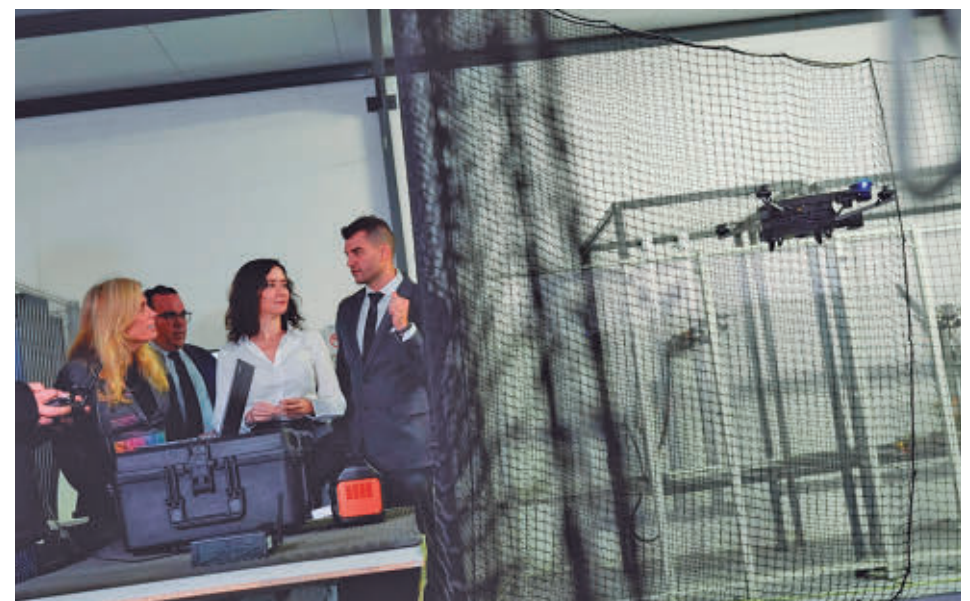
Díaz Ayuso acudió a una empresa situada en Boadilla del Monte