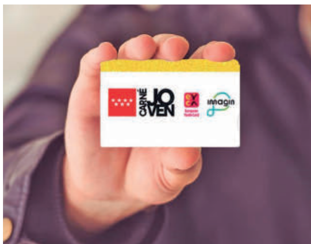
Carné Joven de la Comunidad de Madrid

El único requisito para obtenerlo es tener la edad establecida y ser residente en la región. Puede solicitarse a través de la página web de la Comunidad de Madrid.