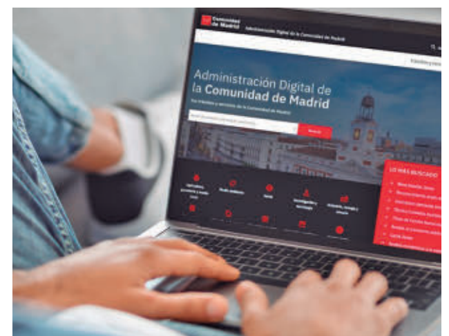
Página web de la Comunidad de Madrid

acuerdo con la normativa europea, para garantizar un uso fiable de esta tecnología, siempre con supervisión humana, "por lo que no va a suponer la eliminación de ningún puesto de trabajo", según explicaron los responsables del texto. Para ello, incorporará medidas que garanticen la transparencia de los algoritmos, la defensa de información personal y el control ético de los sistemas automatizados.