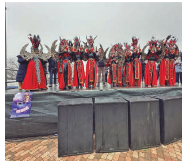
Carnaval de La Fortuna

A las 18.30 horas se saldrá de la Plaza de La Fortuna y se realizará un recorrido hasta la explanada situada junto al Polideportivo de La Fortuna, donde a las 19:10 horas se quemarán las sardinas y se lanzará un castillo de fuegos artificiales como colofón a los festejos.