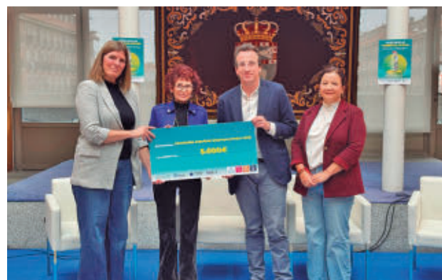
Entrega del cheque a la asociación

do casi 10.000 kilos de envases de plástico, latas y briks solo en el barrio de Leganés Norte. En este caso también tenía un fin solidario y Ecoembes ha donado 5.000 euros a la Asociación Española Síndrome Prader-Willi, afincada en Leganés y que forma parte de la Federación