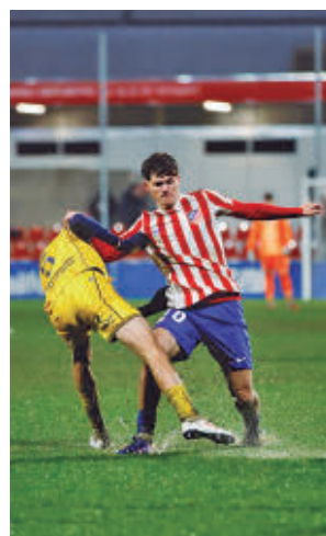
Imagen del derbi

En lo que respecta al Grupo 1, el Castilla abre la jornada este viernes en casa ante el Athletic B. Los blancos son octavos en la clasificación.