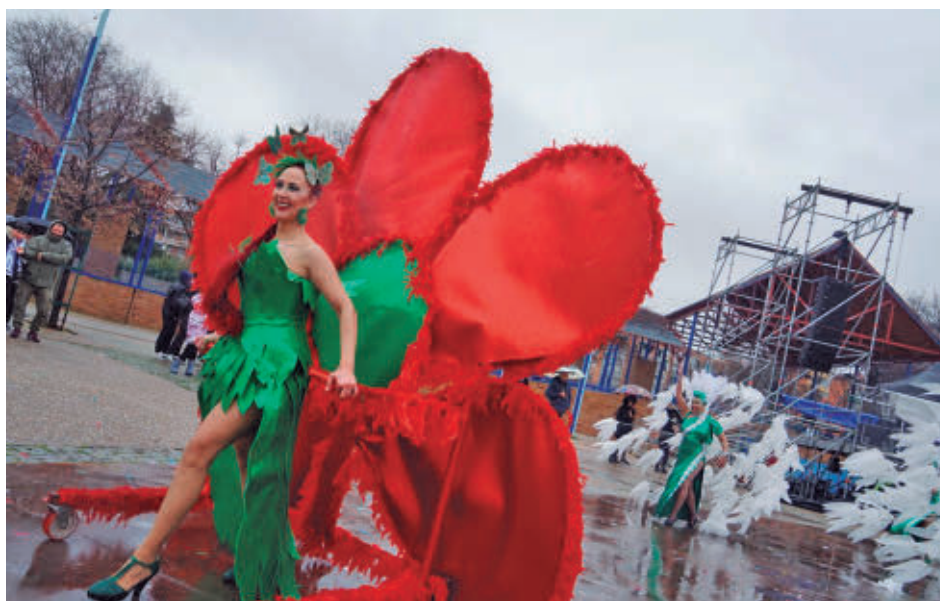
Gran Desfile de Carnaval del pasado año

lugar, actuará el mítico grupo de pop de finales de los años 80 Un Pingüino en mi Ascensor para poner fin a la fiesta desde las 20 horas.