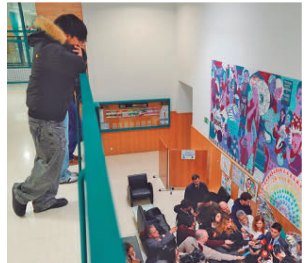
Un joven observa la presentación

El Hospital Gregorio Marañón cuenta con la única unidad pública en España dedicada a las personas que muestran comportamientos adictivos en relación con el juego de apuestas, videojuegos, sexo, compras compulsivas y redes sociales.