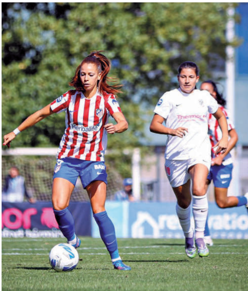
El duelo de la primera vuelta se cerró con empate (1-1) ATLÉTICO DE MADRID

En el caso del Madrid CFF, el cambio de entrenador no ha supuesto, por el momento, un revulsivo en cuanto a los resultados. El triunfo del pasado 17 de enero en el