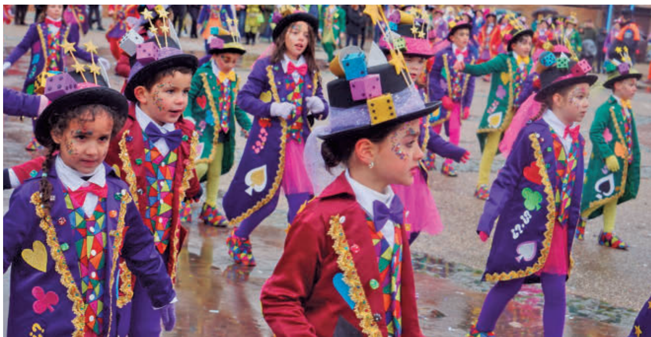
Los disfraces regresarán a las calles de Leganés

El desfile contará con un total de 45 entidades reparti-