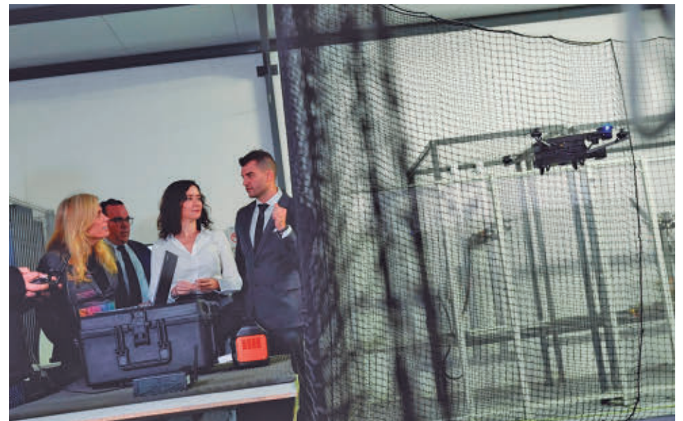
Díaz Ayuso acudió a una empresa situada en Boadilla del Monte

tal de Seguridad Aérea sitúa en Madrid al 30% de las organizaciones aprobadas para formar a pilotos y profesionales de drones.