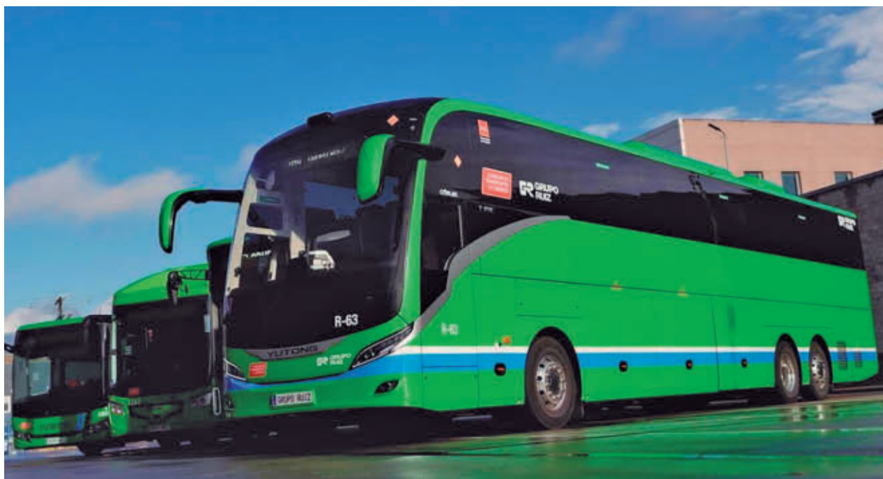
Autobuses interurbanos de la Comunidad de Madrid

En diciembre, el número de viajeros que optó por los autobuses de la EMT para desplazarse en la capital subieron un 5,5% y los que se decantaron por el Metro crecieron un 1,6% de media el pasado mes de diciembre con respecto al mismo mes del año anterior. Los autobuses de la EMT en la capital registraron un total de 42,14 millones de pasajeros en el mes de diciembre. En Metro de Madrid, casi 64,07 millones de pasajeros pasaron por el suburbano en diciembre.