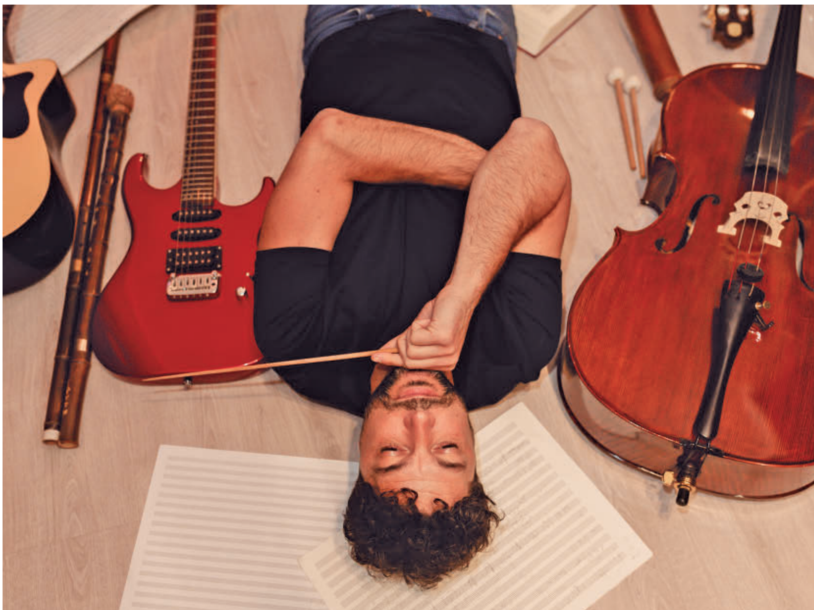
El compositor madrileño recibió anteriormente otras dos nominaciones por sus trabajos en 'En las estrellas' y 'Las niñas de cristal'