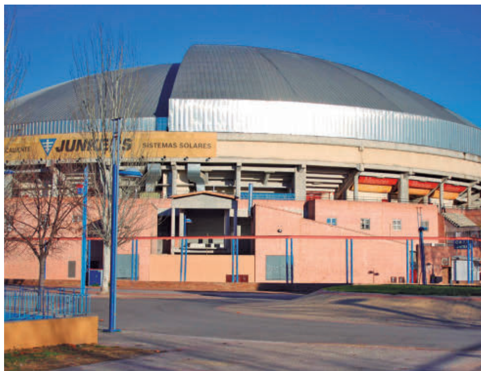
Plaza de toros La Cubierta de Leganés

Consulte la actualidad regional y local en nuestra página web