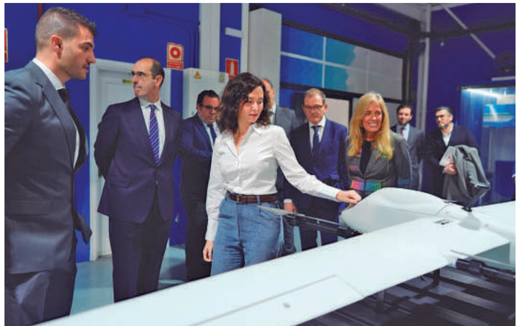
Presentación de la estrategia sobre drones de la Comunidad de Madrid

ser el epicentro nacional de la formación aeronáutica no tripulada, con enseñanzas especializadas basadas en la demanda real de las empresas, en materias como pilotaje, mecánica, datos e Inteligencia Artificial. La Agencia Esta-