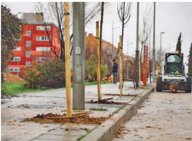
La plantación cuenta con una inversión de 165.000 euros