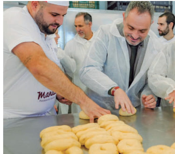
Segunda edición del certamen ‘Mi Mejor Receta’ hasta el 30 de abril

La Concejalía de Contratación, Mayores y Bienestar Social ha puesto en marcha la segunda edición del certamen gastronómico ‘Mi Mejor Receta’, una iniciativa abierta a los vecinos del municipio con el objetivo de fomentar la participación ciudadana, poner en valor la cocina tradicional y fortalecer los vínculos sociales. El concurso girará en torno a la temática de los días