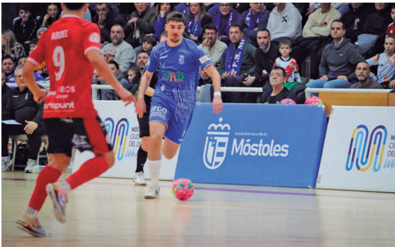
Los mostoleños se mantienen dentro de los puestos que dan derecho a jugar el 'play-off' de ascenso a Primera División