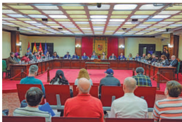
La oposición fuerza un pleno para que el alcalde declare

En esa sesión, las formaciones opositoras volverán a reclamar la dimi-