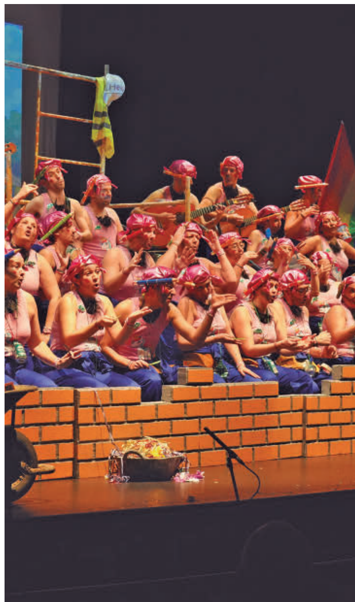
Los peñeros en el XXVII Concurso de Agrupaciones Carnavalescas

El jurado otorgó el primer premio a 'Por aquí andamios otro año' • El segundo premio fue a Los Justos con 'Este año... te la clavo' y el tercer premio a La Era con 'Los que hacen la calle'