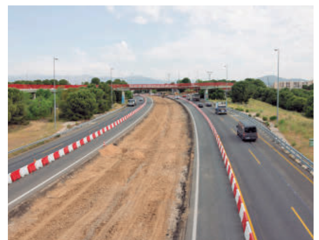
La carretera M-607, durante las obras