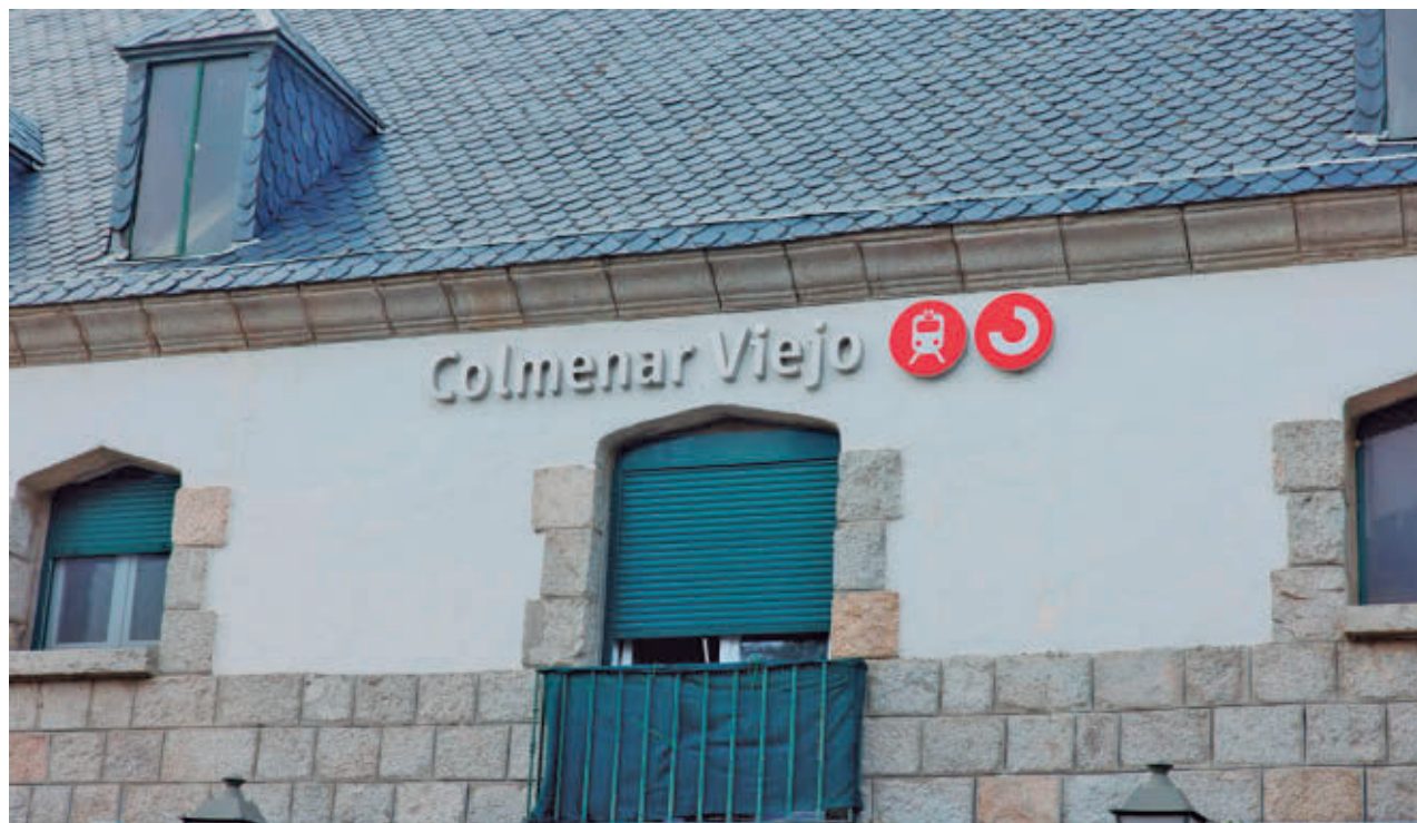
AYTO DE COLMENAR VIEJO