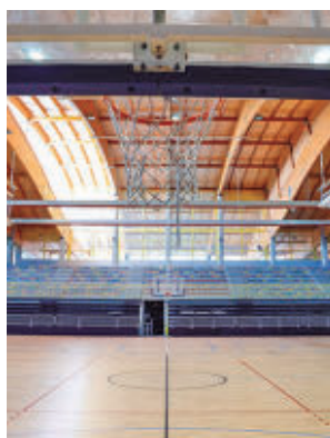
Pabellón del J. A. Samaranch

Así, la asociación ha señalado que desde hace tiempo padres y madres de deportistas vienen denunciando la “grave situación” que atraviesan las instalaciones de la Ciudad Deportiva, que han