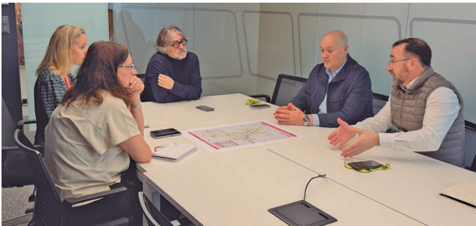
Un momento de la reunión en la sede del Consorcio Regional de Transportes AYUNTAMIENTO DE COLMENAR VIEJO

Esta misma semana, los usuarios han vuelto a sufrir problemas en el servicio como consecuencia de la huelga de maquinistas y otros problemas en el funcionamiento. Sin ir más lejos, este pasado miércoles 11 la línea C-4 (Parla-Alcobendas/San Sebastián de los Reyes y Colmenar Viejo) se vio afectada tras ser suspendida la circulación entre Atocha y Nuevos Ministerios por un incendio en un cuarto de acometidas.