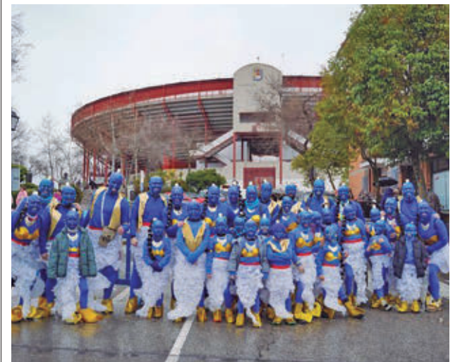
Participantes de una edición anterior

La fiesta se prolongará hasta las 5:00h y contará con un equipo de animación, efectos especiales, pirotecnia y un variado cartel musical.