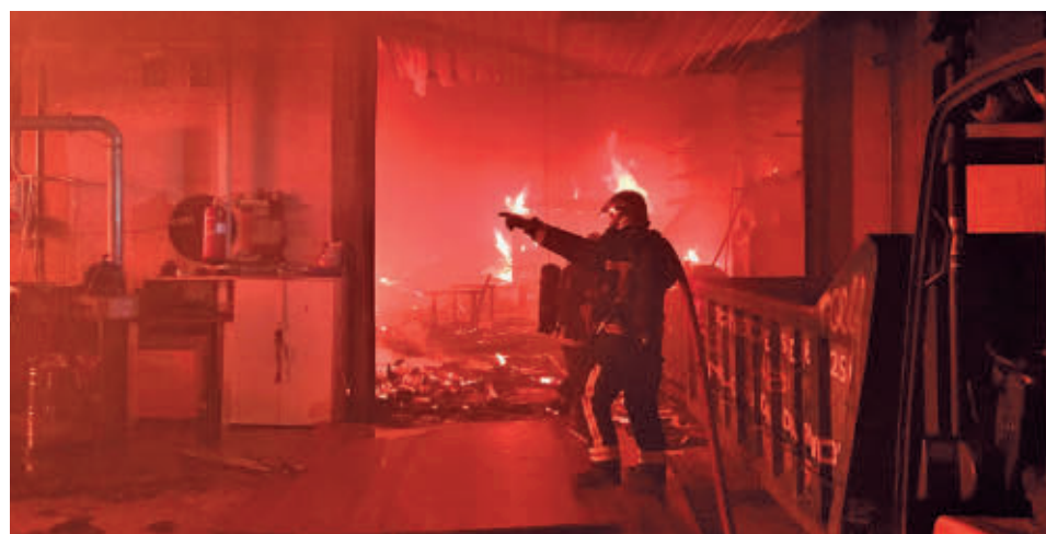
La rapidez a la hora de actuar es clave para el éxito de las intervenciones

LAS ASISTENCIAS TÉCNICAS LIDERARON LAS INTERVENCIONES EL PASADO AÑO