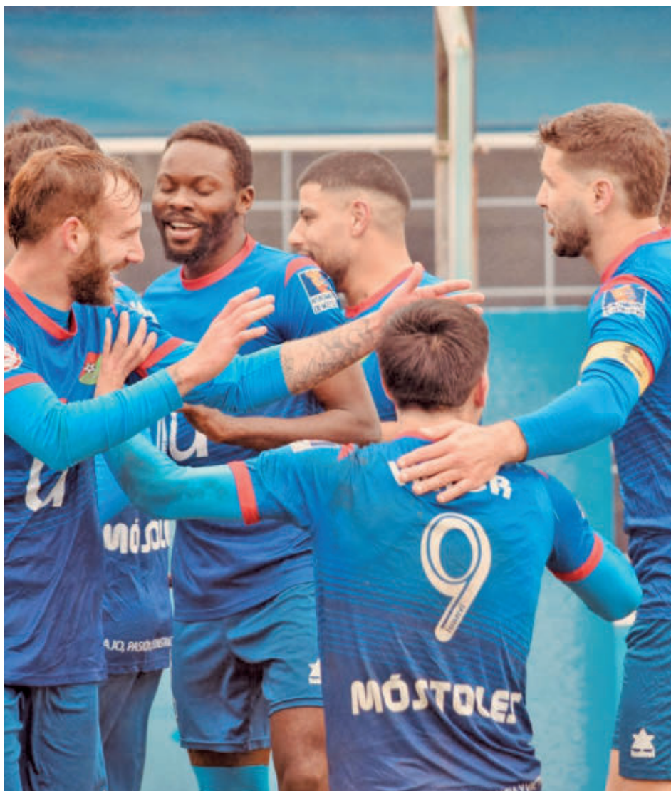
El CD Móstoles URJC sigue haciendo méritos para regresar a Segunda Federación

Con este contexto, se dibujan doce jornadas finales de infarto, lejos de la holgura que tenían los líderes en las últimas temporadas. A estas alturas, en la 21-22, el Atlético B aven-