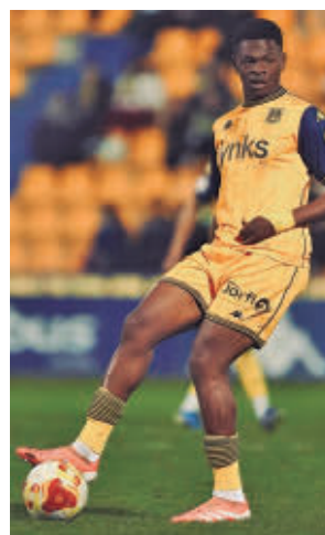
Triunfo del Alcorcón en casa

En lo que respecta al Grupo 1, el Real Madrid Castilla ocupa nuevamente plaza de 'play-off' de ascenso gracias a su triunfo ante el Athletic B (2-1). Este sábado visita a un Real Avilés en crisis.