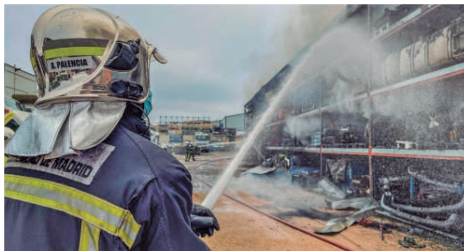
Un bombero refresca una edificación tras apagar un incendio

En lo que respecta a los municipios, Móstoles fue el