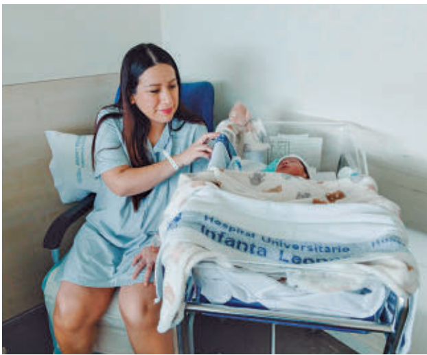
Una madre con su bebé recién nacido en Madrid E.P.