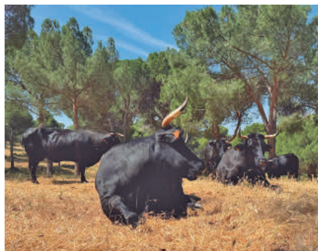
Ganado bovino pastando en la Comunidad de Madrid

La actuación de los animales es clave, pues elimina parte de la vegetación que en verano se convierte en combustible para los incendios. El