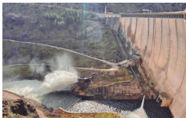
Embalse de El Atazar