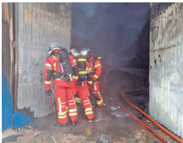
Nuevos uniformes: Los Bomberos de la Comunidad de Madrid han comenzado el año 2026 estrenando nuevos uniformes de color rojo, en lugar del tradicional azul marino. Los trajes actuales son más seguros para los efectivos madrileños.

Otro de los momentos más destacados del año en el que se registraron más intervenciones tiene que ver con las intensas lluvias del mes de marzo o con la fuerte tormenta del 2 de mayo, detalla la Comunidad de Madrid en un comunicado. Las precipitaciones de junio hicieron de este el mes con más intervenciones (con un total de 2.525) frente al mes de febrero, que fue el que menos operaciones de bomberos requirió. Las asistencias técnicas