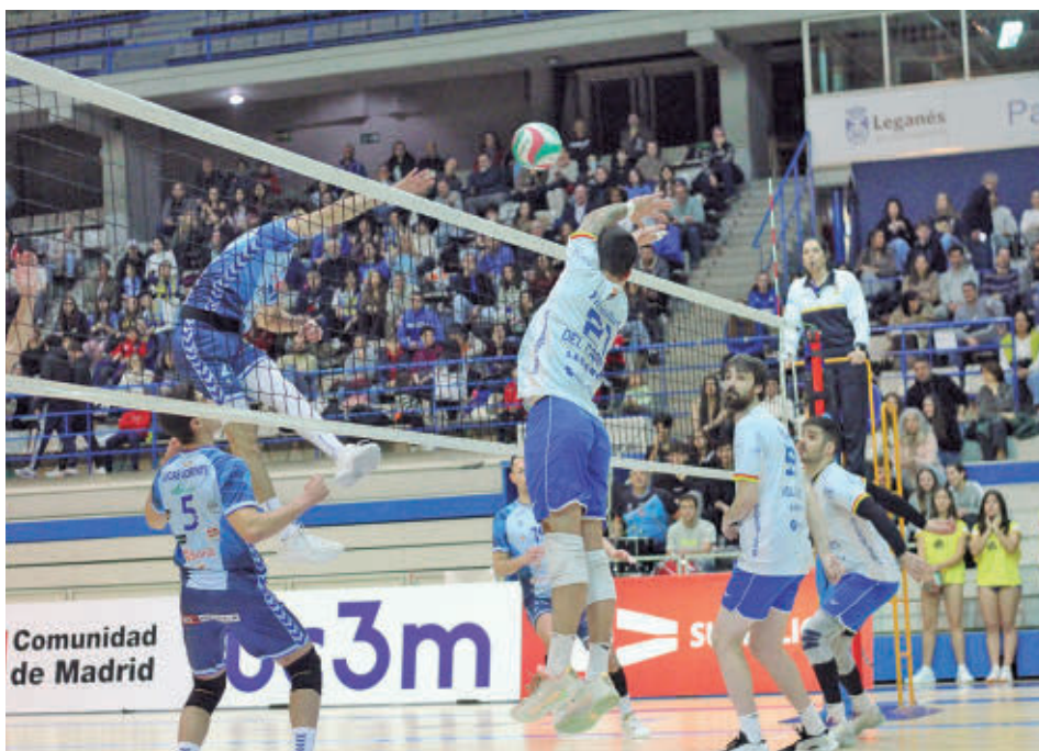
Imagen del encuentro ante el Herce Soria UC3M VOLEIBOL LEGANÉS