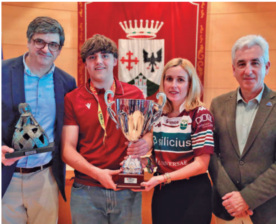
El acto tuvo lugar en el Salón de Plenos AYUNTAMIENTO DE ALCOBENDAS