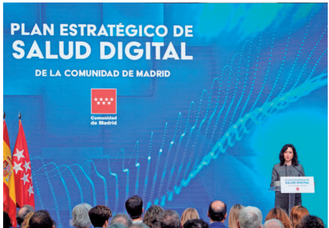
Presentación del plan en la Casa de Correos de la Puerta del Sol

La Comunidad de Madrid presenta una estrategia para los próximos tres años con la que pretende facilitar el trabajo a los sanitarios y mejorar la experiencia de los usuarios