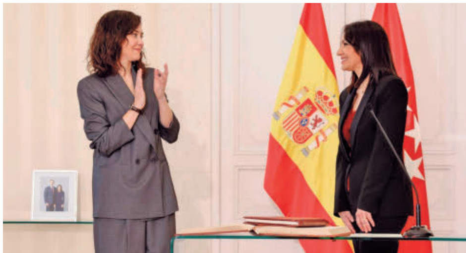
Díaz Ayuso acudió a la toma de posesión de Zarzalejo