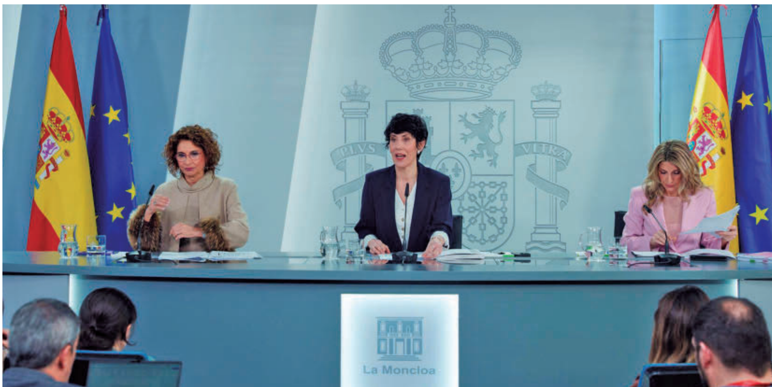
Rueda de prensa posterior al Consejo de Ministros en el que se subió el SMI EUROPA PRESS