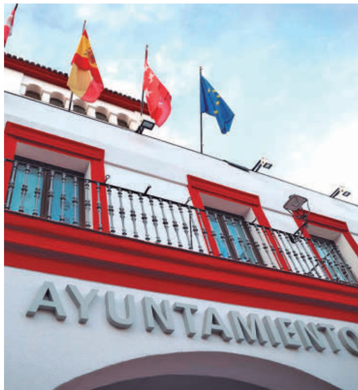
Ayuntamiento de San Sebastián de los Reyes

Sin embargo, desde el Gobierno local indican que esta medida está suponiendo “graves problemas” que afectan a la movilidad diaria de “miles” de familias de la localidad. Por ello, han expresado que, desde el inicio del corte, el Ayuntamiento ha exigido información actualizada a Carreteras del Estado y al Ministerio de Transportes, de