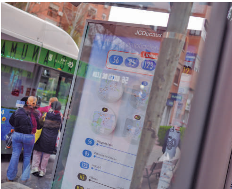
La nueva parada de la ruta urbana situada en la calle de Sierra Toledana, 23