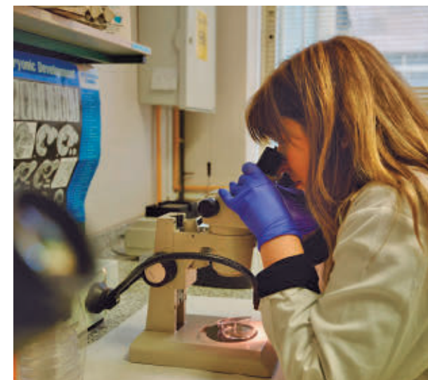
Una investigadora de los proyectos FUNDACIÓN ‘LA CAIXA’

El objetivo es poder tratar la enfermedad a través de la tecnología y la epigenética.