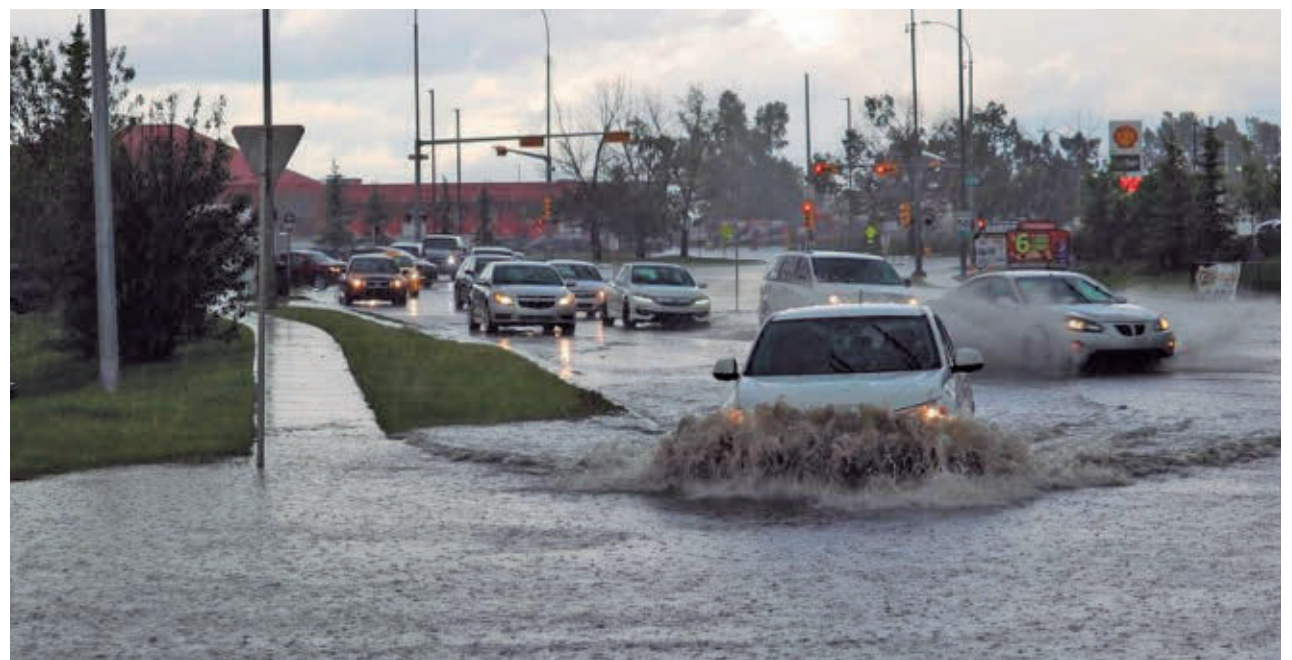
Las lluvias provocan una gran parte de los siniestros

El 11 de junio fue la jornada de mayor impacto, con