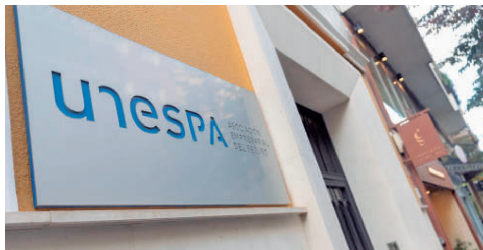
Sede de Unespa en Madrid E. P.

54,2 millones de euros en pagos, en su mayor parte correspondientes a tormentas de granizo muy gravosas. También el 12 de julio (35,2 millones) y el 13 de septiembre (15,2 millones) estuvieron marcados por episodios de granizo de elevada intensidad, que concentraron la mayor parte de los daños registrados en esas fechas.