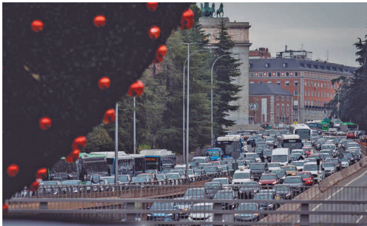
Tráfico intenso en el entorno de Moncloa