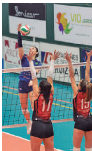
Derrota ante el Haro

al que llega el FEEL Alcobendas, desgraciadamente, sin ninguna opción de alcanzar la permanencia. Con 7 puntos en su casillero, el cuadro alco-