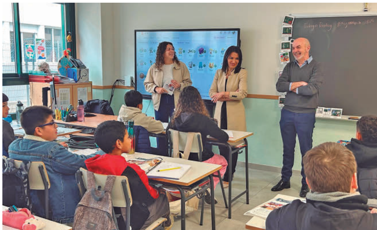
La consejera de Educación visitó esta semana un centro de la región

Otro de los puntos de interés es que en el próximo curso se duplicarán los colegios de Infantil y Primaria que imparten los dos primeros cursos de Educación Secundaria Obligatoria (ESO), medida que comenzó el pasado mes de septiembre con 52 centros