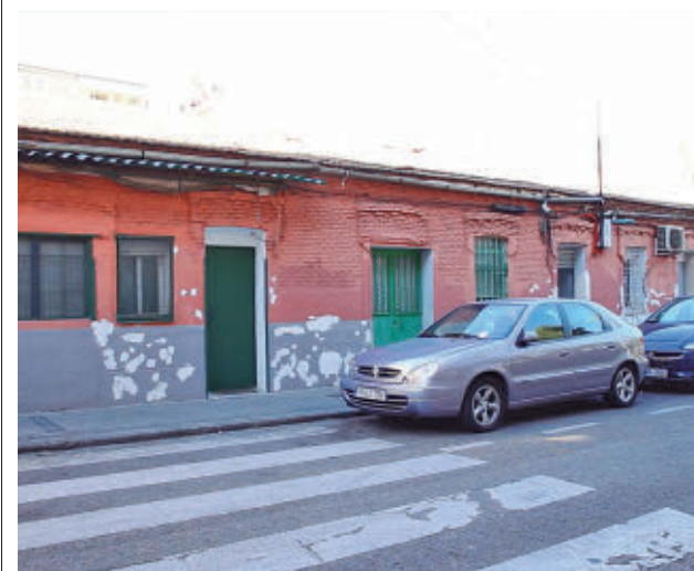
El icónico inmueble situado en el barrio de Entrevías

GenteMadrid.es Consulte la actualidad regional y local en nuestra página web