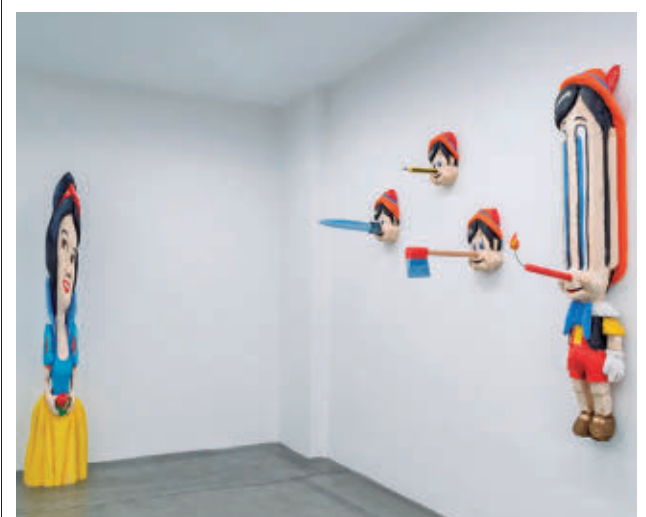
Una imagen de la muestra

El escenario del Gran Teatro Caixabank Príncipe Pío (Cuesta de San Vicente, 44) acogerá este espectáculo los días 18 y 26 de marzo, 9, 16, 23 y 29 de abril, 29 de mayo, 4, 11 y 19 de junio. Las entradas se pueden adquirir en la taquilla del propio teatro o a través de su página web oficial: www.laestacion.com .