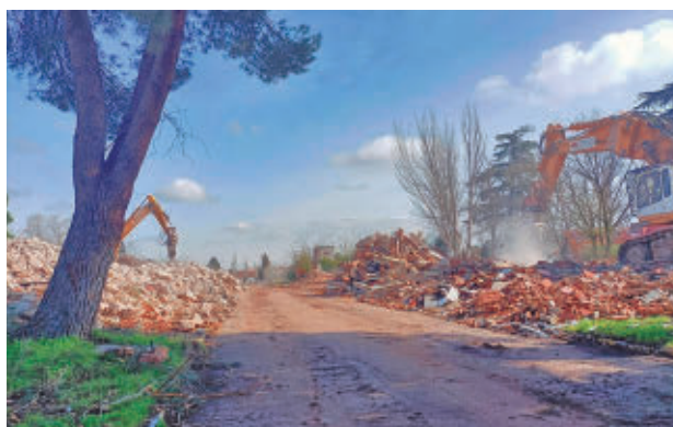
Los trabajos en las antiguas instalaciones militares