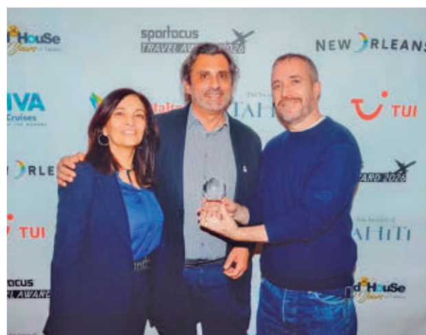
Entrega del reconocimiento en Berlín

Este reconocimiento, entregado el 4 de marzo en el marco de la feria ITB Berlín 2026, confirma la posición del país como "uno de los destinos más abiertos, segu-