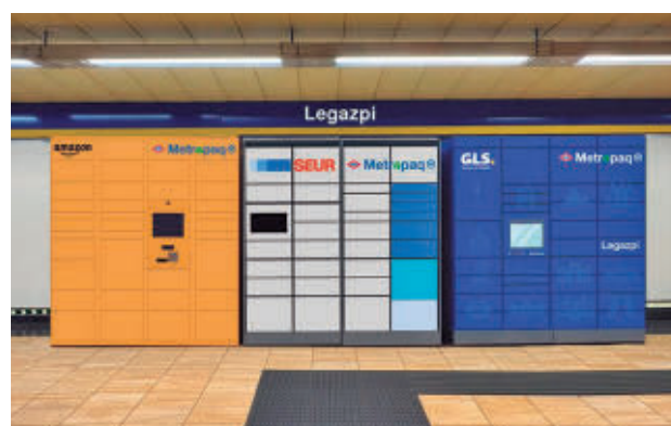
Taquillas inteligentes en Legazpi

Este sistema creará una red de 57 puntos de recogida con capacidad para gestionar más de 3.000 paquetes diarios, disponibles los 365