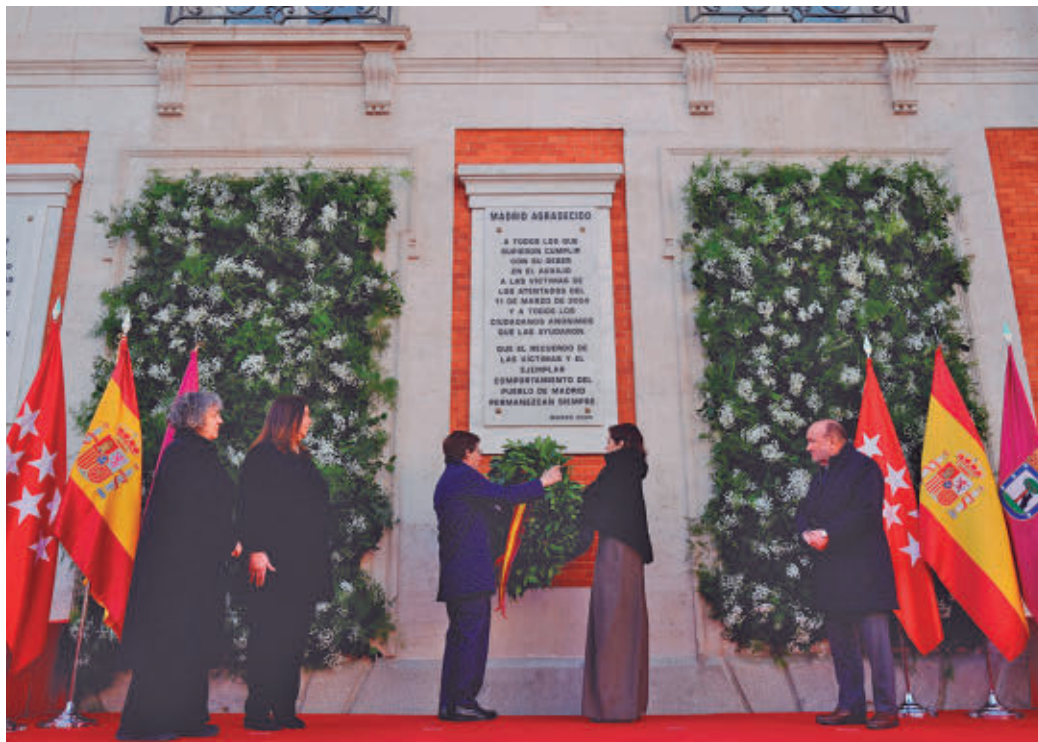
Almeida y Ayuso colocan la corona de flores

Ambos mandatarios se trasladaron después hasta el Bosque del Recuerdo del parque del Retiro para asistir, junto al presidente del PP nacional, Alberto Núñez Feijóo,