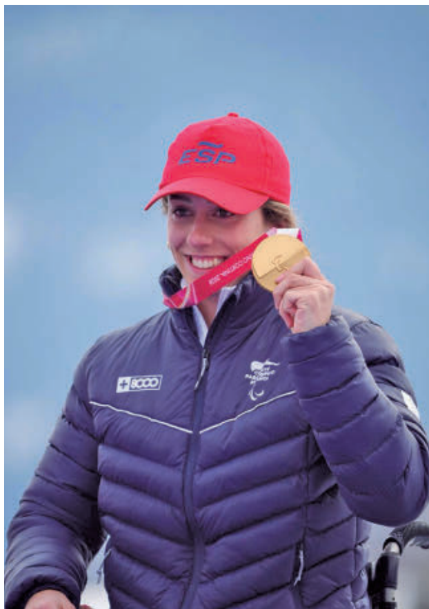
La esquiadora española, en el podio.

SUFRIÓ UNA CAÍDA EN LA PRIMERA MANGA DEL ESLALÓN GIGANTE