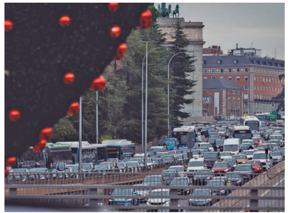
Tráfico intenso en el entorno de Moncloa

del aire sea buena. Desde el área de Urbanismo, Medio Ambiente y Movilidad explican que, si se produjera el incumplimiento de los valores límite de NO 2 en cualquiera de las 24 estaciones de la red de calidad del aire madrileña, se extinguirá el periodo tran-