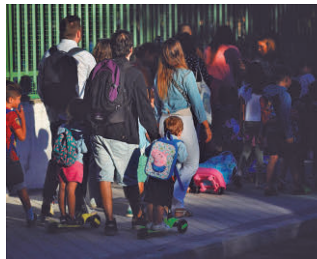
Ya está abierto el proceso de admisión