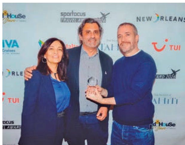
Entrega del reconocimiento en Berlín

Este reconocimiento, entregado el 4 de marzo en el marco de la feria ITB Berlín 2026, confirma la posición del país como "uno de los destinos más abiertos, segu-