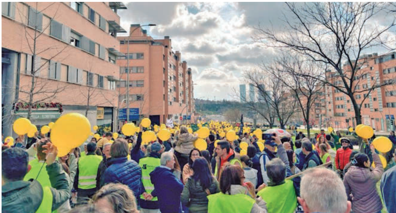
La última protesta vecinal del pasado 1 de marzo que congregó a cerca de 2.000 residentes @COLEMASCANTONNO