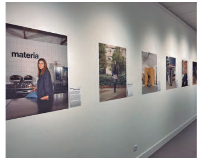
Varias de las imágenes de la exposición

Las cartelas de la exposición son una parte esencial del proyecto. En ellas, las mujeres comparten citas o fragmentos de su vida: historias de independencia, de memoria y de pertenencia al barrio, desde quien reivindica la libertad de ser una misma, hasta quienes recuerdan bares ya desaparecidos de Bravo Murillo, calles como Orense o Algodonales, mercados, centros culturales y comercios.