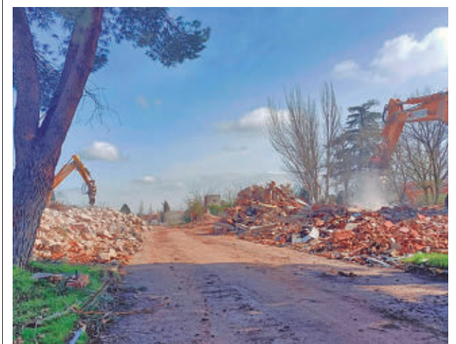
Los trabajos en las antiguas instalaciones militares

El estudio, realizado en colaboración con la Universidad Complutense de Madrid, destaca que son seis los principales estupefacientes: cocaína, cannabis, anfetamina, metanfetamina, MDMA y ketamina. Sustancias como el cannabis presentan un consumo relativamente estable a lo largo de la semana mientras que el MDMA repunta de manera principal durante los fines de semana.