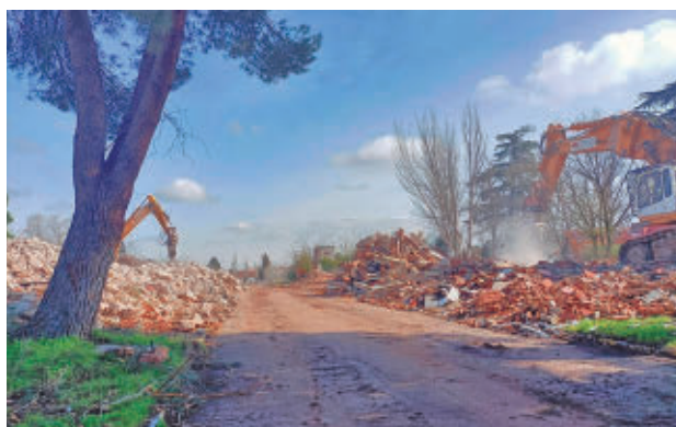
Los trabajos en las antiguas instalaciones militares