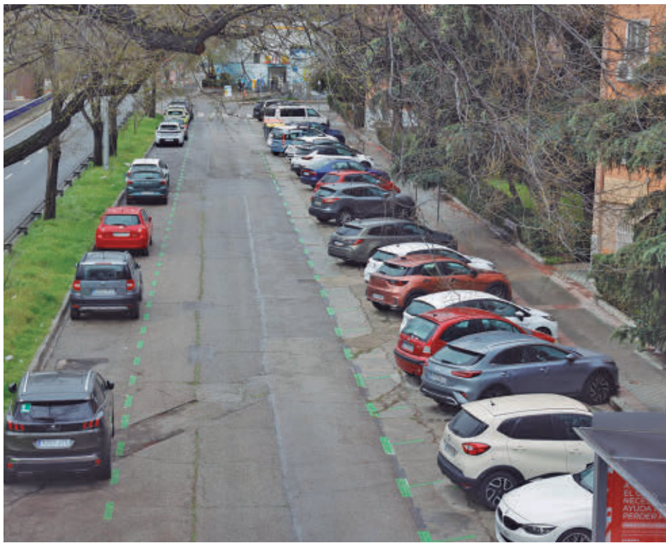
Una de las zonas reservadas para residentes del barrio carabanchelero