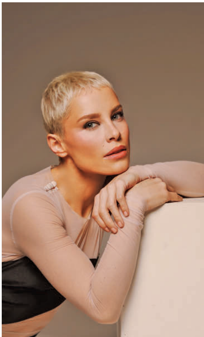
La voz de Soraya Arnelas, uno de los reclamos