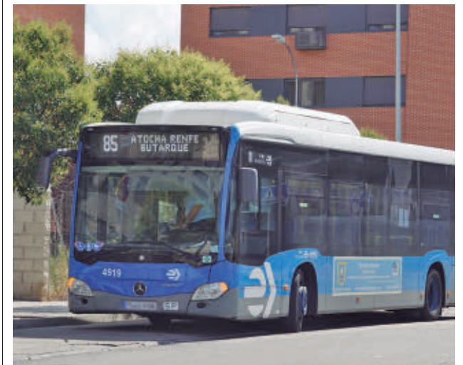
Uno de los autobuses de la línea 85 de la EMT

La misma coincide con las puestas en marcha en los barrios de Numancia (Puente de Vallecas) y Rejas (San Blas-Canillejas).