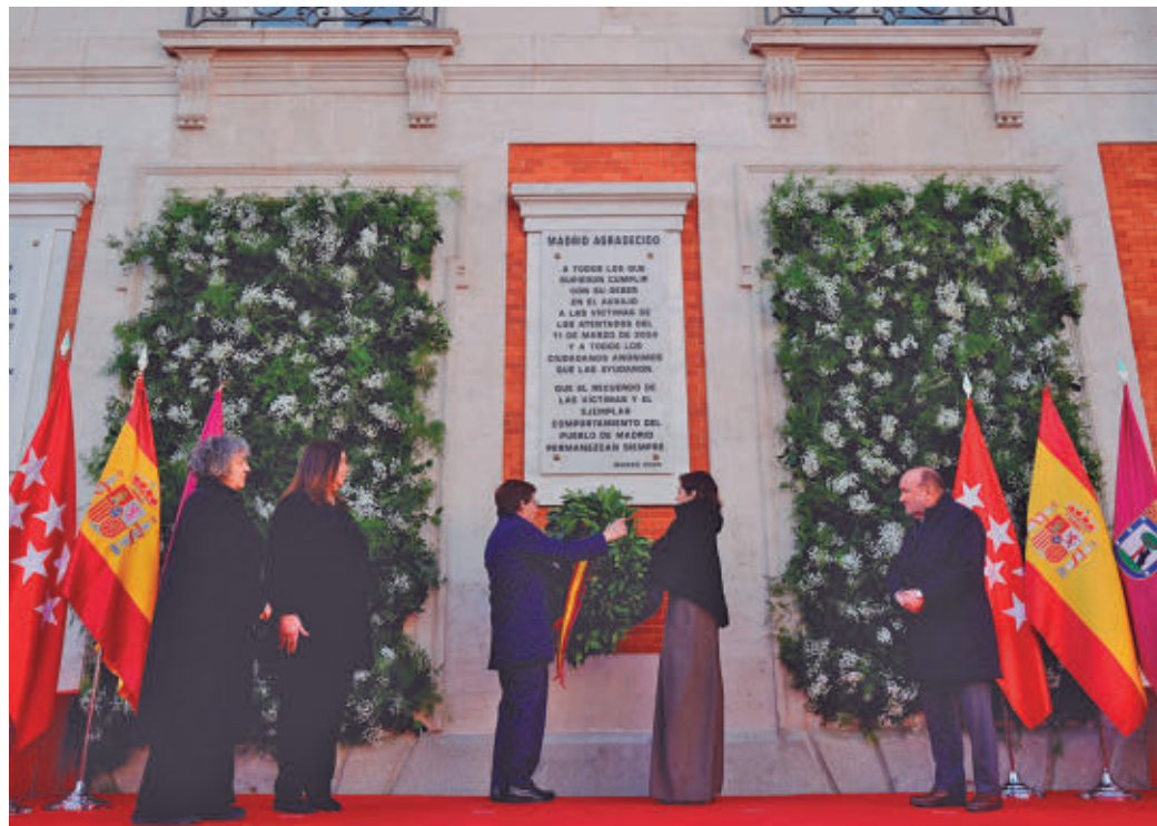
Almeida y Ayuso colocan la corona de flores

Ambos mandatarios se trasladaron después hasta el Bosque del Recuerdo del parque del Retiro para asistir, junto al presidente del PP nacional, Alberto Núñez Feijóo,