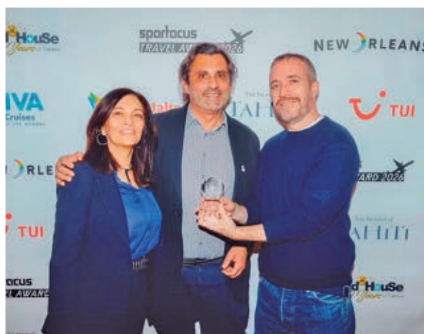
Entrega del reconocimiento en Berlín

Este reconocimiento, entregado el 4 de marzo en el marco de la feria ITB Berlín 2026, confirma la posición del país como "uno de los destinos más abiertos, segu-