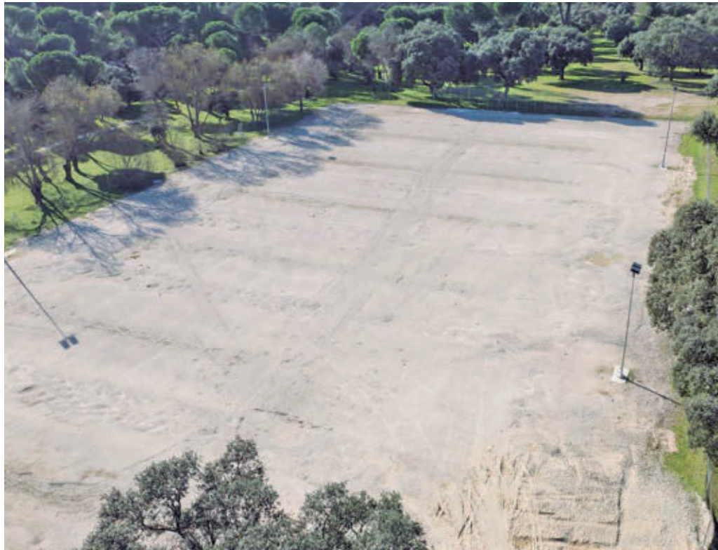
Parcela de Montepríncipe en la que se va a actuar

Con esta obra el Ayuntamiento impulsa la recuperación de la zona como espacio público de ocio y deporte, transformándolo en una zona verde abierta a los vecinos. Entre las actuaciones previstas se encuentran la creación de dos áreas infantiles con tres juegos cada una y pavimento de seguridad, una zona de aparatos de rehabilitación para mayores, una zona de ejercicios físicos al aire libre, un circuito biosaludable con varias estaciones de actividad, la instalación de