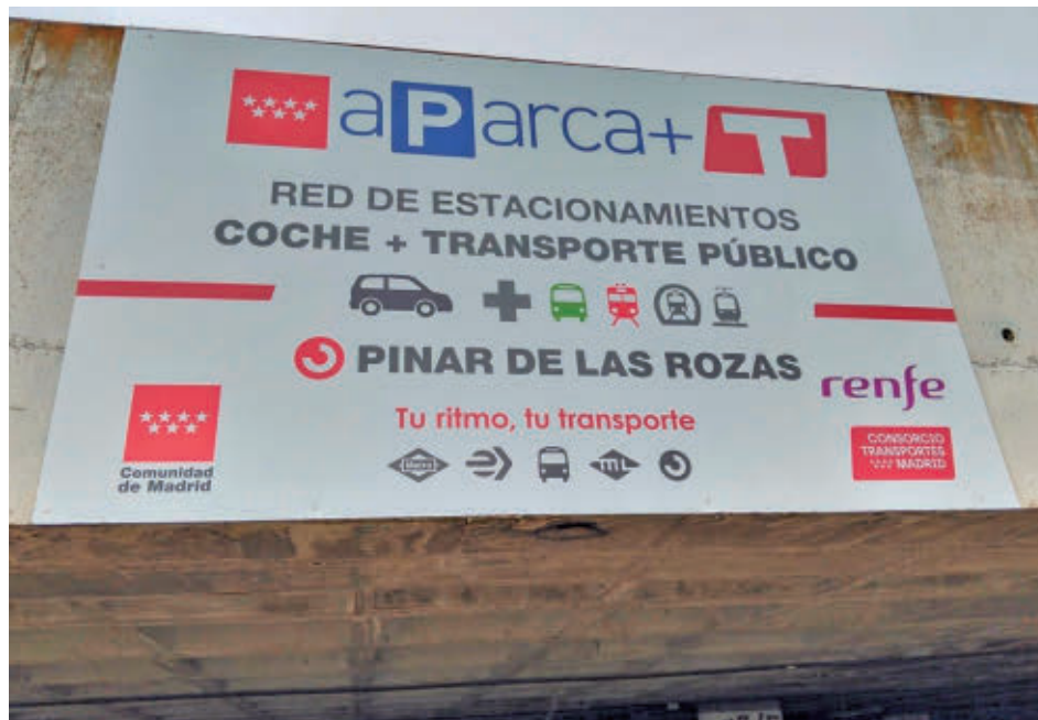
El cartel situado en la estación de Renfe de Pinar de Las Rozas

Para ello, los viajeros deberán tener un billete de transporte (títulos de Cercanías, tarjeta de transporte del CRTM y de 10 viajes de autobuses interurbanos) utilizado durante el intervalo de la estancia, que no deberá ser inferior a las 5 horas ni superior a las 16.