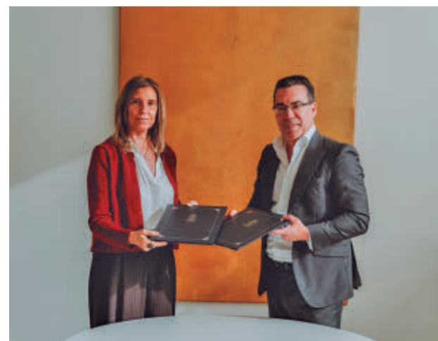
Presentación del Festival Mundial de la Felicidad

El tercer día del festival pondrá el foco en la educación, la cultura del bienestar