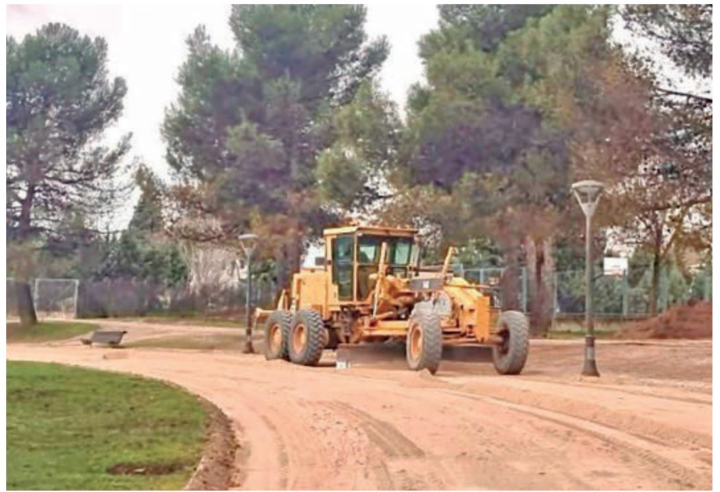
Uno de los caminos del Parque Juan Carlos I de Pinto

“Estas actuaciones forman parte del Plan de rehabilita-