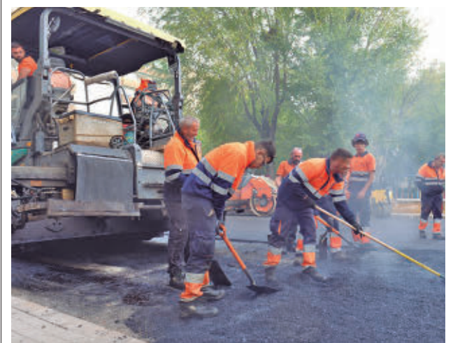
Labores de asfaltado en Valdemoro

En el juicio por el doble crimen, el taxista aseguró que ese día tuvo “lagunas” temporales a causa de la elevada ingesta del alcohol y manifestó que no es capaz de matar a nadie. Una prueba principal fueron las llaves del taxi del acusado encontradas en un charco de sangre en la escena del crimen. Además, se hallaron dos huellas de calzado en la sangre que coincidían con él y zapatillas de las que después se deshizo.