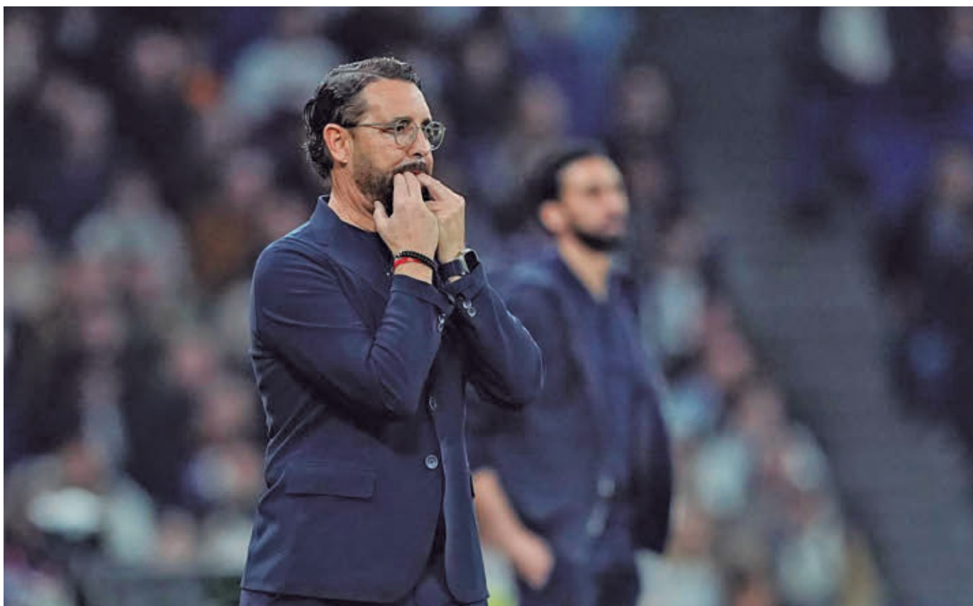
Bordalás alcanzó ante el Real Betis los 300 partidos en la máxima categoría