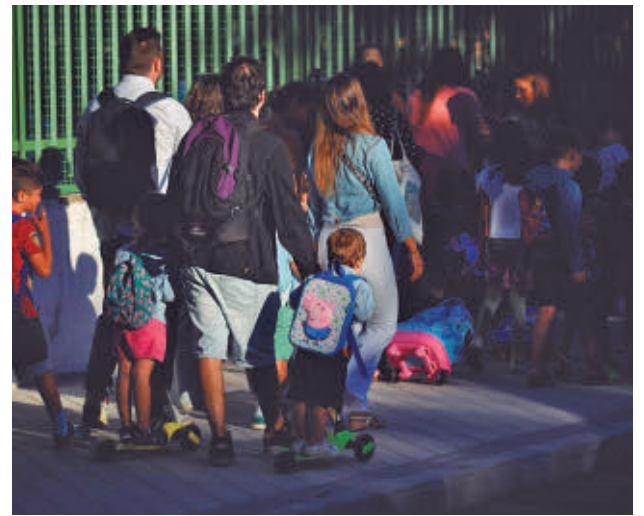
Ya está abierto el proceso de admisión