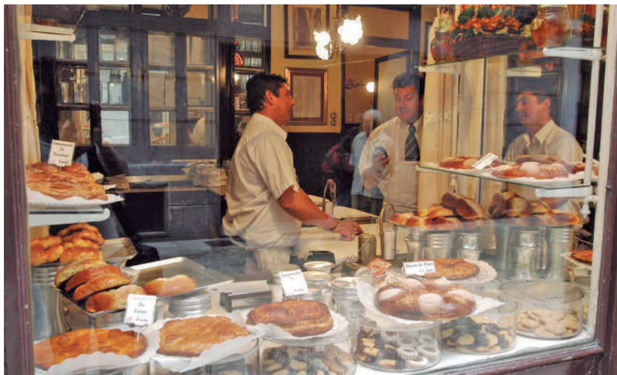
Los escaparates de las pastelerías volverán a exhibir los dulces característicos de estas fiestas

sas, aunque no es estrictamente tradición madrileña, la sopa de ajo, más conocida como 'sopa castellana', también se populariza en estas jornadas, como último guiso caliente para despedir la temporada de frío.