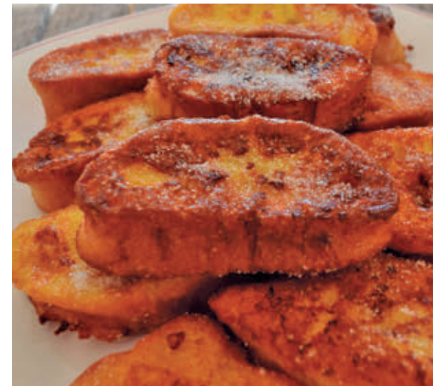
Las torrijas son los dulces más consumidos en estas fechas

La Asociación de empresarios artesanos de pastelería y panadería de la Comunidad de Madrid (Asempas) dice que este postre ha evolucionado desde la forma más sencilla y exquisita de aprovechar el pan duro, rebanadas empapadas en leche, hasta un catálogo de propuestas de repostería de autor que, año tras año, demuestra que, hablando de repostería y gastronomía, la creatividad no tiene límites.