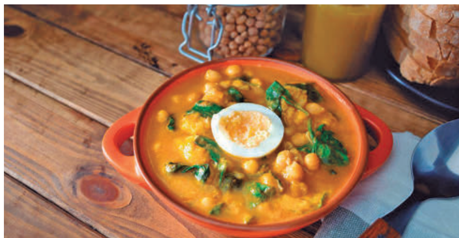
Una cazuela de potaje de vigilia, a base de bacalao, garbanzos y espinacas

Además, son muy característicos los soldaditos de Pavía, un aperitivo madrileño que consiste en una fritura de bacalao rebozado servida con pimiento rojo.