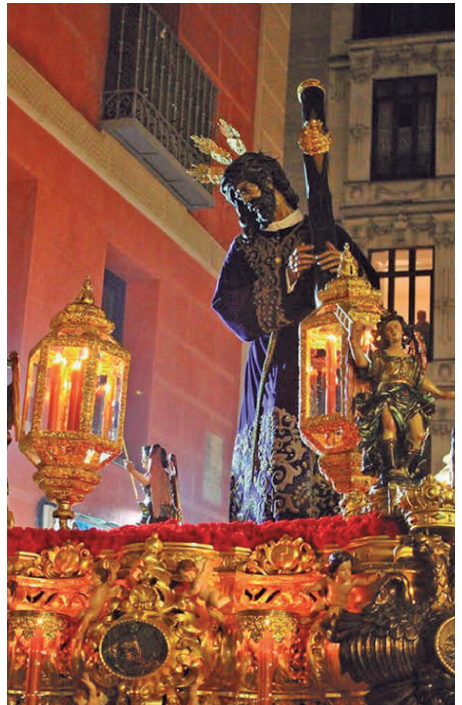
GRAN PODER Y MACARENA: Los nazarenos del Señor vestirán túnica negra con cola y antifaz negro, mientras que los de la Virgen irán ataviados con túnica y capa blancas, y antifaz de terciopelo verde esmeralda con emblema bordado en oro. Recorrido: Colegiata de San Isidro, calle de Toledo, Plaza Mayor, Puerta del Sol, calle Mayor y regreso a la Colegiata.

Por otro lado, la Plaza Mayor acogerá una exposición histórica en la que el visitante tendrá la oportunidad de admirar el testimonio, el valor patrimonial, cultural y religioso de las cofradías que conforman el alma de la Semana Santa madrileña.