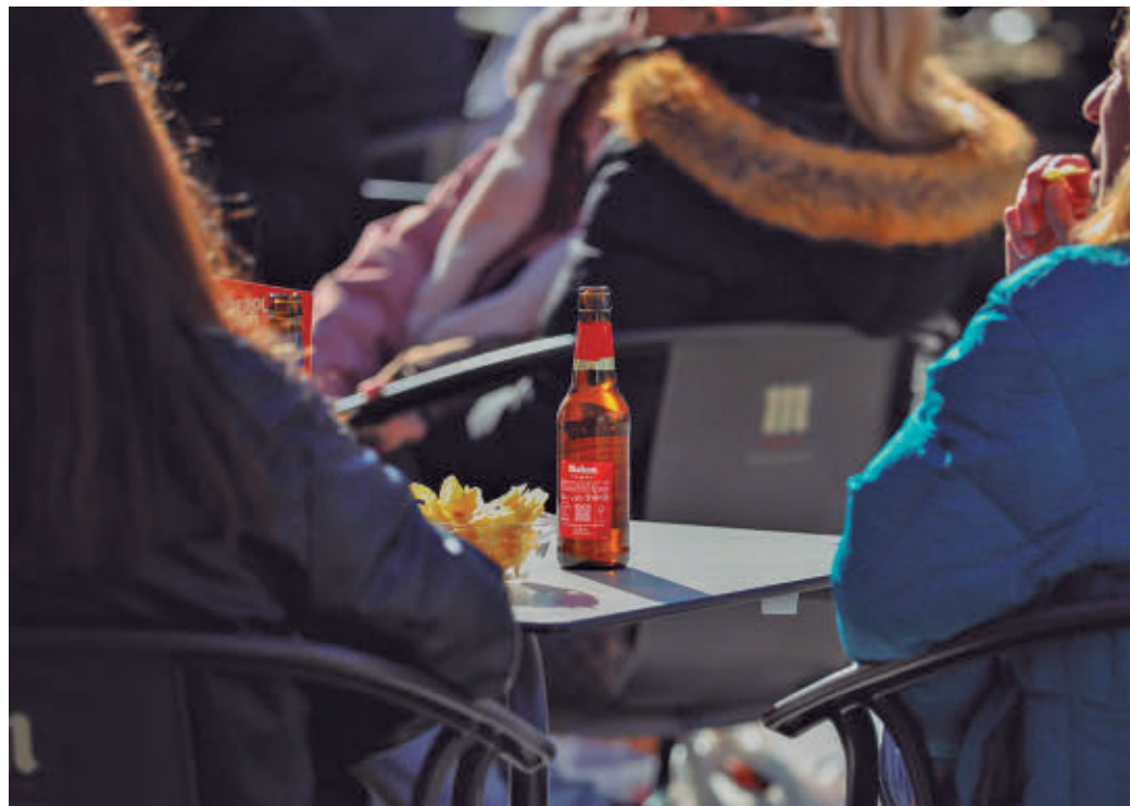
Terraza en la Comunidad de Madrid

Según la encuesta realizada por Hostelería Madrid a sus asociados, el 57,69% prevé una afluencia de clientes similar a la de la Semana Santa anterior. Frente a ellos, un 34,62% cree que acudirá menos gente a sus establecimientos, mientras que solo un 7,69% confía en registrar