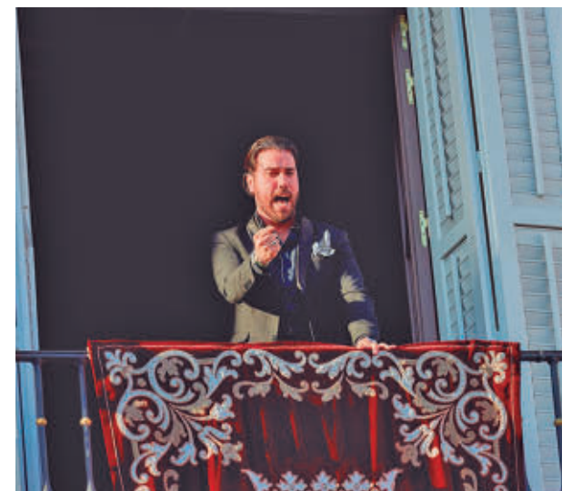
Una de las saetas cantadas en años anteriores