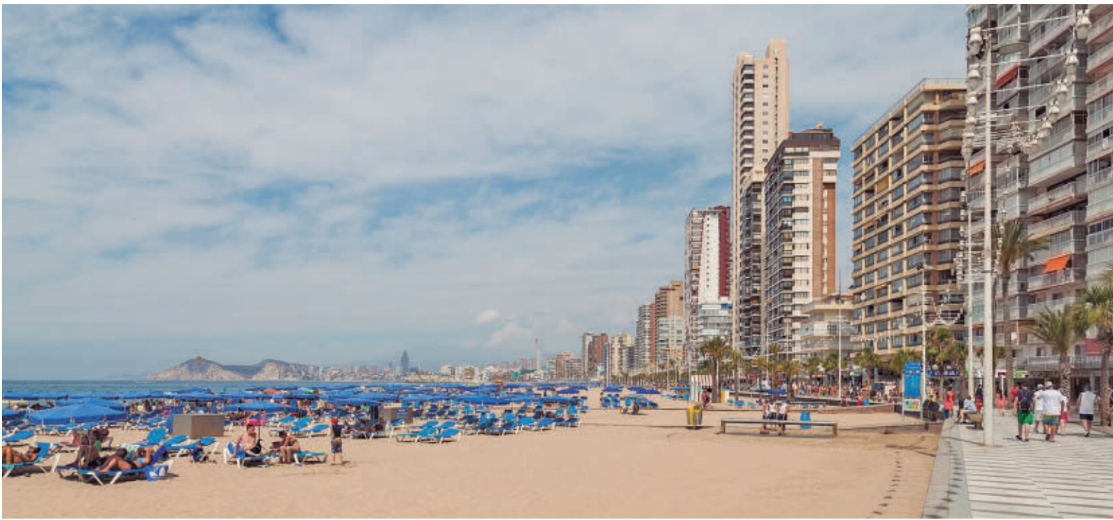
Los destinos de playa son los preferidos por los que van a salir de Madrid esta Semana Santa